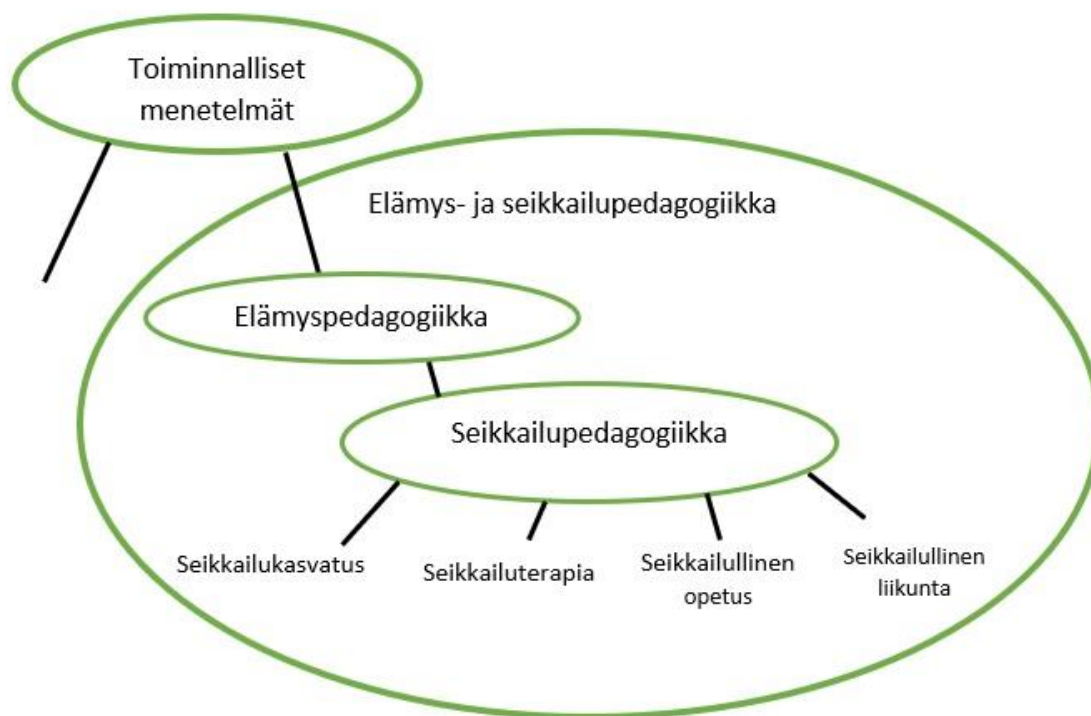
Kuvio 1. Elämys- ja seikkailupedagogiikka osana toiminnallisia menetelmiä. (Karppinen 2015, 55)

Suomessa käytetään edelleen käsitettä seikkailu- ja elämyspedagogiikka, mutta seikkailukasvatus on käsitteenä yleistymässä seikkailukasvatusverkoston kehittämistyöryhmän toiminnan myötä. Elämys- ja seikkailupedagogiikan toimijoita yhdistävä seikkailukasvatusverkosto käyttää yhtenäisesti käsitettä seikkailukasvatus. Kehittämistyöryhmän tavoitteena seikkailukasvatuksen valtakunnallinen kehittäminen, alan toimijoiden yhdistäminen sekä kehittämistarpeiden ja toimenpiteiden linjaaminen. (SNK 2021.)