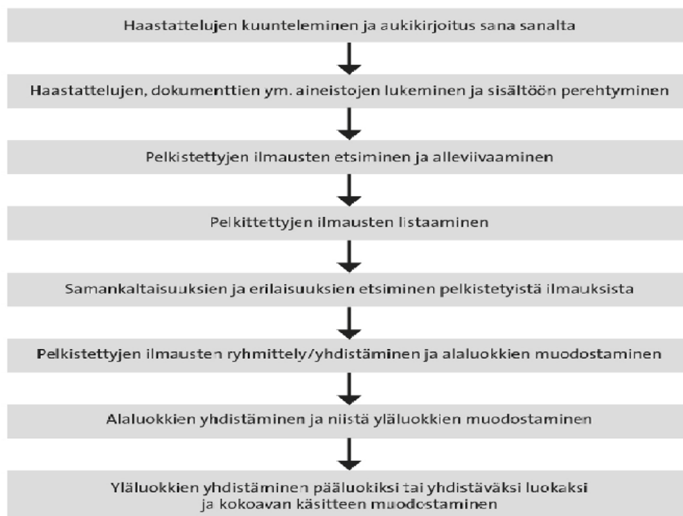
Kuva 2. Sisällönanalyysin vaiheet (Sarajärvi & Tuomi 2018: Luku 4.4.3)

Haastattelujen jälkeen nauhoitteet kuunneltiin ja litteroitiin eli kirjoitettiin tekstimuotoon. Analyysissa seurattiin Tuomen ja Sarajärven Laadullinen tutkimus ja sisällönanalyysi - kirjassa esitettyjä vaiheita.