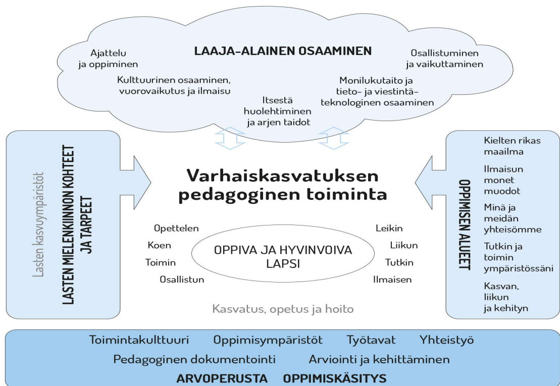
Kuvio 3. Varhaiskasvatuksen pedagogisen toiminnan viitekehys. (Opintopolku. ePerusteet. Varhaiskasvatus 2018)

Suunnitelmallinen toiminta perustuu varhaiskasvatussuunnitelman perusteissa määriteltyyn pedagogiseen toimintaan (kuvio 3). Pedagogiikalla tarkoitetaan kasvatusta ja varhaiskasvatustieteelliseen ja monitieteiseen tietoon perustuvaa asiantuntevasti johdettua ja ammattilaisten toteuttamaa toimintaa. Toiminta on tavoitteellista ja suunnitelmallista ja sen tarkoituksena on lasten oppimisen ja hyvinvoinnin toteuttaminen. (Varhaiskasvatussuunnitelman perusteet 2018, 22.)