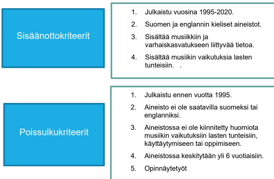
Kuvio 2. Sisäänotto- ja poissulkukriteerit