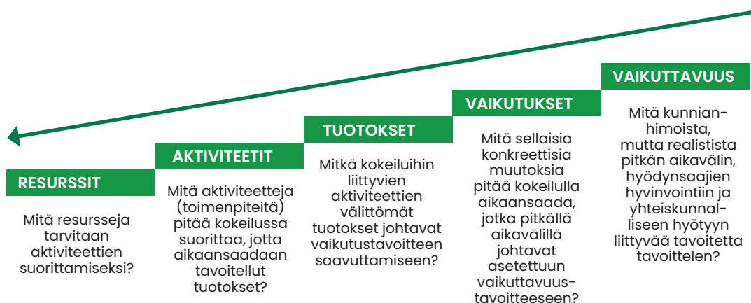
Kuvio 2. Kokeilun vaikuttavuusketju.

Kokeilun tuloksellisuutta ja vaikuttavuutta voidaan johtaa ja mitata vaikuttavuusketjun jäsentelyn avulla. Vaikuttavuudella tarkoitetaan tässä toiminnan välityksellä saavutetta- vaa, toimenpiteiden kohteena olevan asiantilan pysyvää kokonaismuutosta. Yleensä vai- kuttavuudella tavoitellaan yhteiskunnallista hyötyä ja hyödynsaajien hyvinvoinnin kestä- vää kasvua. Kokeilun vaikuttavuusketjun mallintaminen ja määrittely tehdään kuviossa 2 esitetyn prosessin mukaisesti siten, että ensiksi määritellään tavoiteltava vaikuttavuus ja sen jälkeen edetään vasemmalle vaiheittain kohti resurssianalyysia. Oleellista on mää- ritellä ketjun osat sanallisesti siten, että niiden pohjalta on mahdollista rakentaa tavoit- teiden toteutumista seuraavat mittarit eri vaiheille. Vertailemalla toteumaa asetettuihin tavoitetasoihin, on kokeilua mahdollista hallita ja johtaa tulosperusteisesti. (Motiva 2020 19 .)