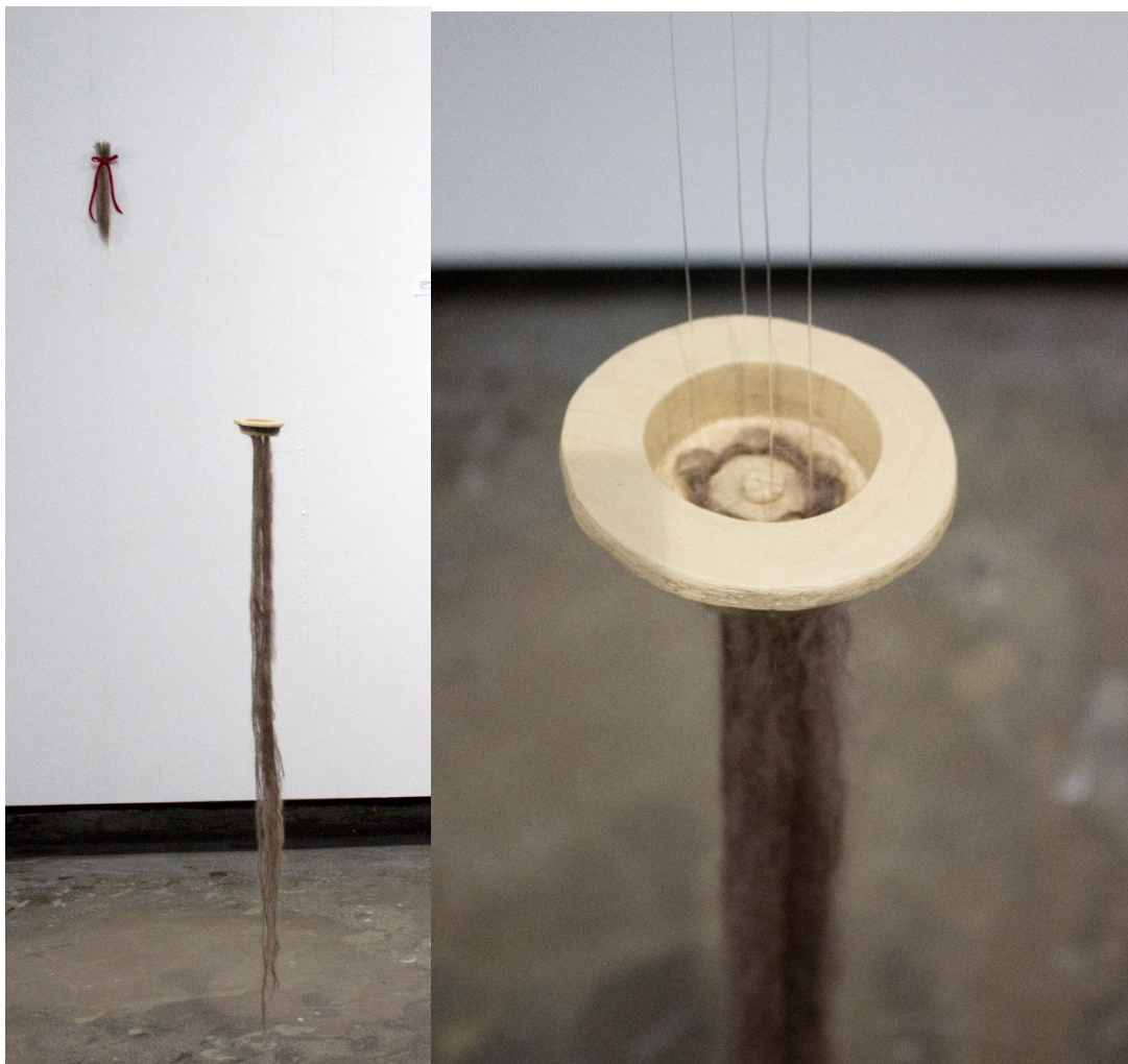
Kuva 6. Yleiskuva ja lähikuva teoksesta Suortuva (2021)

seinällä ja sen etäisyys viemärin siivilästä on määriteltävä siten, että useasta kulmasta katsottuna osat rinnastuvat toisiinsa ja ne ovat nähtävissä samanaikaisesti visuaalisesti tasapainoisena kokonaisuutena toisiinsa yhdistyen.