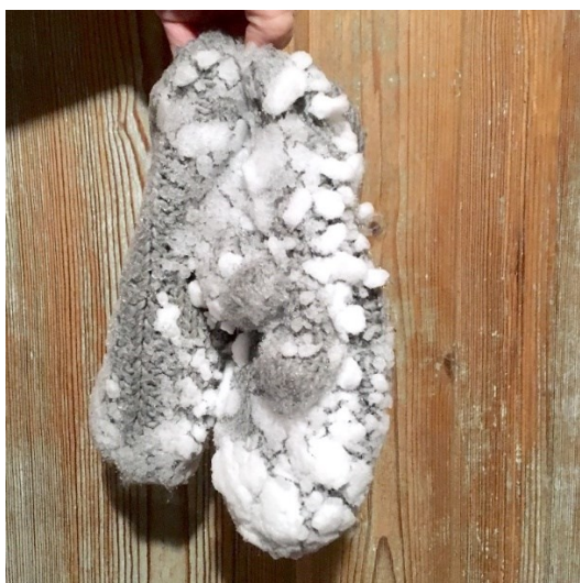
Kuva 2. Lumikokkareita villalapasissa.

Saako jo tulla sisään? -tekstiiliteos saa alkunsa kuvasta, jonka otan kotini eteisessä (kuva 2). Lapseni ojentaa minulle lumipaakkujen koristamat lapaset ulkoleikkien jälkeen. Lumipaakuissa ja lapasissa on sukupolvien yli ampaiseva informaation ja nostalgian dna. Yhtä lailla kuin oma jälkikasvuni nyt, minä itse, vanhempani ja isovanhempani sekä esivanhempani ovat kamppailleet lumileikeissään lumipaakkuja vastaan. Havainto on muistojen sivaltava.