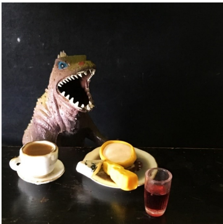
Kuva 1. Huono aamu (2018). Arkiaiheiden tulkitsemista kotitöiden tekemisen lomassa.

Lelujen ottaminen mukaan arkityöhön muuttaa monet arjen puuduttavatkin askareet hausemmiksi. Havainnoin arkea pienten lelujen näkökulmasta ja julkaisen kuvat sosiaalisessa mediassa liittäen mukaan lyhyitä kuvatekstejä kuvien tapahtumista. Tekstillä pyrin luomaan kuviin tarinallisuutta ja kerrostamaan kuvan sisällöllisiä merkityksiä. Kuvat syntyvät hyvin spontaanisti ja leikkitelevästi kotiarjen lomassa. Hetkessä tapahtuva työskentely on mukavaa vaihtelua työelämässä suoritetuille tekniikoiltaan hitaille animaatioprosesseille ja tekstiiliteosten työstämiselle.