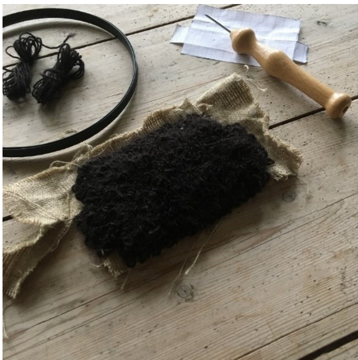
Kuva 4. Tuftaustekniikkaan tarvittavat välineet teokseen Nopeaa arkiruokaa (2021)

Toteutan kalapuikot tuftaamalla (kuva 4). Tuftaus on käsityötaiteen historiassa ryijynsolmintaa harjoittaneessa Suomessa vähemmän käytetty käsityötekniikka. Maailmalta vasta viime vuosina Suomeenkin rantautuneessa tekniikassa tuftausneulalla lyödään lankaa kehukseen kiristetylle kankaalle. Kankaan nurjalle puolelle muodostuu lenkki ja työskentelypuolelle lankapistoja tekijän käsialan mukaan. Teoksen käyttötarkoituksen mukaan kumpi vain työn puolista voi olla päälle tuleva puoli. Nurjalle valittu puoli käsitellään esimerkiksi lateksilla, jottei työ pääse purkautumaan.