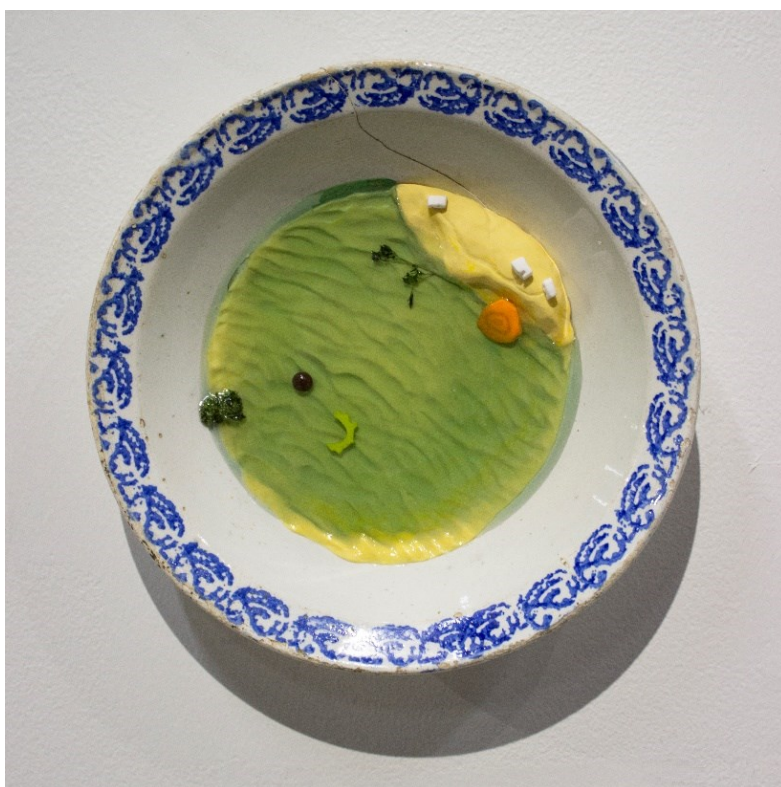
Kuva 10. Lomamatka (2021).

Arki ja loma muodostavat vanhalle keittolautaselle rakentuvan teoksen Lomamatka pääkonfliktin eli vastavoimat (kuva 10). Valmiissa teoksessa ovat samaan aikaan toisaalla tuttu ja turvallinen arki, toisaalla houkuttelevat kaukomaat ja meriveden liplatus. Teoksessa yhdistyvät lapsuusmuistot aikuiseen arkeen ja velvollisuudet vastuineen virkistävään haaveiluun. Teos kuvaa myös sivukonflikteina laajempia kysymyksiä, kuten jäädäkö vai lähteä.