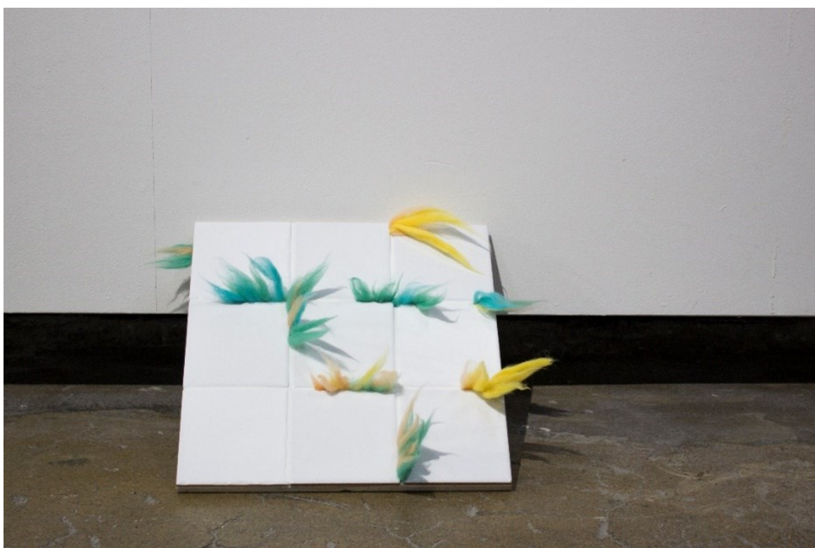
Kuva 7. Saumat (2021) ripustettuna seinän ja lattian väliin kolmiulotteisuuden korostamiseksi.

Saumateokseen (kuva 7) kaakeloin kaakeliliimaa käyttäen 9 valkoista 15x15 senttimetrin keramiikkalaattaa 150 millimetriä paksulle mäntyvanerille. Saumat kohdistan silmämääräisesti, jotta lopputulos ei ole liian teollisen näköinen tai jäykkä. Saumaan kaakelien välit valkoisella saumalaastilla kaakelille kaakelikynällä merkitsemieni luonnosten mukaan. Kokonaisuudessaan teoksesta tulee 460x460 millimetrin kokoinen ja 250 millimetriä paksu. Tässä työvaiheessa se voisi olla rautakaupassa esillä oleva kaakeloitu laattamalli.