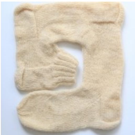
Liite 1c. Anu Tuominen: Naisen mitta? (sukan kantapäätä) (2019).