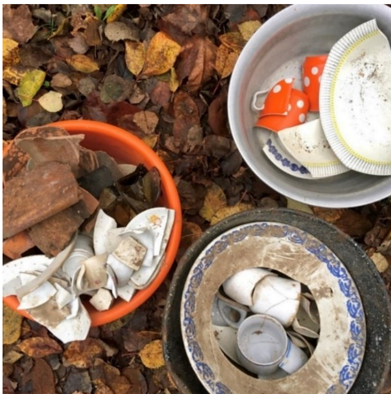
Kuva 9. Astioita sirpaleina, etualalla pohjaton lautanen.

Arjen sietokyky näkyy yksilöillä erilaisina tarpeina. Osa ihmisistä sanoo tarvitsevansa matkustamista, vaikkei se hengissä pysymiseen liittyvä tarve suoranaisesti olekaan. Jos nuoruudessa itse matkustaminen ja matkalla olo on tarkoitus, voi keski-ikäiselle riittää iloksi pelkkä matkan ajatus. Matkan ajattelemisen voi rentouttaa, mutta kun ryhtyy ajattelemaan matkan toteuttamista kaikkine matkatavaroiden raahaamiseen ja aikuisine velvollisuuksineen, muista huolehtien uusissa ennakoimattomissa ympäristöissä, matkan rentouttava ajatus katoaa. Matkan ajattelu on pakotie arjen rutiineista, mutta ajatuksen syvyyttä on säädeltävä. Matkan ajatus toimii matkan metaforana, mutta liian pitkälle, jopa konkretian tasolle siirtyvä matkan ajattelu voi jopa riisua matkustamisen halun.