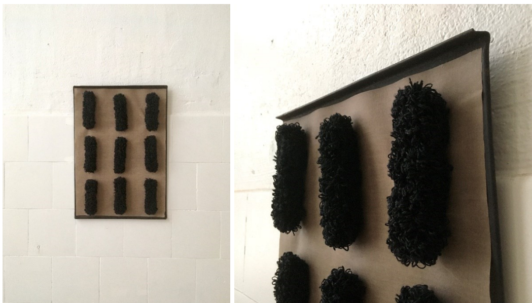
Kuva 5. Tuftaten toteutettu teos Nopeaa arkiruokaa (2021) gallerian seinällä.

Luonnostelen okran värissä työstettyä tekstiiliveistosta kalapuikosta työnimellä Arjen kruunu tai Ylistetty olkoon. Hakeudun materiaaliostoksille, sillä kalapuikon väristä lankaa on vain sattumanvarainen kerän loppu varastoissani. Ja niin käy, kuten usein teosta suunniteltaessa: oikean väristä lankaa ei ole enää saatavilla. Lankakarttojen värit eivät ole ikuisia vaan vaihtelevat erän ja sesongin mukaan. Uusi vastoinikäyminen pakottaa ajatukset uusille poluille. Keittiön hiiltyneet kalapuikot alkavat piirtyä lankakaupan hiilenmustan langan kanssa teokseksi (kuva 5).