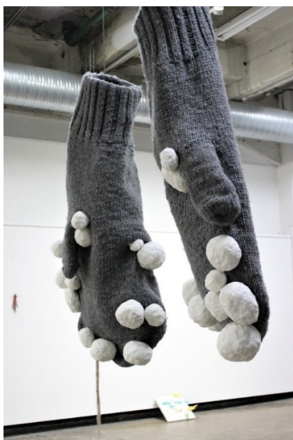
Kuva 3. Saako jo tulla sisään (2021) näyttelytilassa Kaapelitehtaalla.

Kolmiulotteinen teos vaatii ripustuksessa tilaa ympärilleen (kuva 3). Teoksen tulee näyttää joka puolelta yhtä hyvältä eikä se saa ryhmänäyttelyssä piilottaa muiden teoksia taakseen. Kaapelitehtaan Valssaamoon teos Saako jo tulla sisään ripustetaan melko keskelle näyttelysalin takaosaan katossa olevista ripustustangoista. Ripustuksessa alkuperäinen ajatus neljäpisteisestä siimaripustuksesta vaihtuu kokeilemisen kautta yhdellä köydellä ripustamiseksi ja teoksen pyöriminen estetään liittämällä lapaset läpikuultavalla siimalla toisiinsa.