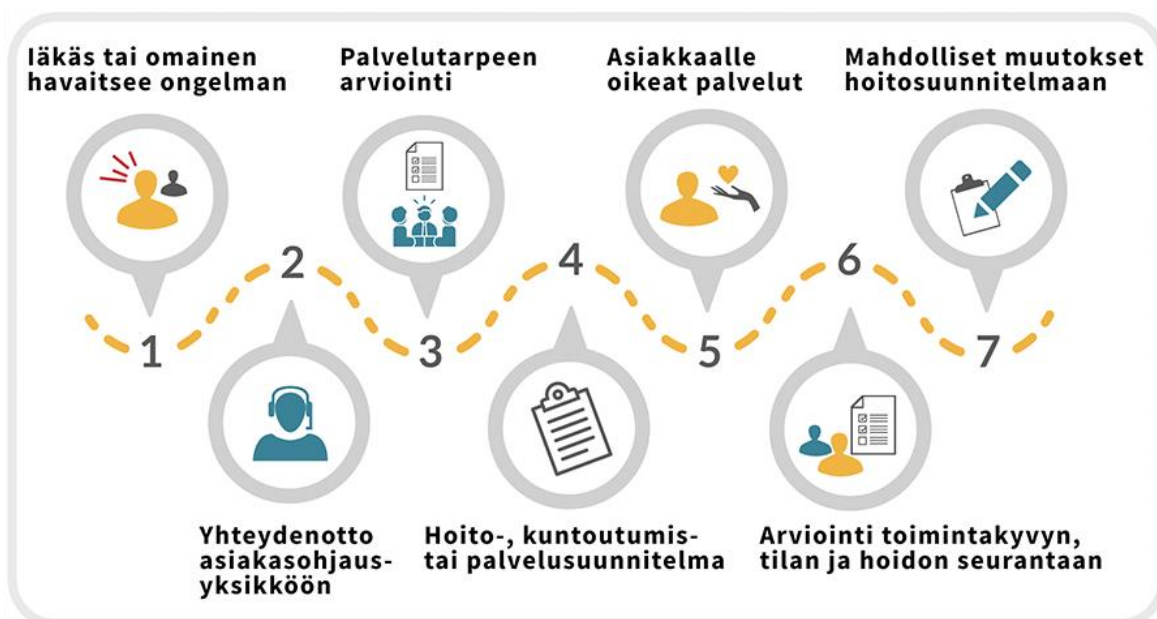
Kuvio 1. Ikääntyneen palvelutarpeen arviointi (Terveyden- ja hyvinvoinninlaitos 2021)

Päijät-Hämeen hyvinvointikuntayhtymän hallitus hyväksyy vuosittain ikääntyneiden palveluiden myöntämisperusteet. Myöntämisperusteiden avulla palvelujen kokonaisuus on helppompi hahmottaa. Palveluihin hakeudutaan asiakasohjaus Siirin kautta, jonne tehdään suullinen tai kirjallinen hakemus. Laaja-alainen, maksuton palvelutarpeen arviointi tehdään vanhuspalvelulain 15§:n mukaisesti. Palveluiden myöntämiseen vaikuttaa asiakkaan toimintakyky, taloudellinen tilanne, sosiaalinen verkosto ja asumisolosuhteet. RAI-mittaristolla arvioidaan toimintakykyä. Sosiaalihuollon palveluista saa päätöksen kirjallisen ja se on valituskelpoinen. Haettaessa tehostettuun palveluasumiseen asiakkaan on tarvittava hoitoa ympärivuorokautisesti ja toimintakyvyn pitää olla alentunut merkittävästi. Lisäksi asiakas ei enää pärjää kotona kotiin vietävien palveluiden turvin. Ennen tehostetun palveluasumisen myöntämistä asiakas voidaan ohjata arviointijaksolle, jonka perusteella voidaan tehdä myönteinen päätös tehostetusta palveluasumisesta. (PHYKY 2021.)