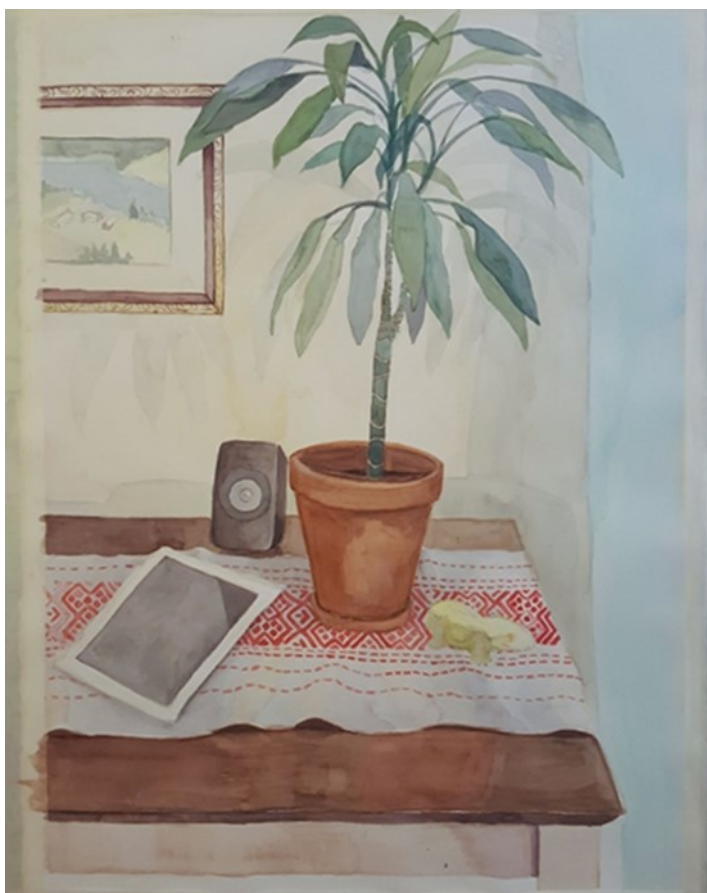
Kuva 9. Toisen teoksen työstövaihe

Koska esineitä pöydällä ei ollut paljoa, halusin käsitellä teoksessa myös paljon isoja pintoja, kuten takana näkyvää seinää, varjoja ja pöydän pintaa ja esimerkiksi pöydän päällä olevaa vanhaa pöytäliinaa. Myös kasvin lehtien kerroksellisuus ja seinään tulevat haaleat varjot kiinnostivat, sillä vesiväreillä pystyisi tekemään ohuita värikerroksia suhteellisen helposti. Työstin ensiksi isoja pintoja, jonka jälkeen lähdin tekemään enemmän yksityiskohtia ja keskityin työstämään esimerkiksi kasvia, ruukkua ja muuta pöydällä olevaa (kuva 8).