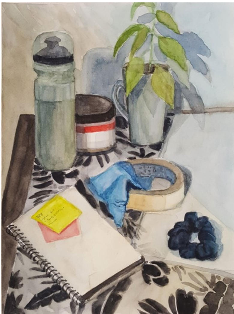
Kuva 6. Luonnos