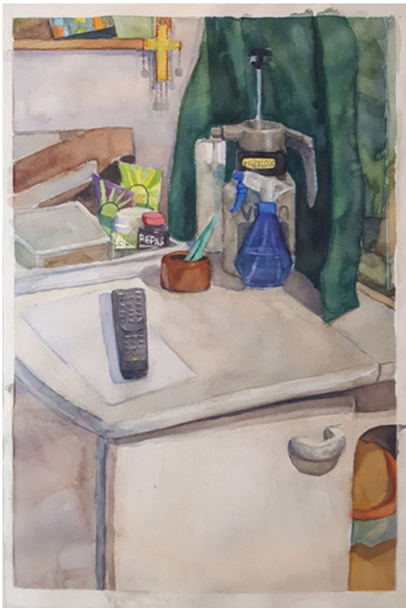
Kuva 7. Terraariopöytä

valo, joten lähdin tätä kautta työstämään varjoja hieman kylmemmillä väreillä, jolloin objektit tulisivat ehkä hieman enemmän esiin lämpimän värisestä taustasta.