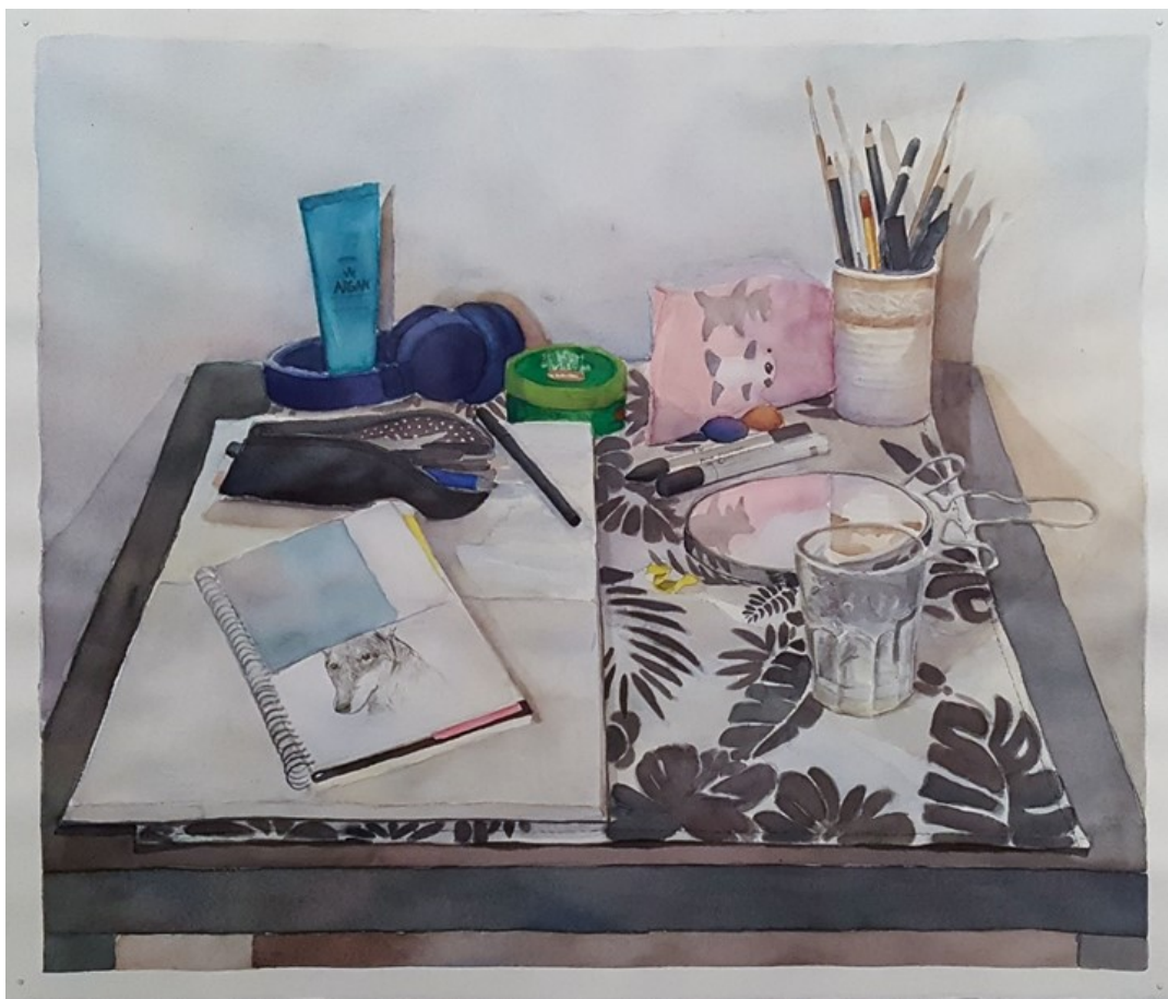
Kuva 13. Valmis teos

Viidennen teoksen kohteena oli tietokone ja opiskelupöytä (kuva 14). Kohteessa eniten kiinnosti pöydällä olevat esineet, etenkin lamppu, sekä taustana oleva peittävä tumma verho. Erityisesti minua kiinnosti myös tumman taustan ja valkoisen pöydän ja siinä olevien tavaroitten kontrasti tummaa taustaa vasten. Ajattelin myös, että tietokone ja muut tietokonepöydällä olevat esineet toisivat teosta hieman nykyaikaan, sekä omaan arkeen ja aikaan.