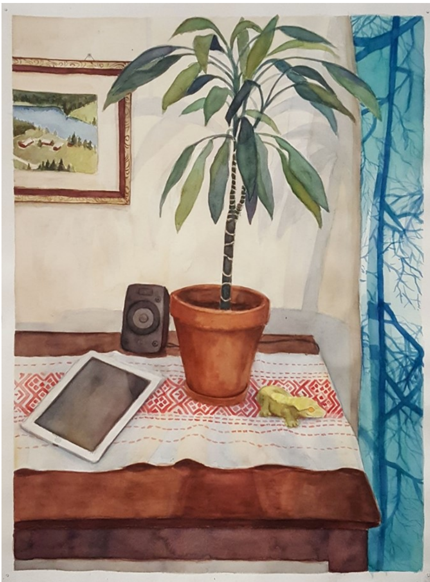
Kuva 10. Toinen teos

Kolmatta teosta työstin myös lapsuuden kodissa. Visuaalisen havainnon kohteena oli vanha keittiöpöytä, jolta löytyi vanha pöytäliina, hedelmiä, kynttilä ja hyasinttiasetelma. Teoksen aloitus hetkellä minulla ei ollut sen isompaa syytä miksi juuri kyseinen kohde kiinnosti minua. Valitsin kyseisen näkymän varmaankin värien ja esineiden perusteella. Varsinkin vanha punainen pöytäliina. Pohdin melko kauan mistä suunnasta lähestyisin kyseistä näkymää ja päätin että kohdetta olisi parempi katsoa hieman ylempää, jolloin itse pöytäliina näkyisi paremmin. Pöydän ja ikkunalaudan diagonaaliset linjat myös vaikuttivat hieman siihen mistä kulmasta lähdin kuvaamaan näkymää, sillä halusin kuvaan hieman enemmän dynaamisuutta, kuin sen että olisin kuvannut näkymää, vaikka suoraan edestä tai sivusta.