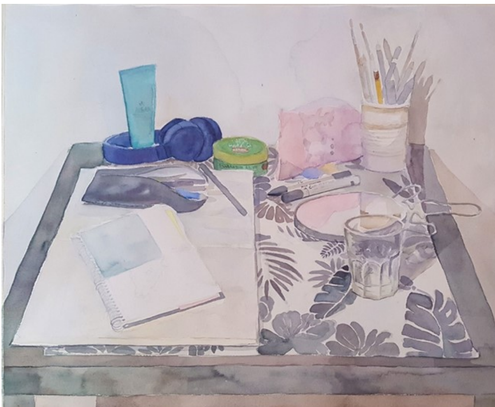
Kuva 12. Neljännen teoksen työstövaihe

Pääasiassa asetelman tai näkymän tavarat olivat melko tasaisesti pöydällä, eikä mikään pompannut ulkomuodoltaan kauheasti. Ainoastaan värit ja niiden intensiivisyys erottelee tavaroita toisistaan. Teokseen koitin saada melko neutraalia värimaailmaa ja nostaa tiettyjä tavaroita enemmän esille, kuten juuri etualalla olevaa lasia ja luonnoskirjaa ja penaalia (kuva 13). Kyseinen teos opetti minulle ehkä eniten työskentelemään erilaisten kosteusarvojen ja maalaustekniikoiden kanssa.