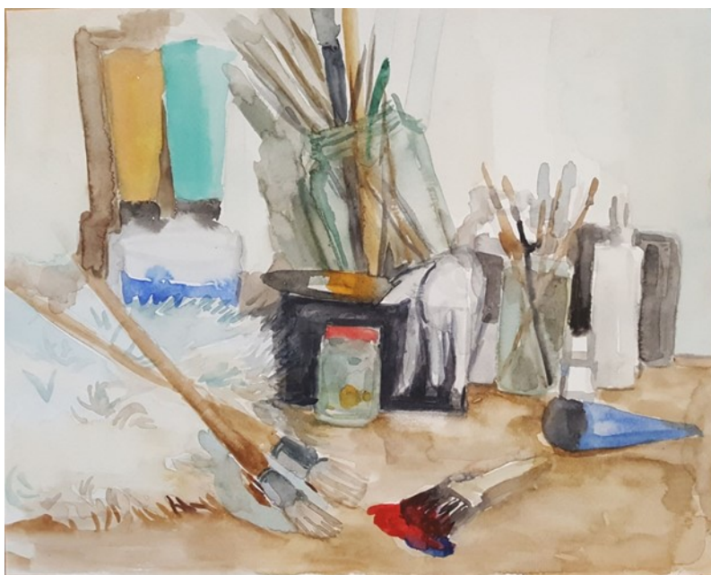
Kuva 5. Luonnos

Asetelmassa tarkoitus olisi juuri poistaa kerronnallisuus, tapahtuma tai ihminen, jolloin teos itsessään ei kertoisi paljoa mitään. Tarkoituksena oli kuitenkin lähestyä asetelmaa hyvin arkisesta näkökulmasta, joten mielestäni töissäni voisi näkyä myös jonkinlaista kerronnallisuutta tai että ne voisi kertoa jotain tai niistä voisi tehdä jotain päätelmiä. Tarkoitus ei ollut poistaa kaikkea kerronnallisuutta tai tehdä teoksista täysin anonyymeja asetelmia. Teoksissa keskityn myös itse maalaamisen tekniikkaan ja siihen, miten materiaalit vaikuttivat työskentelyyni.