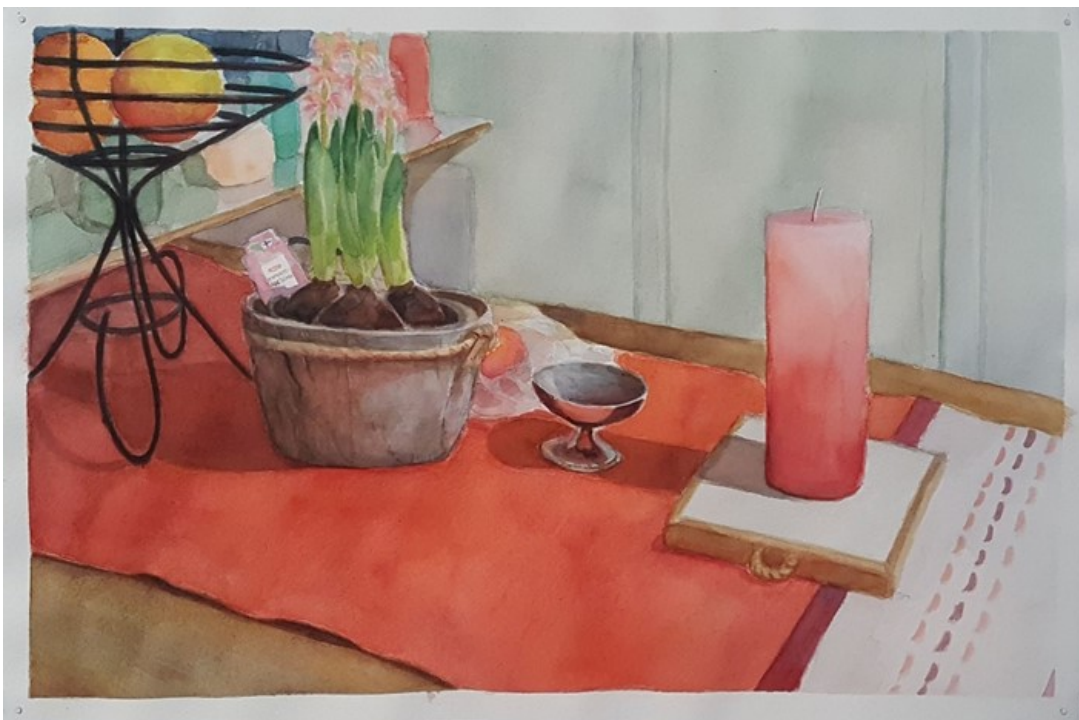
Kuva 11. Keittiöpöytä

kuin työtä, jonka pitäisi vain valmistua. Tämän ja sen takia, että teoksen tekeminen alkoi hetken ajatuksesta, jätin työn sikseen ja siirryin seuraavaan työhön.