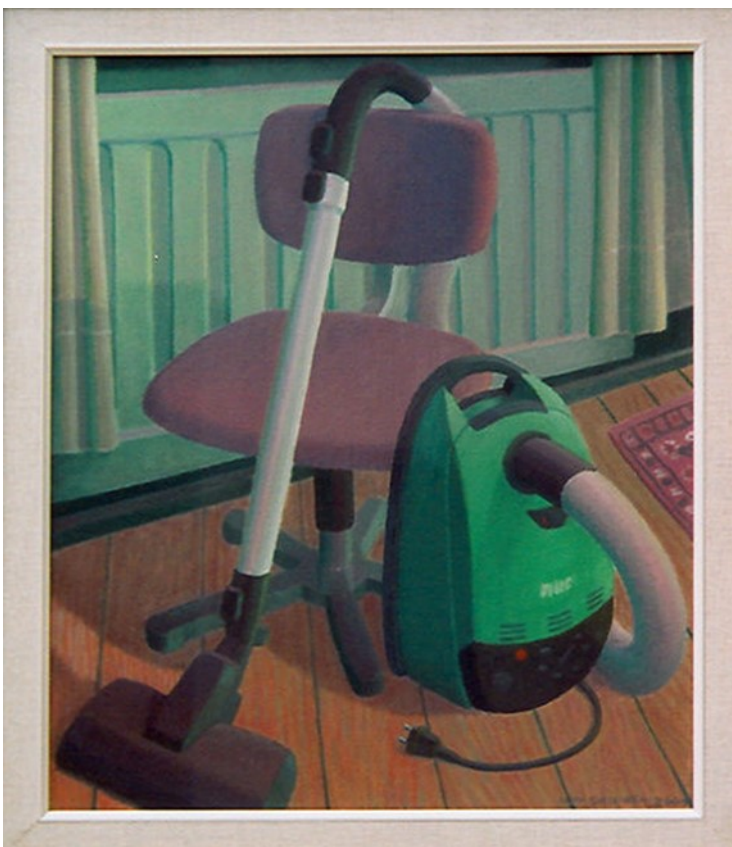
Kuva 2. Katy Gyllström, Pölynimuri, 2007, öljy, 46 x 38 cm (Kuvataiteilijamatrikkeli)