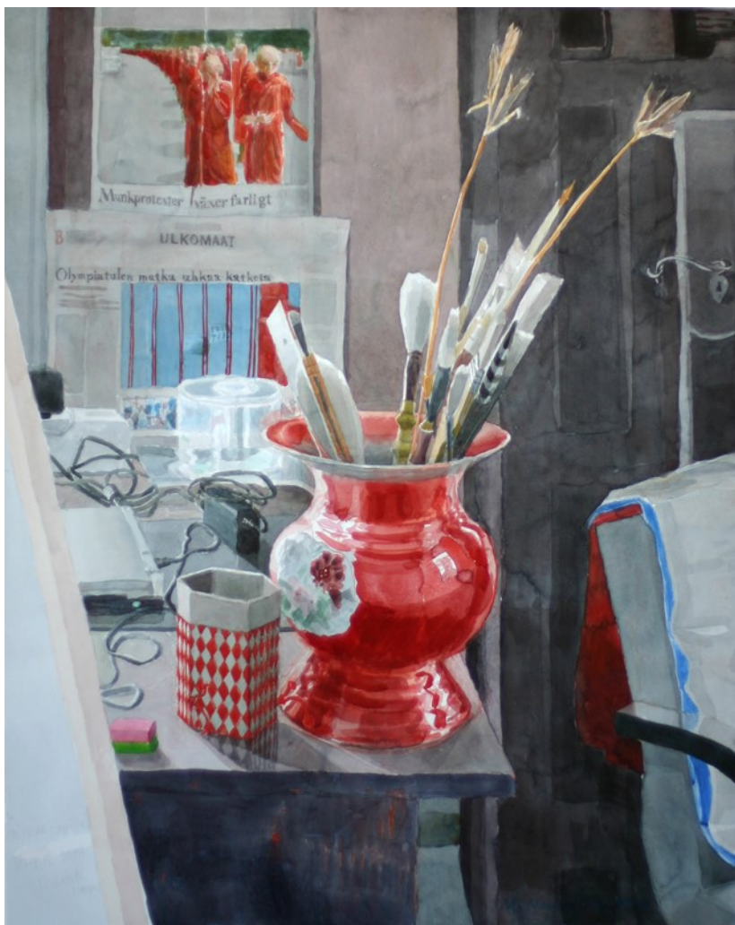
Kuva 4. Marjatta Hanhijoki, Kiinalainen potta, 2008, akvarelli (Marjatta Hanhijoki kotisivut)