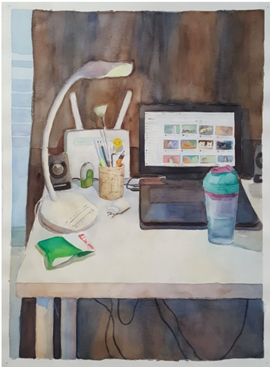
Kuva 14. Tietokonepöytä

epätasainen, tämän takia koitin lisätä vettä aina alueisiin, joita maalasin ja jotka odottivat maalaamista. Tämän takia vesivärimaalaus jäljestä tuli hieman epätasainen, sillä alueet kuivuivat myös eri aikoina ja väri käyttäytyi hyvin eri lailla kuivalla, kostealla ja märällä pinnalla.