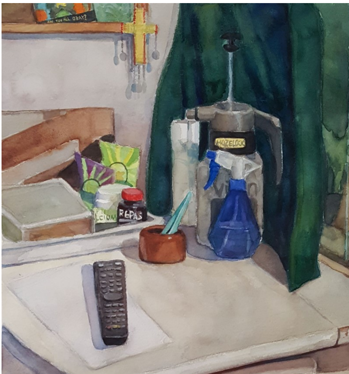
Kuva 8. Yksityiskohtia ensimmäisestä teoksesta.

tänyt kovin hyvältä. Koitin pestä väriä kyseisestä kohdasta pois, mutta paperi oli imenyt väriä sen verran että se ei oikein toiminut. Päätin sitten vain lisänä enemmän sinisen sävyä varjossa olevaan kaapin sivuun, jotta varjosta tulisi hieman intensiivisemmän näköinen. Keskityin myös muutamiin yksityiskohtiin, jotka veivät kyseisessä näkymässä huomioni (kuva 8). Kuten punakorkkinen musta purkki, jossa oli gekon ruokaa, joka toimi eräänlaisena keskipisteenä. Toinen pieni yksityiskohta mitä työstin, oli vasemmassa yläkulmassa oleva ilmoitustaulu ja siinä oleva lapsuudesta tuttu todella vanha Pokémon-kortti, jonka alakulmassa oli tekstiä.