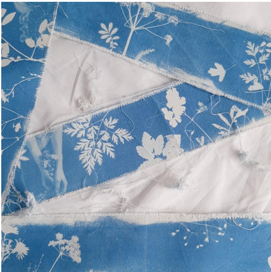
Kuva 16. Vihkojen purkautuneita reunoja

Ompelin valmiisiin tekstiilivihkoihin nauhat, joiden avulla vihkot on mahdollista kääriä pieniksi rulliksi, jolloin niitä pystyisi kantamaan vaikkapa takin taskun pohjalla muiden huomamatta (kuva 17). Ajatuksena oli se, että vihkon kantaja itse olisi tietoinen taskussaan lepäävästä rullasta samaan tapaan kuin yksinäiset ihmisetkin kulkevat paikasta toiseen tietoisina siitä yksinäisyyden aurasta, joka heidän mukanaan kulkee, vaikka muut eivät sitä näkisikään. Vihko pysyy piilossa taskun pohjalla, kunnes sen kantaja saapuu kotiin: kotona sekä vihko että sen edustama yksinäisyys on turvallista nostaa esiin, rullata auki ja asettaa tarkastelun kohteeksi ilman pelkoa siitä, että yksinäisyys ja siihen liittyvä häpeä tulisivat ilmi ulkopuolisille katseille. Rullalla ollessaan vihkot ovat varsin pieniä, mutta täyteen mittaan avattuna ne vievät huomattavasti enemmän tilaa. Samalla tavalla yksinäisyyskin on jotain sellaista, joka voi aineettomasta olomuodostaan huolimatta paisua suuren suuriin mittasuhteisiin ja vallata yhä enemmän tilaa ihmisen elämästä.