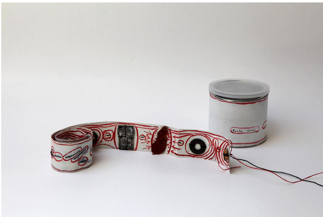
Kuva 11. Beata Wehr: Error , 2014, sekatekniikka (Artist's book gallery)