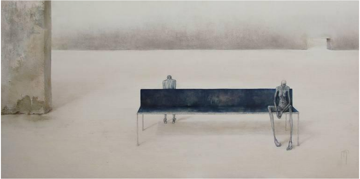
Kuva 5. Marleen Pauwels: Close Enough, 2012, sekatekniikka (Saatchi Art)