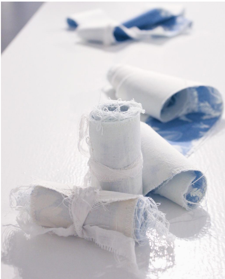
Kuva 19. Tekstiilivihkot näyttelyssä, lähikuva