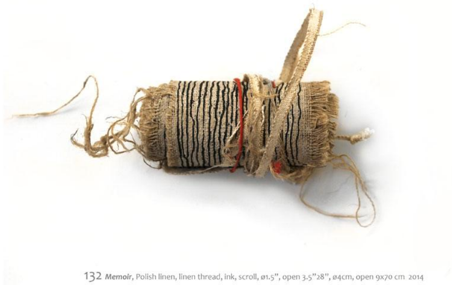
132 Memoir , Polish linen, linen thread, ink, scroll, ø1.5", open 3.5"28", ø4cm, open 9x70 cm 2014