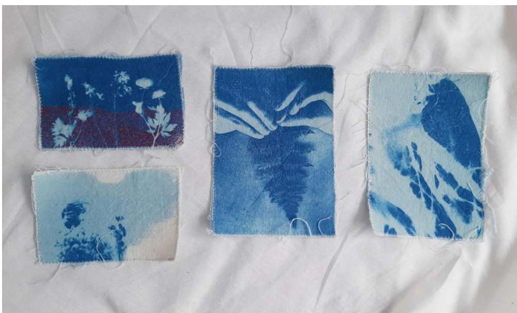
Kuva 7. Syanotypioita kesältä 2020