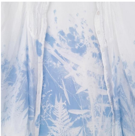
Kuva 20. Kasvillisuutta paidalla

Osaan paidoista valotin kasvillisuutta kuvaamaan yksinäisyyden elinkaarta, sen kasvua, kuihtumista ja juurtumista (kuva 20). Osa varten taas valotin ja ompelin kiinni valokuvia, joiden voi ajatella kiteyttävän joitakin yksittäisiä hetkiä yksinäisen ihmisen elämästä: hiljaisia hetkiä ikkunan äärellä, kaipausta muiden seuraan, tuntemuksia siitä että on unohdettu ja yksin (kuva 22). Yhteen paitaan ompelin tekstiä: listan asioista, jotka toimivat vertauskuvina yksinäisyydelle ja sen aiheuttamille tuntemuksille (kuva 21). Paitojen voisi ajatella olevan jonkinlaisia päiväkirjamerkintöjä, ajatuksia, havaintoja ja tuntemuksia yksinäisyyden sävyttämästä arjesta. Sen sijaan, että kaikki edellä mainitut ajatukset ja tunteet pysyisivät muilta salassa kuten tekstiilivihkoissa, ne tulevatkin ulkopuolisten nähtäville paitojen muodossa.