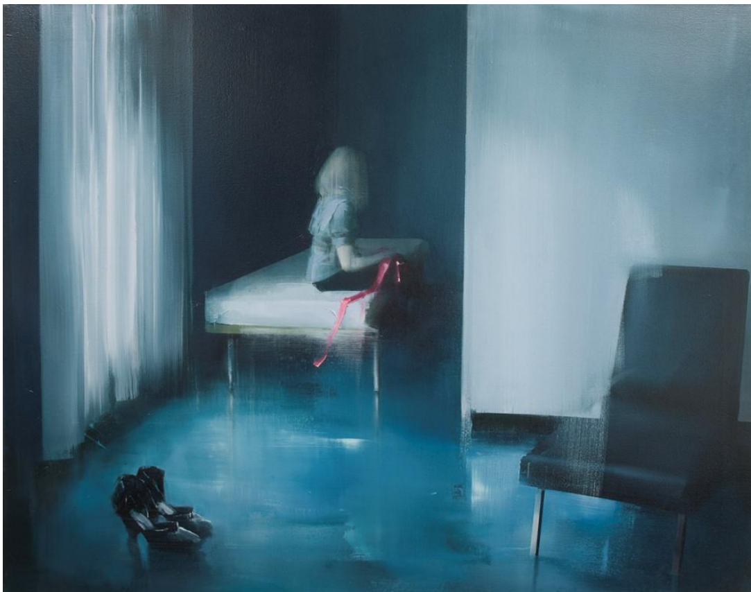
Kuva 2. Tiina Heiska: Vol. 4 sarjasta Grandmother's House part I, 2017 (Tiinaheiska.fi)