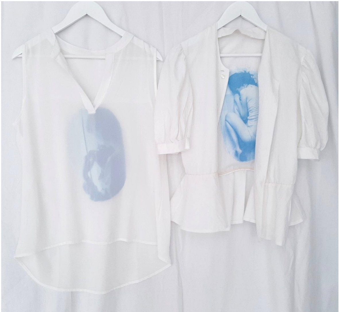
Kuva 22. Kuvia ommeltuna paitojen sisäpuolille

Valotusprosessi oli paitojen kohdalla pitkälti samanlainen kuin tekstiilivihkoissa: läpinäkyville kalvoille tulostetuista valokuvista piti ottaa testivalotuksia oikean valotusajan löytämiseksi, ja lopulliset sommitelmat rakentuivat niitä etukäteen juurikaan miettimättä. Olin kerännyt itselleni valikoiman erilaisia vaaleita paitoja, joihin kokeilin erilaisia vaihtoehtoja ja tapoja yhdistää syanotypiaa: osaan valotin kasvillisuutta, osaan valokuvia ja muutamaan paitaan ompelin kiinni erillisiä kangaspaloja, joihin olin tehnyt syanotypiaavalotuksia. Osassa paidoista syanotypiaa on helposti nähtävillä sekä hihoissa että paidanhelmassa, kun taas osassa syanotypia on ikään kuin piilossa paidan sisäpuolella (kuva 23). Syanotypiaavalotusten sijainnit paidoissa kuvaavat yksinäisyyden ja siitä koituvan häpeän näkyyttä: toisinaan yksinäisyys ja sen aiheuttamat tuntemukset ovat vain hädin tuskin nähtävillä, kun taas toisinaan ne piirtyvät esille niin selkeästi, ettei niitä voi olla huomaamatta. Valotin paidat grafiikan pajan UV-valolla samaan tapaan kuin vihkotkin: valotettavat kasvit tai kuvat asetettiin valotuslasille, jonka ylle paita niiden jälkeen laskettiin (kuva 24).