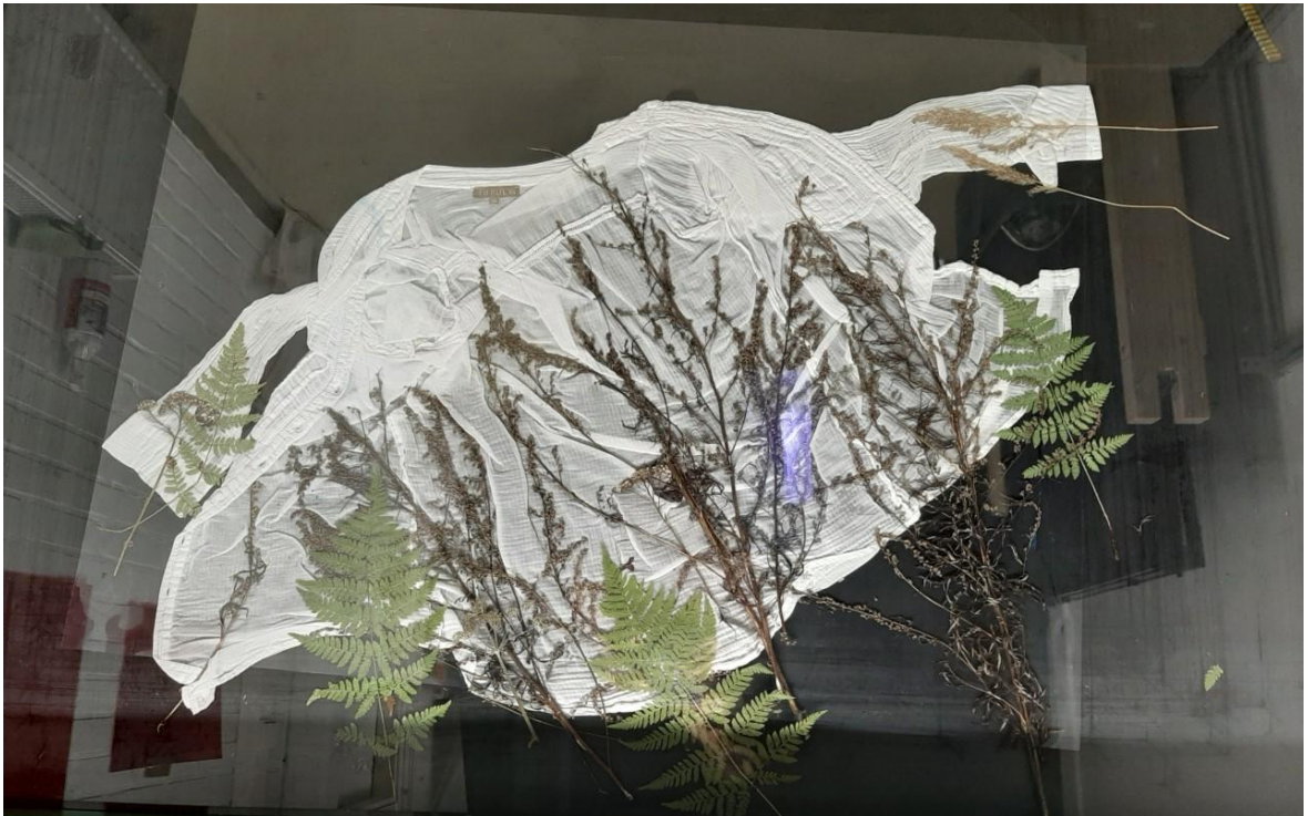
Kuva 24. Paita ja kasvit valmiina valotusta varten valotuslasin alla