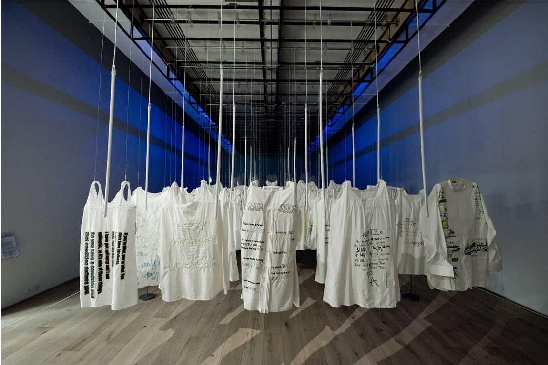
Kuva 8. Susan Aldworth: Out of the Blue, 2020, ompelu tekstiileille (Davison)