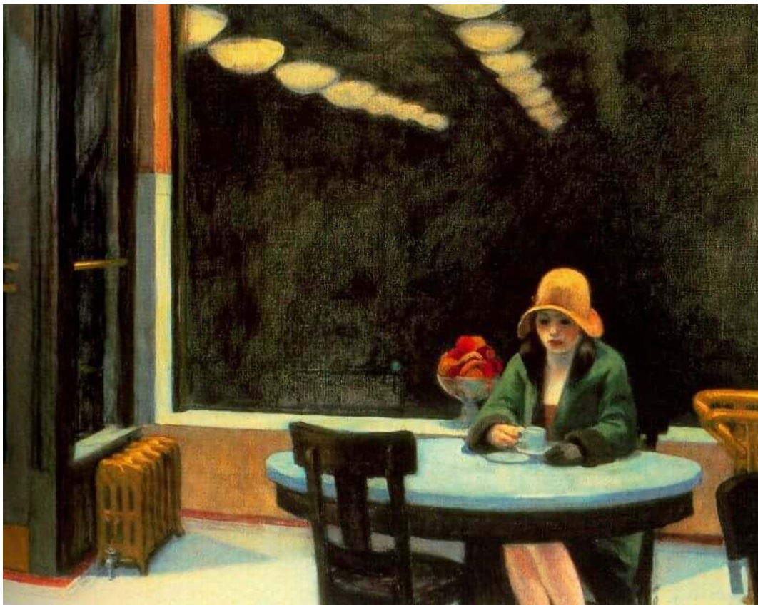
Kuva 3. Edward Hopper: Automat, 1927, öljyvärimaalaus

Toinen esimerkki on taiteilijaryhmä Vignettes + Gramma, jonka jäsenet asettivat esille lukuisia installaatioteoksia ympäri Seattlen kaupunkia vuonna 2018. Taiteilijat olivat luo- neet erilaisia ääni- ja installaatioteoksia, jotka asetettiin näytteille eri puolille kaupunkia tai joita pystyi kuuntelemaan missä tahansa esimerkiksi älypuhelimien kautta. Kaikki teokset käsittelivät yksinäisyyttä (Vignettes.)