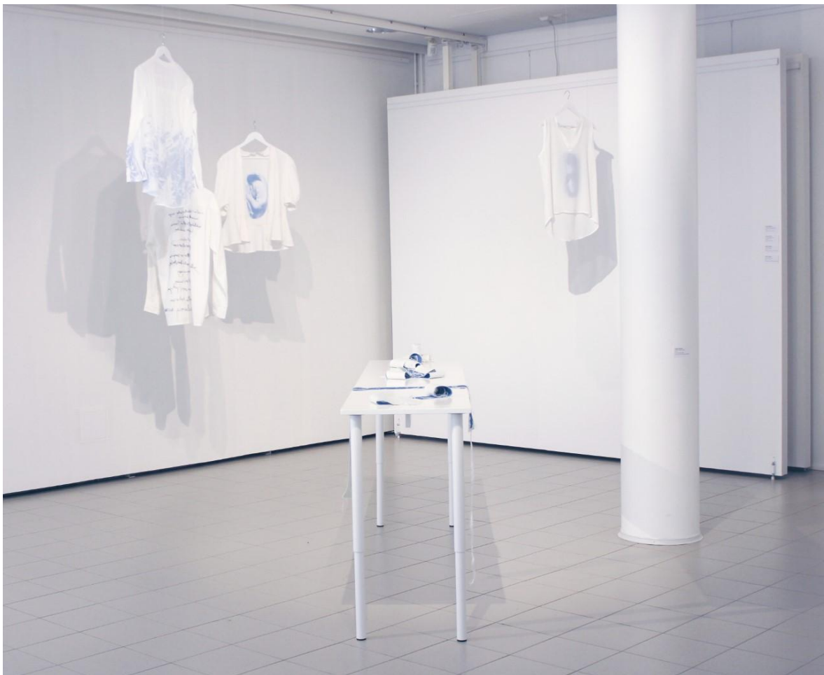
Kuva 25. Paidat ripustettuna vihkojen yhteyteen

Kuten tekstiilivihkojenkin esillepanossa, halusin myös paitojen näytteille asettelun kerto- van jotain yksinäisyydestä. Päädyin ripustamaan paidat tekstiilivihkojen läheisyyteen siten, että kolme paitaa muodostaa pienen ryhmän pöydän vasemmalle puolelle, kun taas yksi paidoista on itsekseen pöydän oikealla puolella: se on jätetty yksin muun ryhmän ulkopuolelle (kuva 25).