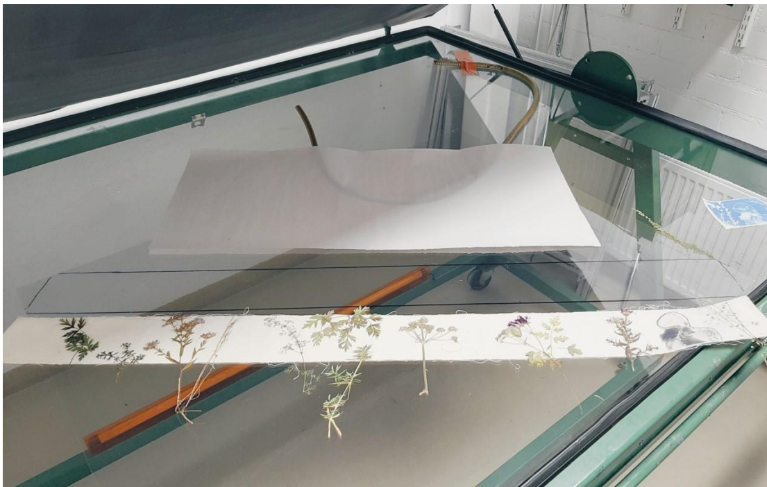
Kuva 14. Valokuvien ja kasvien sommittelua kankaalle ennen valotusta