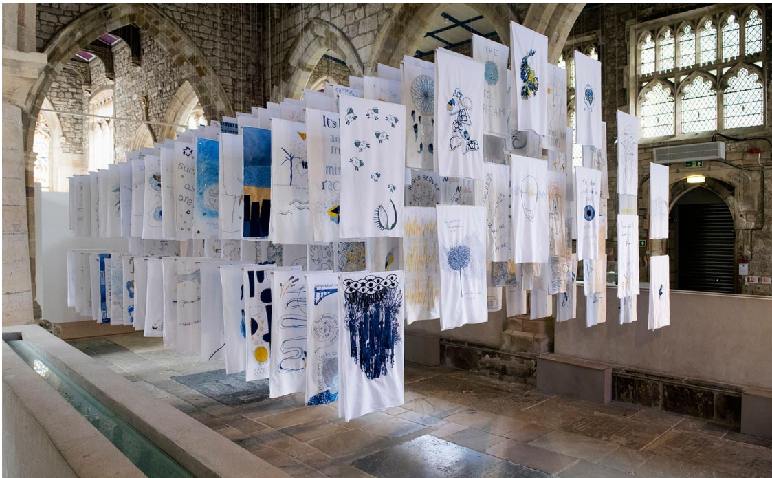
Kuva 9. Susan Aldworth: 1001 Nights, 2017, ompelu tekstiileille (Hughes)

Tekstiilivihkojeni esikuvana toimivat Beata Wehrin sekatekniikkavihkot, erityisesti Memoir (2014) ja Error (2014), jotka molemmat ovat kokoon rullattavia käärejä (kuva 10 ja 11).