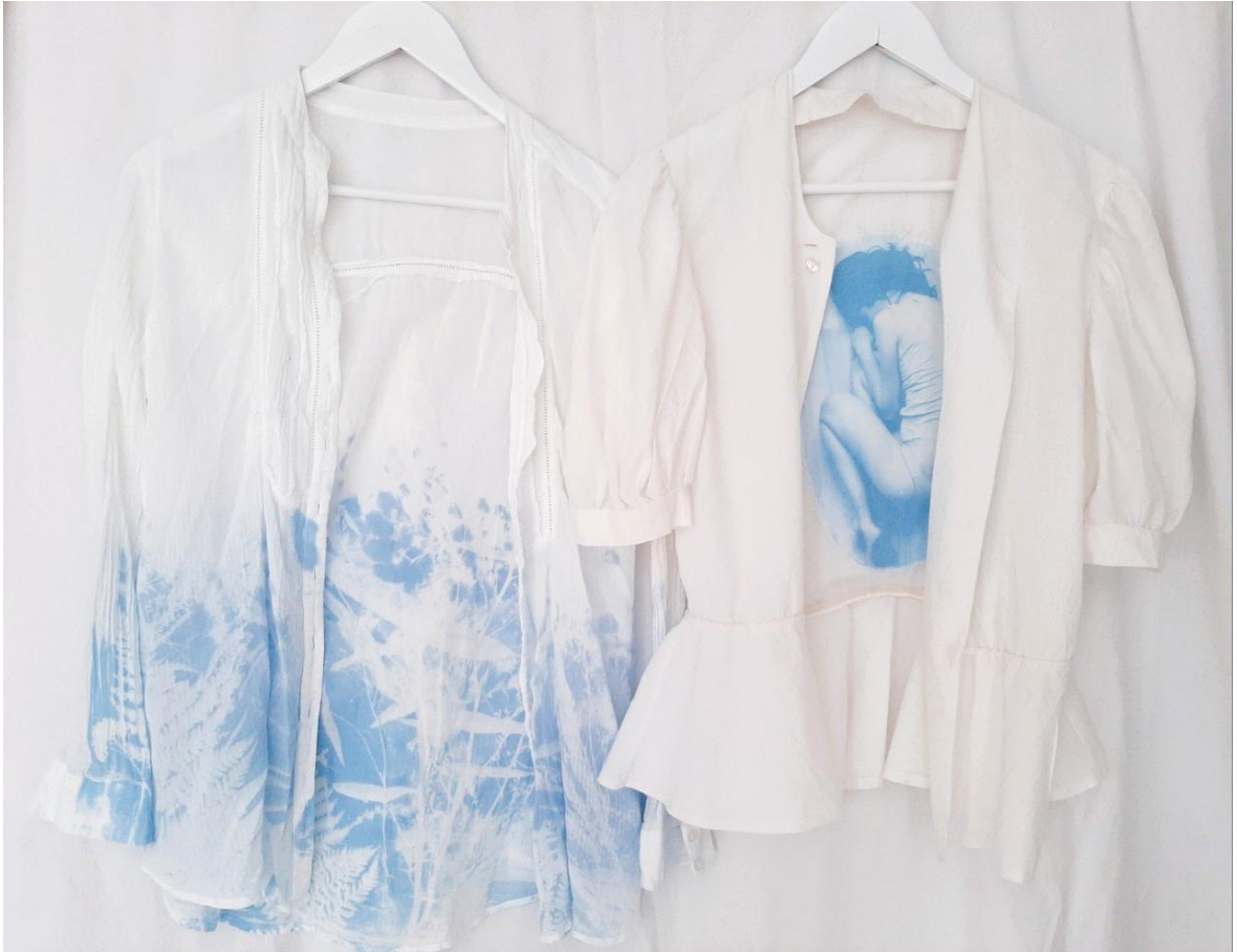
Kuva 23. Valmiita syanotypiapaitoja