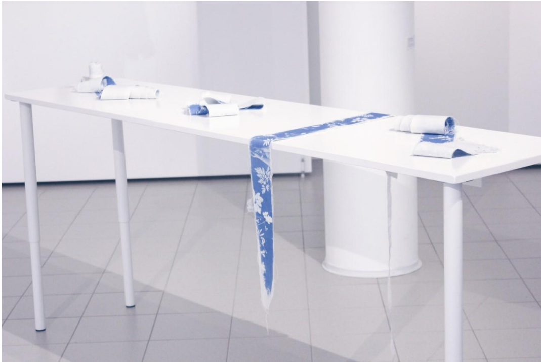
Kuva 18. Tekstiilivihkot pöydälle aseteltuina näyttelyssä