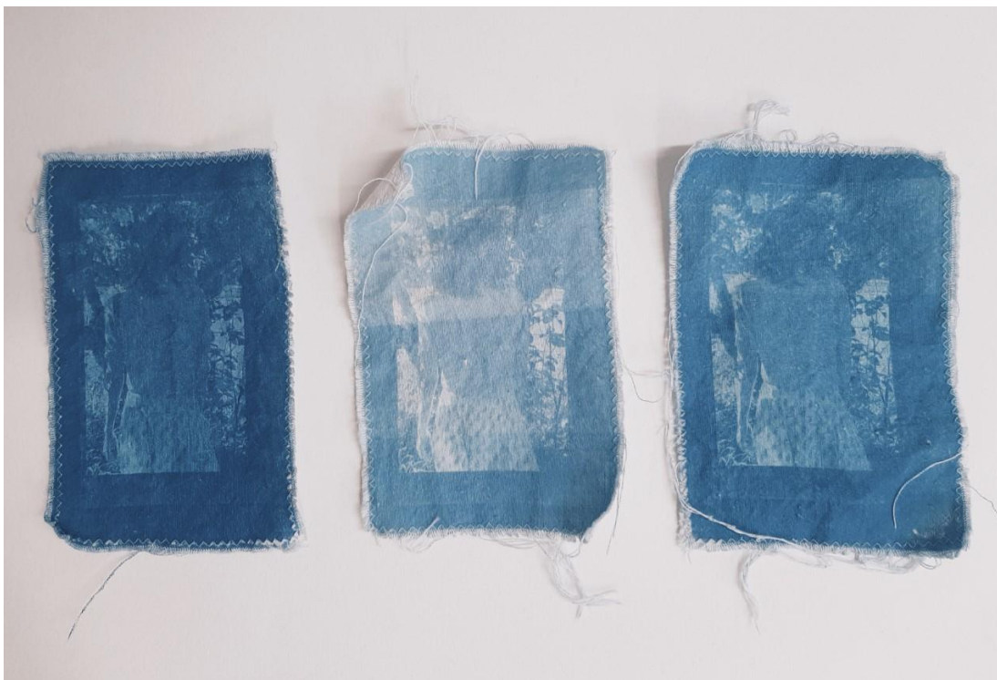
Kuva 12. Kokeiluja erilaisista valotusajoista

Syanotypiaa on mahdollista tehdä luonnonvalossa, mutta koska tein teoksiani talvella, jolloin auringonvaloa ei juurikaan ollut käytettävissä, päädyin tekemään syanotypiavalotukset grafiikan pajan UV-valolla. Työskentelyprosessi alkoi sopivien valokuvien valikoimisesta, niiden printtaamisesta läpinäkyville kalvoille tekstiilivihkoihin sopivassa koossa ja oikean valotusajan löytämisestä. Oli tärkeää löytää valotusaika, joka toistaisi valokuvien sävyt ja yksityiskohdat mahdollisimman hyvin (kuva 12 ja 13). Oikean valotusajan löydyttyä siirryin valottamaan valokuvia ja luonnonkasveja varsinaisiin tekstiilivihkoihini. Olin aiemmin syksyllä poiminut laajan valikoiman luonnonkasveja, joita sommittelin tekstiilivihkoihin valokuvien kanssa.