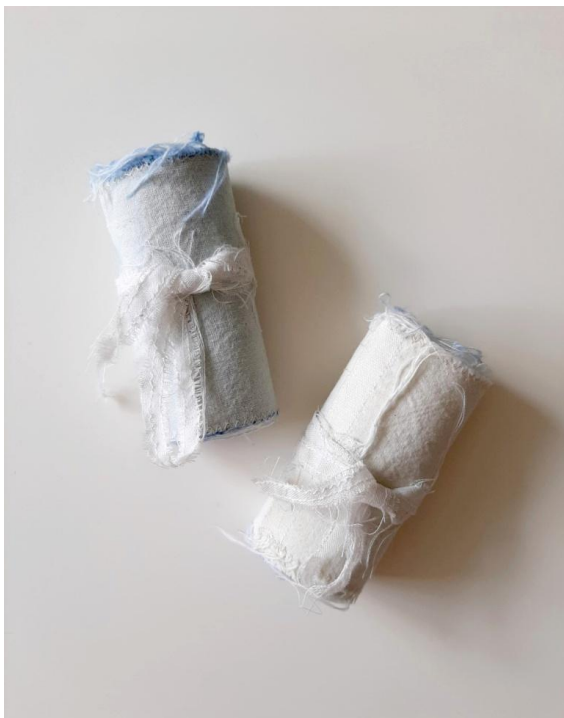
Kuva 17. Tekstiilivihkot rullalla

Opinnäytetyönäyttelyyn tekstiilivihkot asetettiin esille niitä varten rakennetulle pöydälle. Koska tekstiilivihkot ovat ilmiasultaan todella herkkiä ja hienovaraisia, piti niiden esillepanossa olla erityisen huolellinen: pöydän tuli olla sellainen, ettei se veisi huomiota itse vihkoilta vaan päinvastoin tukisi niiden hiljaista kieltä. Pöydän tuli siis olla mahdollisimman siro ja vähäeleinen, jotta vihkot pääsisivät oikeuksiinsa. Näin ollen parhain vaihtoehto oli suunnitella ja rakentaa pöytä itse, jotta sen voisi tehdä tekstiilivihkojen ehdoilla.