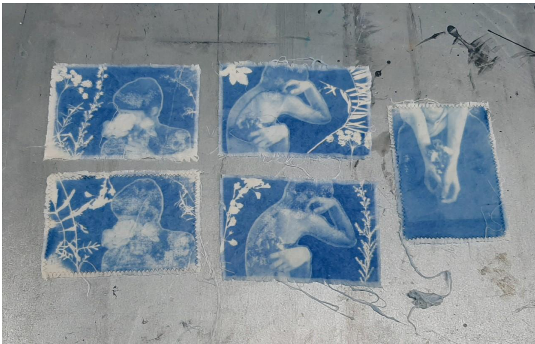
Kuva 13. Valotusaikojen testaamista valokuvien ja kasvien kanssa

Tekstiilivihkojen sommitelmat syntyivät itse valotushetkellä, juurikaan etukäteen suunnittelemana (kuva 14). Määritin ensimmäiseksi valokuvan sijainnin vihkossa, jonka jälkeen täytin lopun tilan kasvillisuudella. Kun olin sommitelmaan tyytyväinen, valokuvasin sen, poistin valokuvat sekä kasvit kankaan päältä, levitin kankaalle syanotypiaväriä ja rakensin purkamani sommitelman uudelleen aiemmin ottamani valokuvan perusteella. Valotusta ajatellen sommitelmat tuli koota peilikuvana, ja sekä valokuvat että luonnonkasvit tuli asettaa suoraan valotuslasille, jonka päälle tekstiilivihko laskettiin viimeisenä (kuva 15). Käytin apuna kohdistuskalvoa. Valotuksen jälkeen tekstiilit tuli pestä syanotypiaan tarkoitetulla pesuaineella, joka keskeytti valotusprosessin ja kiinnitti valotetut kuvat kankaaseen lopullisesti.