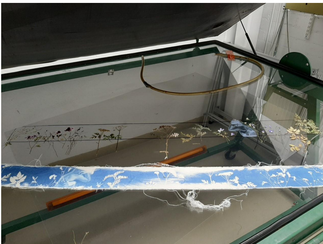
Kuva 15. Juuri valotettu vihko ja sommitelma peilikuvana kohdistuskalvolla