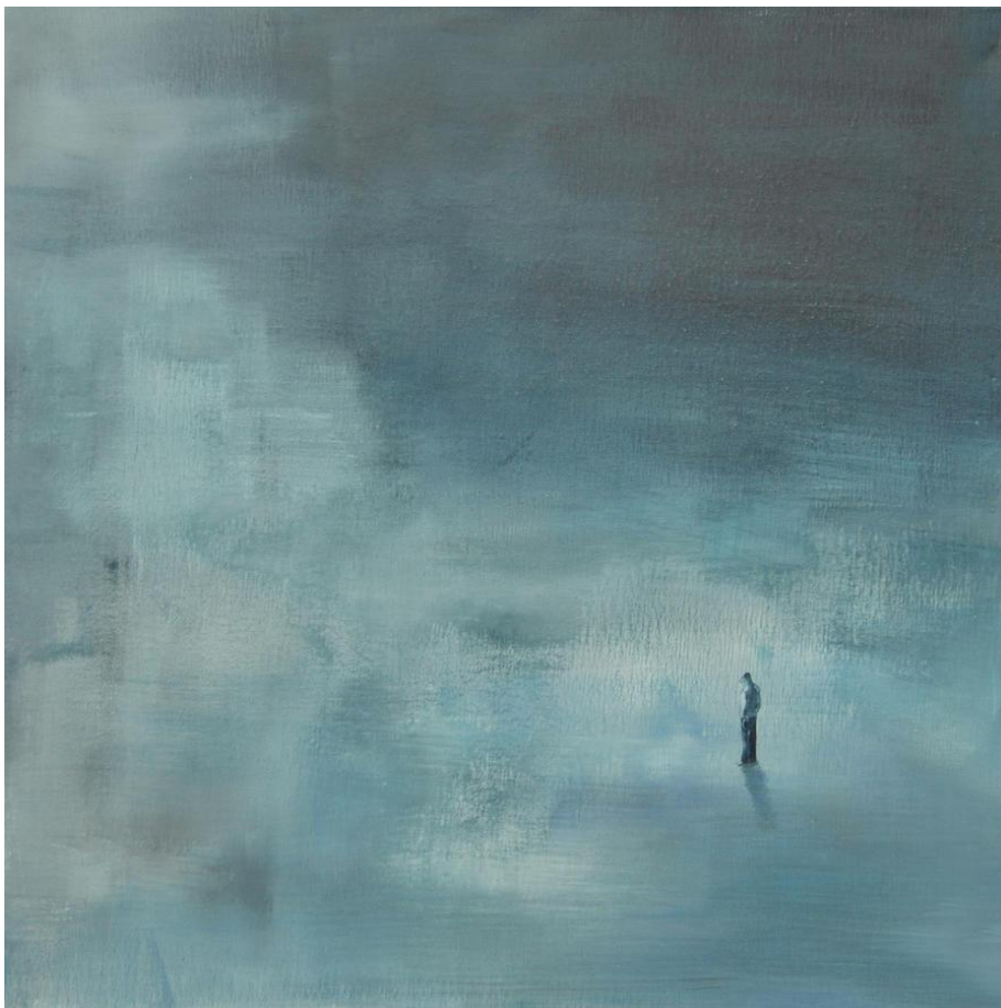
Kuva 1. Chrys Roboras: Desolate, 2008, akryylimaalaus

Samoja piirteitä on löydettävissä myös Tiina Heiskan maalauksesta Vol. 4 sarjasta Grandmother's House part I (2017). Sarjan teokset kertovat pikkukaupungin entisestä kauneuskuningattaresta, joka ei voi sietää vanhenemistaan, vaan sulkeutuu taloonsa ja yrittää estää ajan kulumisen eristämällä itsensä muusta maailmasta (Valjakka, 2019).