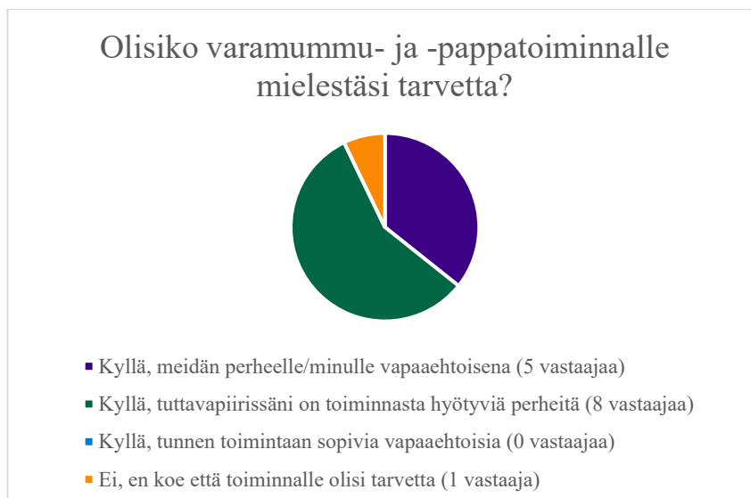
Kuvio 1 Olisiko varamummu- ja -pappatoiminnalle tarvetta?