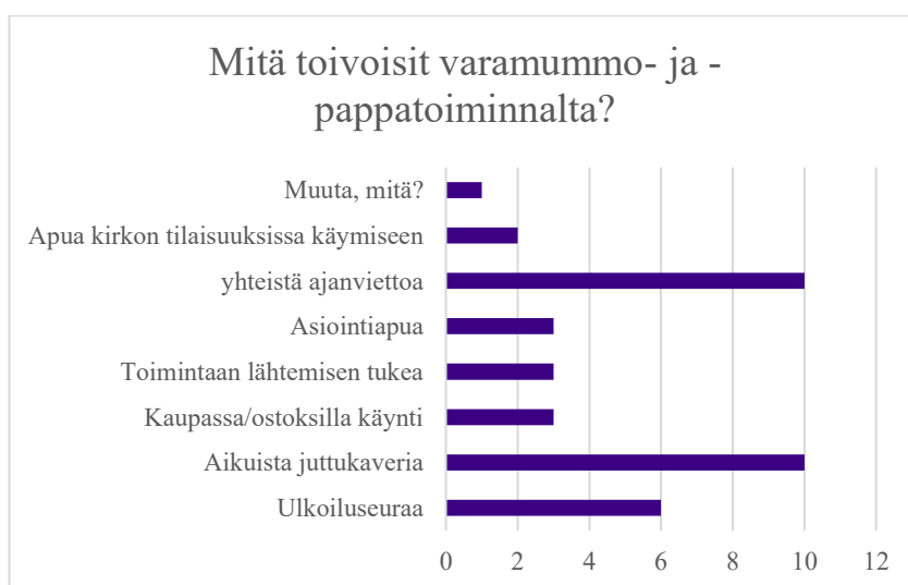
Kuvio 2 Mitä toivoisit varamummu- ja -pappatoiminnalta?

Kun kysyttiin, mitä toiminnalta toivottaisi, olivat selkeästi tärkeimmät toiveet aikuinen juttukaveri sekä yhteistä ajanvietettä, kuten lukeminen, laulaminen, pelailu sekä kyläily. Lisäksi toivottiin ulkoiluseuraa. Muita toiveita, joita olivat kaupassa tai ostoksilla käynti, toimintaan, esim. perhekerhoon lähtemiseen apuna oleminen, asiointiapuna olona ja apua kirkon tilaisuuksissa käymiseen, olivat nostaneet yksittäiset vastaajat (Kuvio 2).