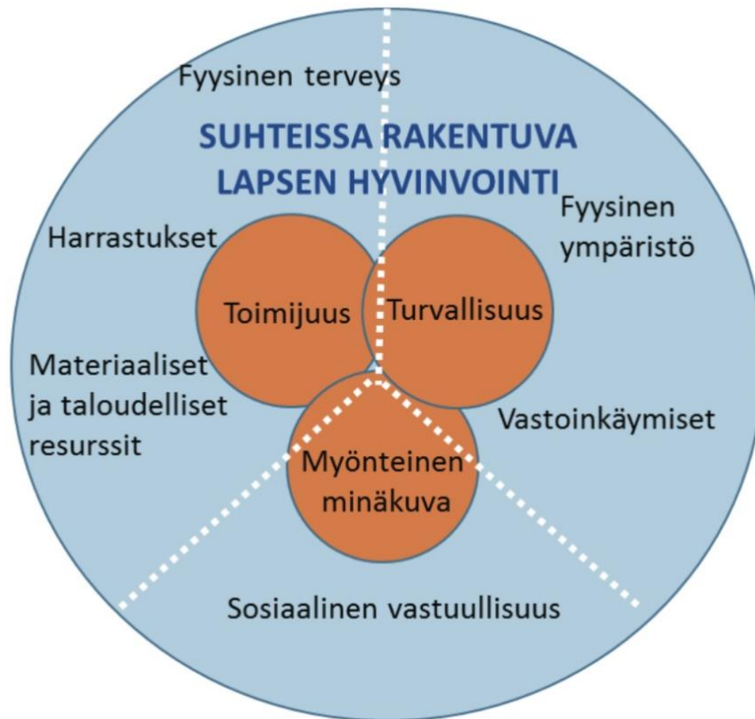
Kuvio 2: Suhteissa rakentuva lapsen hyvinvointi (Timonen-Kallio, Yliruka & Närhi 2017).

Omaohjaajat käyvät lapsen kanssa lapsen elämäntarinaa läpi ja keräävät myös konkreettisesti lapsen historiaa koostamalla esimerkiksi valokuva-albumeita. Lapsen tulevaisuudesta, haaveista sekä tavoitteista käydään säännöllistä keskustelua, jonka avulla pyritään vahvistamaan lapsen toimijuutta.