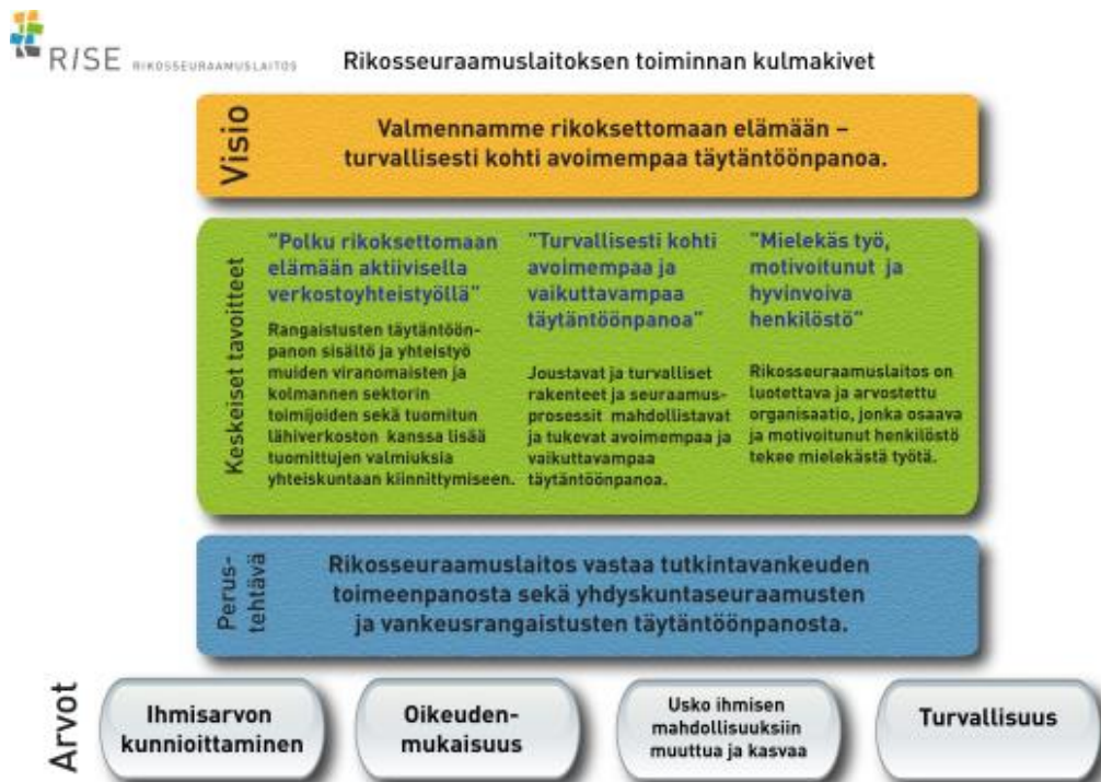
Kuvio 1: Rikosseuraamuslaitoksen toiminnan kulmakivet (Rikosseuraamuslaitos 2020b)

Rikosseuraamuslaitos on oikeusministeriön alaisuudessa toimiva viranomaisena, jonka toiminnan lähtökohtana on laki sekä asetus Rikosseuraamuslaitoksesta. Rikosseuraamuslaitoksen tehtävä on vastata vankeusrangaistusten ja yhdyskuntaseuraamusten täytäntöönpanosta sekä ylläpitää laillista ja turvallista täytäntöönpanojärjestelmää. Lisäksi sen tehtävänä on edistää niin uusintarikollisuuden vähenemistä, kuin sellaisten syrjäytymistekijöidenkin katkaisemista, jotka ylläpitävät rikollisuutta. Rikosseuraamuslaitos sitoutuu yleisesti tärkeinä pidettäviin arvoihin. Arvoihin sitoutuminen tarkoittaa tuomittujen kohtelemista asianmukaisesti ja tasavertaisesta sekä toiminnan lainmukaisuutta turvaten perus- ja ihmisoikeuksien toteutuminen. Lisäksi täytäntöönpano tulee toteuttaa yksilön kasvua ja kehitystä tukien kohti rikoksetonta elämäntapaa. Organisaation toimintaa ohjaa usko ihmisen kyvystä muuttua ja kasvaa. (Rikosseuraamuslaitos 2020a; Rikosseuraamuslaitos 2020b.)