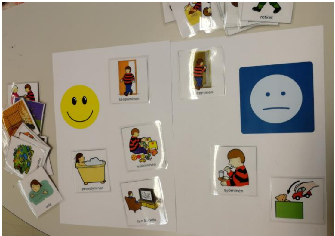
Kuva 1. Kuva pelatusta Oma-pelistä

Olemme luoneet Kehitysvammaliiton ylläpitämän Papunetin verkkosivujen kautta tulostettavan pelin, joka on ilmainen ja vapaasti käytettävissä epäkaupalliseen käyttöön (Papunet. Materiaalia. Kuvatyökalu). Peli sisältää pelilaudat ja kuvakortit, joihin on erilliset linkit. Linkkien kautta pelejä pystyy tulostamaan tarvittavia määriä.