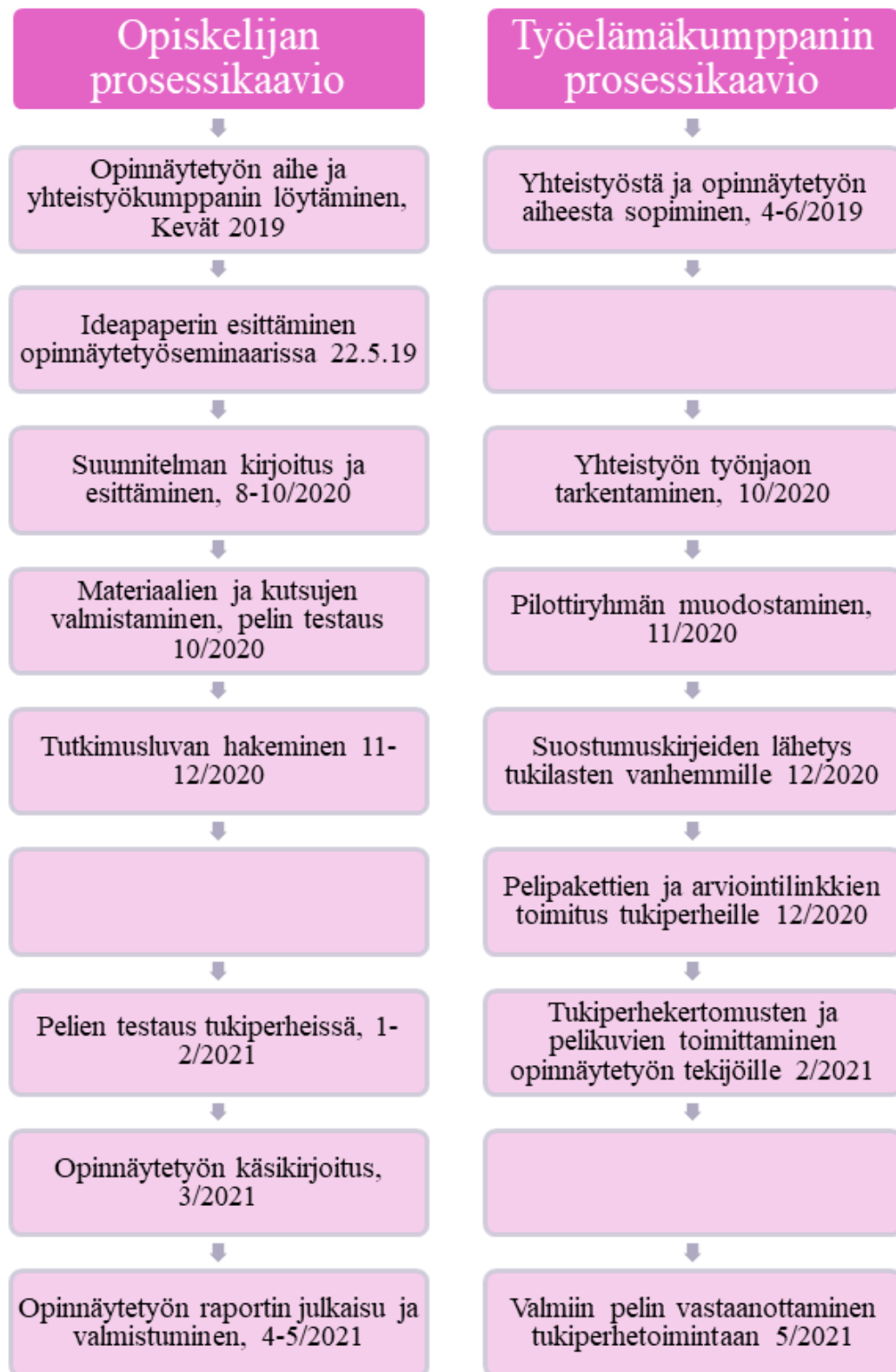
KUVIO 3. Työelämäkumppanin yhteistyöprosessin kuvaus