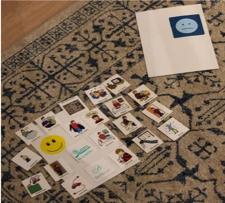
Kuva 6. Lapsen pelaama Oma-peli