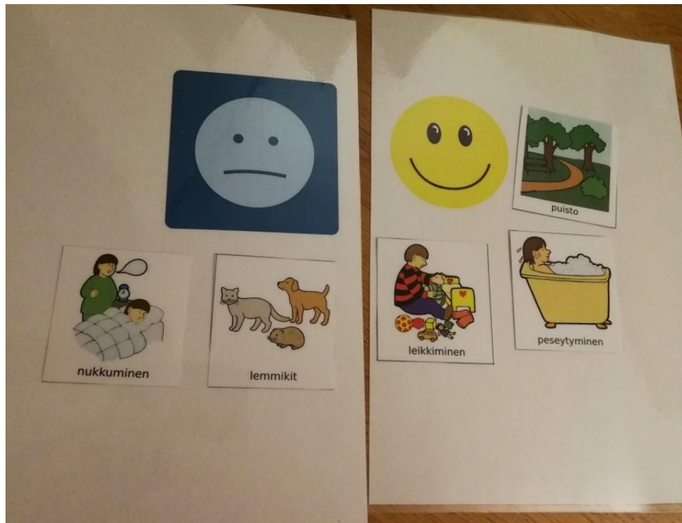
Kuva 2. Lapsen pelaama Oma-peli

Tukiperhevanhempi kirjasi lapsen kerronnan seuraavasti: