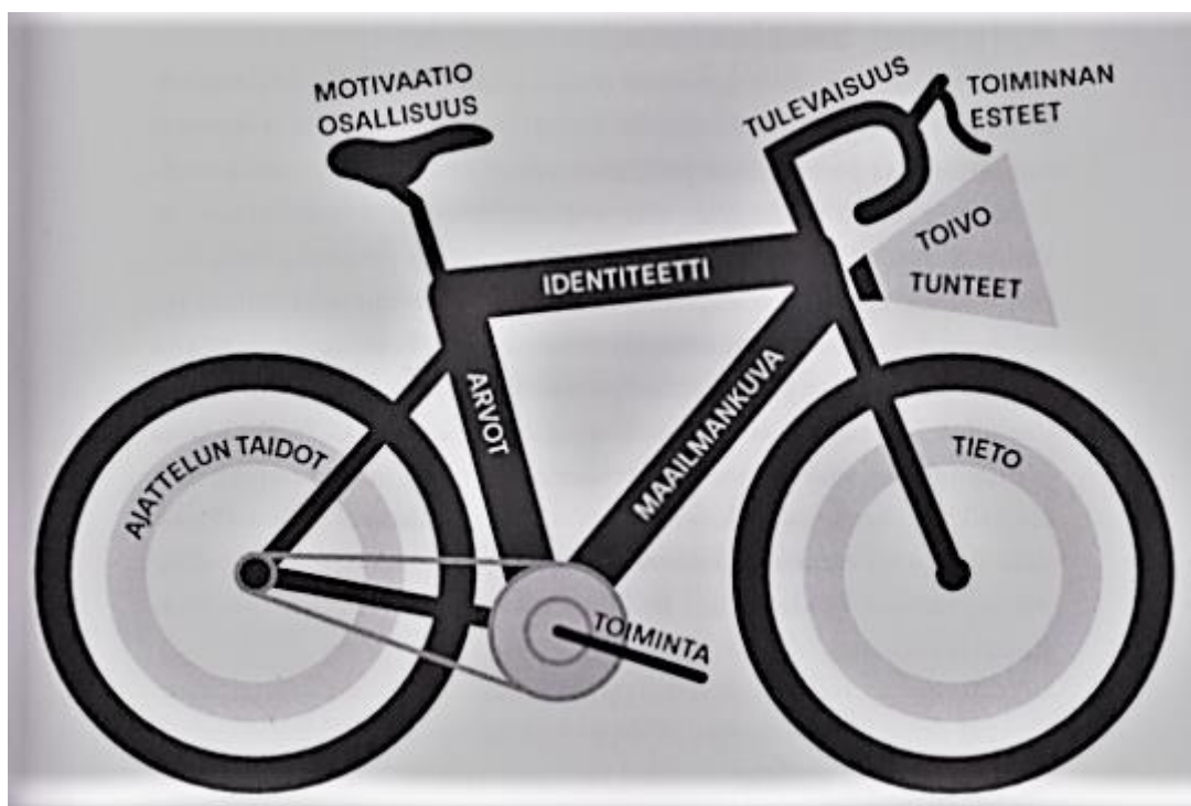
Kuva 3. Kokonaisvaltaisen ilmastokasvatuksen polkupyörämalli (Tolppasen ym. (2017) mukaan Cantell ym. 2020, 123)

Polkupyörämallissa pyörät kuvaavat tietoa sekä ajattelun taitoja. Nämä mahdollistavat pyörän liikkeen. Pyörän rungossa yhdistyvät ihmisen identiteetti, arvot sekä maailmankuva, jotka toimivat ilmasto- ja ympäristökasvatuksen perustana. Pyörän ketjut ja polkimet kuvaavat toimintaa eli tekoja ilmastonmuutoksen hillitsemiseksi. Pyörän käyttäjä istuu satulan päällä, joka sisältää motivaation ja osallisuuden. Pyörän jarrut kuvaavat toiminnan esteitä, joita voivat olla niin sosiaaliset kuin yhteiskunnalliset ja rakenteelliset syyt. Pyörän lamppu pitää sisällään toivon sekä muut tunteet, jotka ohjaavat ihmisten asenteita sekä toimintaa. Ohjaustanko suuntaa tulevaisuuteen, joka voi olla erilainen eri suunnissa. Jokainen näistä pyörän osista on merkityksellinen kokonaisuuden kannalta, ja pyöräilijä on mallissa aktiivinen tekijä. (Cantell ym. 2020, 122–126.)