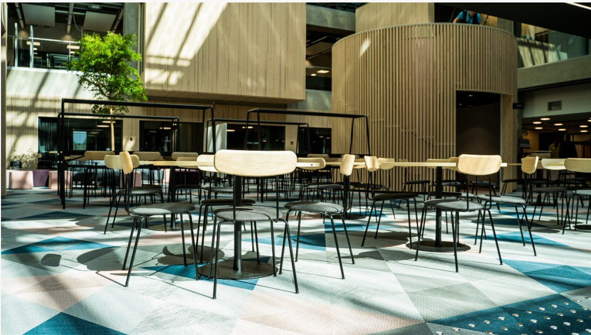
Työkahvila Aurinkokylpy EduCityn toisessa kerroksessa.

Kirjaston uusi toimipiste, EduCity-kirjasto, avattiin syyskuussa Kupittaaan kampuksen EduCity-rakennuksen valmistuttua. Kirjasto sijaitsee 2. kerroksessa Aurinkokylpy-lukusalin yhteydessä. Painetut kirjat ja lainauspalvelut ovat kivenheiton päässä Lempparin toimipisteessä.