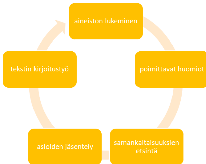
Kuvio 3. Analysointikuvio.

Kvalitatiivisen tutkimuksen aineiston tulkinnassa tutkijan tavoite on haastatteluaineistojen avulla saada onnistunutta tulkintaa. Samaa tekstiä voi tulkita eri tavalla ja eri näkökulmista. Onnistunut tulkinta tuo tutkimuksen lukijalle selväksi asioita, joista käsin tutkija on aihetta käsitellyt. Kun lukija lukee tutkimusta, muodostaa hän käsityksen tutkijan tulkinnan kautta. Voidaan selittää, miksi juuri tähän tulkintaan on päädytty ja asiasta kirjoitetaan tarkka selitys. (Hirsjärvi & Hurme 2008, 151). Kuvioon 3 olen kuvannut analyysin vaiheita.