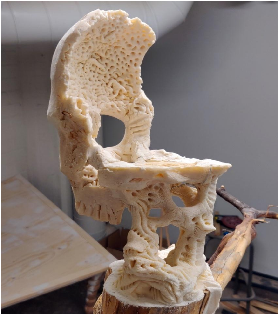
Kuva 8. Kallon sisäpintaa (Lilja 2020)