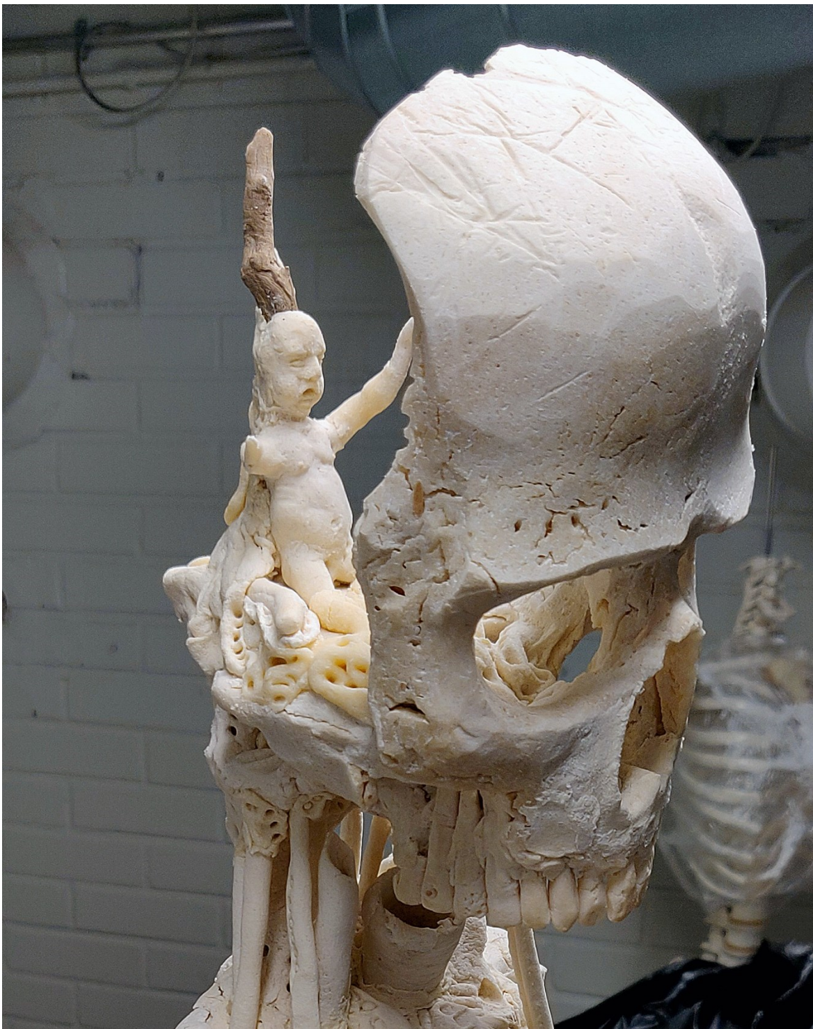
Kuva 15. Lapsihahmo aseteltuna paikalleen (Lilja 2021)

Minulla olisi ollut mahdollista jättää melko huomaamattomat aukot takaraivon puolelle, josta valo olisi päässyt pään sisään tuoden paremmin esiin sieltä löytyvät yksityiskohtat ja lapsihahmon. Päädyin kuitenkin peittämään takaraivon aukot, sillä valonkajo olisi saattanut heikentää merkittävästi pään sisältämien yksityiskohtien yllättävyyttä sekä tulkinnallista voimaa.