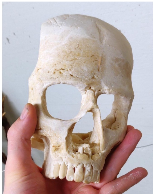
Kuva 6. Kallon runko alkuperäisessä muodossaan (Lilja 2020). Kuva 7. Kallon runko muokattuna teokselle sopivaan muotoon (Lilja 2020)

Olen pohtinut paljon teoksen muotokieltä ja sen yhteyttä aiheeseen. Yksityiskohtien runsaudella koitin saavuttaa tarkoituksenmukaisen kerronnallisuuden aiheen monimuotoisuuteen. Vaikka tulkinnallinen yhteys addiktioon on todennäköisesti vaikeaa tulla havaitsemaan teoksesta pelkän ulkomuodon perusteella en koe sitä mitenkään huonona asiana, johtuen samasta syystä minkä vuoksi esimerkiksi alkoholistin ulkoinen olemus ei ilmennä kokonaisvaltaisesti hänen ongelmiansa syitä ja laajuutta.