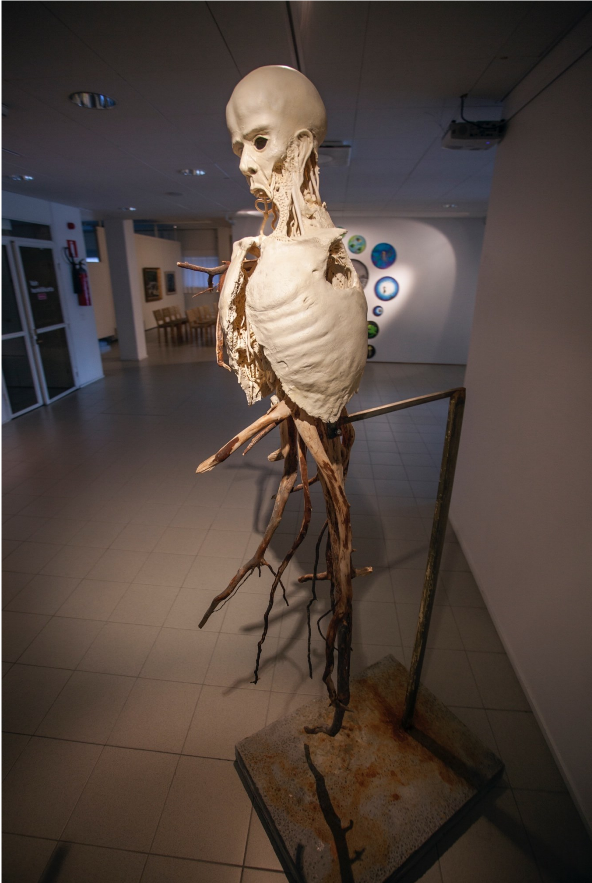
Kuva 11. Pintakerroksessa on verrattain vähän pikkutarkkoja yksityiskohtia (Lilja 2020)