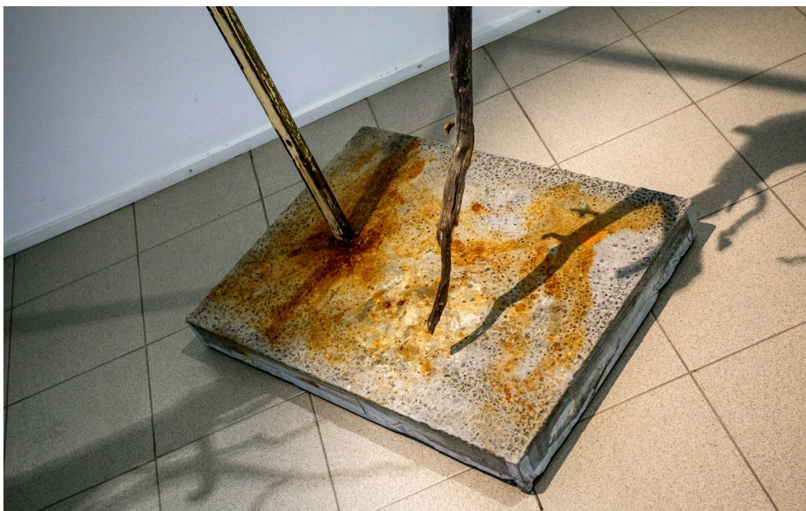
Kuva 5. Jalustan värimaailma onnistui odotettua paremmin (Lilja 2021)

Aluksi olin melko pettynyt lopputulokseen, jonka rautakloridilla olin saavuttanut, mutta ripustuspäivänä minua odotti todella mieluisa yllätys. Soodavesi yhdessä rautakloridin kanssa oli tehnyt metallin pintaan vaaleita alueita, jotka vastasivat sävyltään lähes täydellisesti taideteoksen väriä. Tämän täysin odottamattoman reaktion seurauksena jalusta sopi huomattavasti paremmin teoksen kanssa yhteen sopiva kuin olin osannut unelmoida (kuva 5).