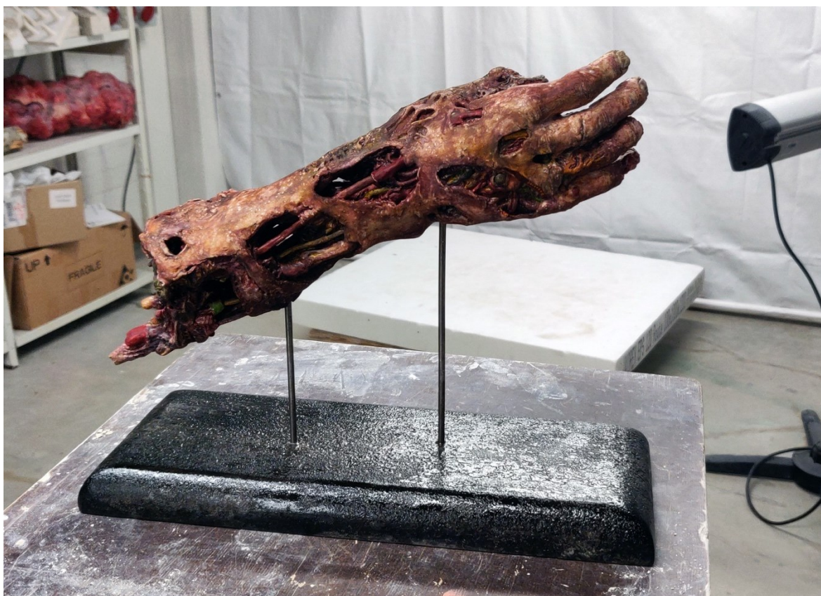
Kuva 4. Värjätty taikataikinakokeilu (Lilja 2020)

kokeilun värjäsin edellä mainitsemani menetelmällä, muotokieleltään opinnäytetyötä vastaavassa koeteoksessa koin tuon värittämisen aiheuttavan liian helpon miellelyhtymän kohti elokuvien rekvisiittaa (kuva 4).