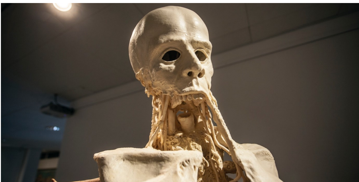
Kuva 14. Sanalliseen kommunikaatioon tarvittavat ruumiinosat puuttuvat (Lilja 2021)

Hahmolta puuttuva alaleuka, äänihuulet sekä kieli kuvastavat addiktien yleisesti kokemaa puutteellista kykyä saada äänensä kuuluviin (kuva 14). Addikitit ovat yksi yhteiskunnan ryhmä joka kaiken kokemansa pelon ja epätoivon keskellä nimenomaan tarvitsisivat saada keinon purkaa tuntemuksiaan ja kokemuksiaan, mutta mm. syrjintä, rangaistuksen pelko ja tuomitukseksi tuleminen tukahduttavat monilta uskalluksen ja mahdollisuuden tähän.