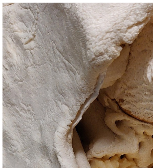
Kuva 2. Rintakehän yläosan kipsiharsorunko kiinnitettynä paikalleen taikataikinaa käyttäen. (Lilja 2021) Kuva 3. Tukirangan ja taikinan väliin muodostunut ilmarako, (Lilja 2020)

Kananmunan käyttö taikataikinatöiden viimeistelyssä on perinteinen tapa tasoittaa pintaan kristallisoituneen suolan aiheuttamaa karheutta ja lisätä pinnan kiiltoa lakkaamisen tapaan.