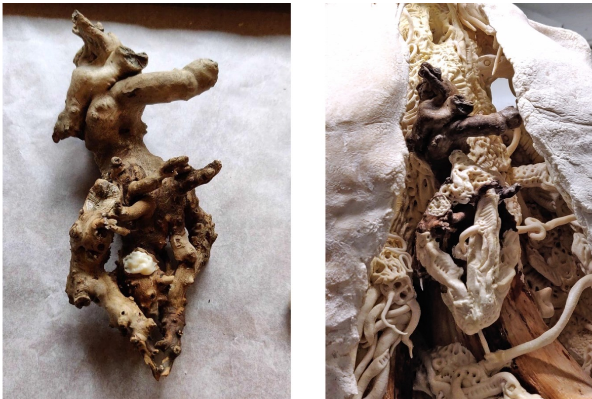
Kuva 9. Sydämen runkomateriaali (Lilja 2020). Kuva 10. Sydän kiinnitettynä veistokseen (Lilja 2021)

Tekemäni sydämen jätin avonaiseksi ja ikään kuin keskeneräiseksi (kuva 10), tahdoin tällä luoda sen symboliseen sisältöön kuvaelman addiktion latistamasta tunne-elämästä ja sen seurauksena puutteelliseksi muodostuneesta kyvystä pyynteettömään rakkauteen, jota addikti saattaa sisimmässään kaivata.