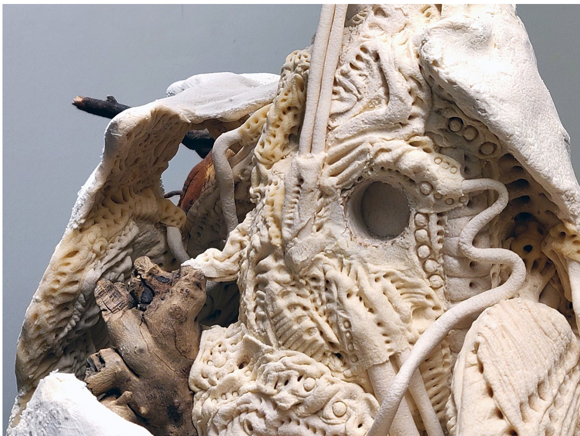
Kuva 12. Teoksen sisäosat on tehty täyteen yksityiskohtia (Lilja 2021)

Mielestäni on myös mielenkiintoista pohtia addikteihin kohdistuvan tarkastelun mielekkyyttä, sekä tämän mielekkyyden jakautumista erityyppisten ihmisten välillä. Oletettavaa on, että monet ihmiset kokevat tietynlaista inhoa ja väheksyviä asenteita addiktiosta kärsiviä ihmisiä kohtaan. Monilla puolestaan nämä ennakkoluulot jäävät taka-alalle ja he kykenevät normaaliin kanssakäymiseen ihmisten kanssa oli heidän taustansa ja elämäntilanteensa millainen tahansa. Tässä mielessä teoksen tarkastelukokemus on pyritty saamaan samankaltaisia piirteitä kuin addiktion riuduttaman ihmisen kohtaaminen. Osalle tämä teos saattaa muotojensa puolesta aiheuttaa inhonsekaisia tuntemuksia, kun taas osalle se esiintyy kiehtovana ja tarkemman tutkimisen arvoisena.