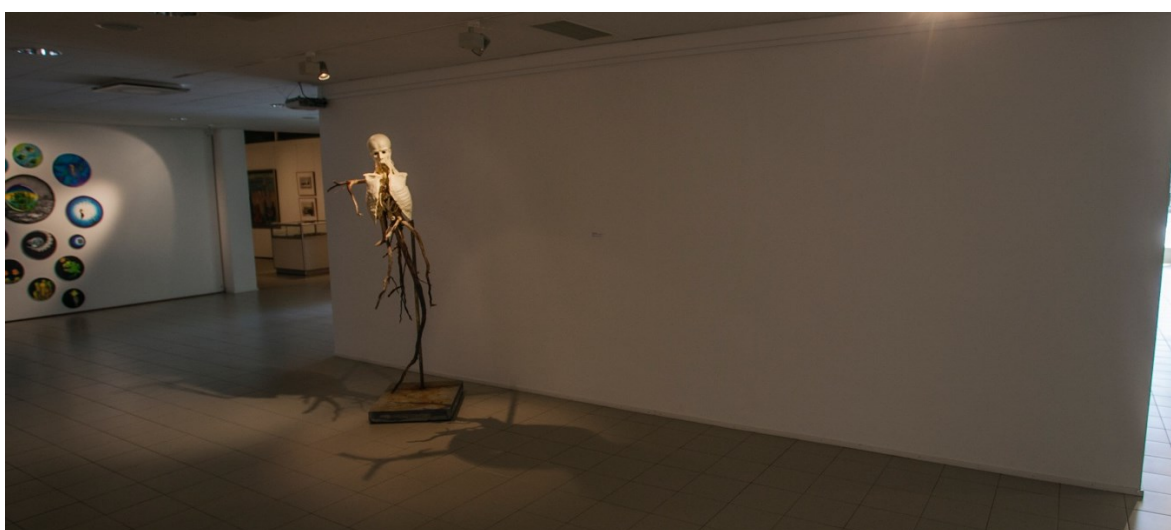
Kuva 17. Teos asetettuna näyttelytilaan (Lilja 2021)

Teoksen esillepanossa tärkeimmäksi kokemani seikat olivat valaistus ja riittävän avoin tila (kuva 17). Mielestäni teoksen sijoittelu onnistui loistavasti, sen välittömässä läheisyydessä ei ollut sellaisia töitä, jotka olisivat luoneet visuaalista häiriötä teokseni tarkastelulle.