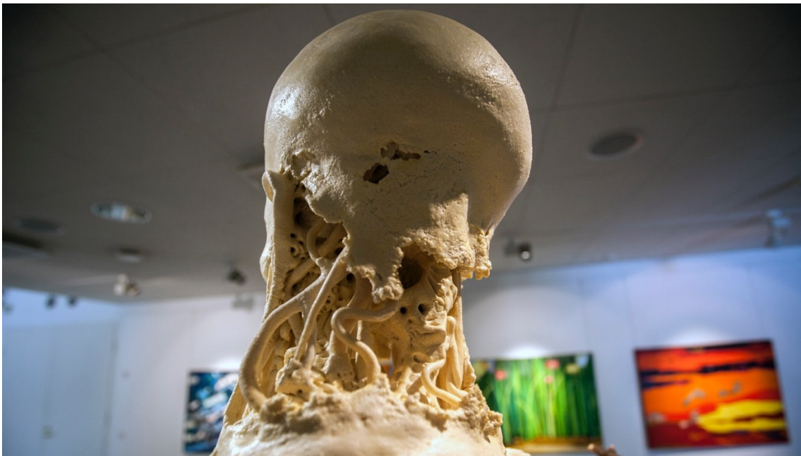
Kuva 13. Repeytyneeksi muovattua ihoa niskan alueella (Lilja 2021)

vanhemmat tuhoutuneet alueet ovat siis ehtineet sulautumaan osaksi sitä dysmorfista ole- musta, jonka addikti kokee omaksi minuudekseen.