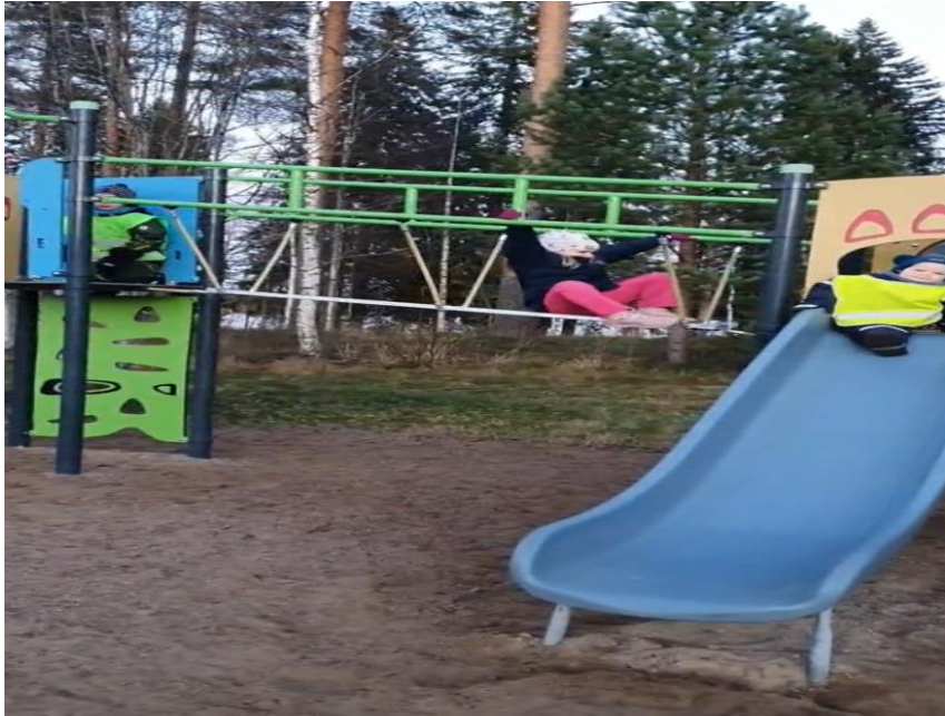
Kuva 4. Leikkipuisto.