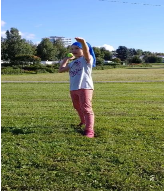
Kuva 1. Pallonheitto.