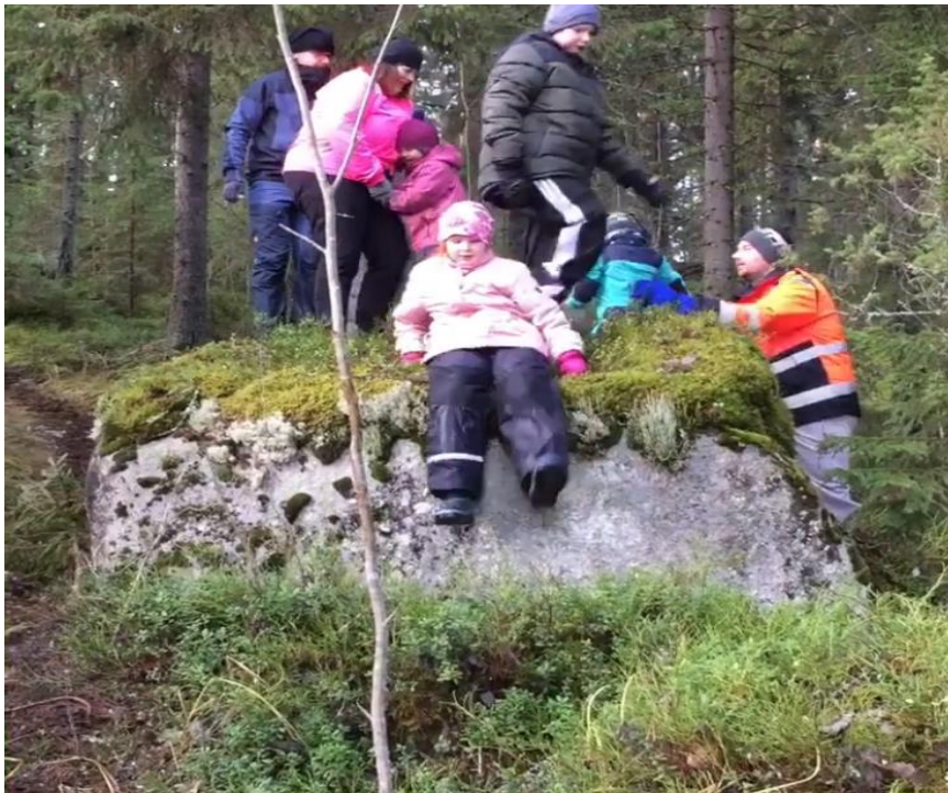
Kuva 3. Metsäretki.

haasteeseen hyvällä tekniikalla ja jokaiselle sopivalle kuntotasolle. Burbee-liikkeessä tavoitteena yleiskunnon kohentaminen. Haaste 5) Seitsemänvuotias tyttö on keksinyt kolme liikettä (rapukävely, karhukävely ja tasapainottelu). Tässä jälleen tavoitteena motoristen taitojen kehittyminen. Haaste 6) Koko perheen metsäretki. Tavoitteena liikkuminen erilaisissa olosuhteissa. Haaste 7) Leikkipuihin kiipeilemään ja tasapainoilemaan. Tämän tavoite oli edistää motorisia taitoja kokonaisuudessaan. Haaste 8) Tempurata kotiin lasten toiveita kuunnellen. Viimeisessä osiossa tavoitteena oli kehonhallinta erilaisissa tempuradan kohdissa.