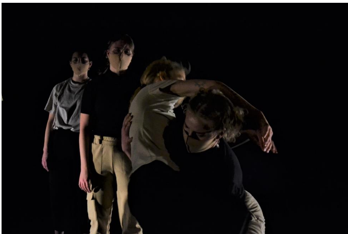
KUVA 7. Kuljetus (Karttunen 2021)

Kohtaaminen kuvaa luottamusta ja kosketusta suunnan näyttäjänä. Ryhmä huolehtii ja kannattelee silmät kiinni olevaa tanssijaa. Silmät kiinni tanssija ei voi ennakoida tai tietää mihin ryhmä häntä kuljettaa, ja hän herkistyy kosketukselle ja kosketusaistilleen. Silmät kiinni laittaminen, luottaminen ja kosketukselle antautuminen ovat tanssijan oma päätös. Ryhmä kerääntyy tanssijan ympärille ja kosketus kertoo tanssijalle, että ryhmä on lähellä ja läsnä ja kuljetus voi alkaa. Valot pimenevät hiljalleen kuljetuksen jatkuessa edelleen.