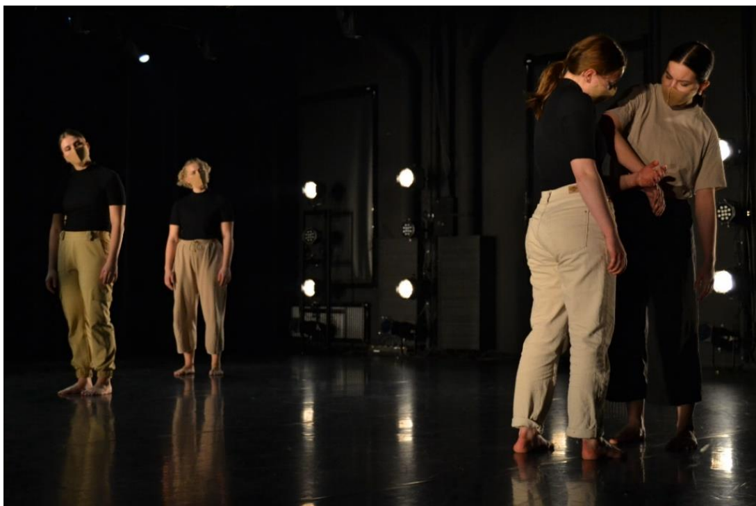
KUVA 6. Kosketuksen peilaaminen (Karttunen 2021)

Musiikki alkaa ja muu ryhmä tulee painostavasti lavalle. Tanssijoiden välillä on erilainen jännite, ja he tarkkailevat toisiaan ja ovat valmiita reagoimaan muutoksiin. Alun kohtaamiset toistuvat, mutta nyt kosketuksella. Kosketuksen tasot vaihtelevat herkästä riuhtoviin. Muun ryhmän rooli on kohtaamisen vahvistaminen, joko peilaamalla kohtaamisen sisältöä tai tekemällä kontrastia kohtaamiselle.