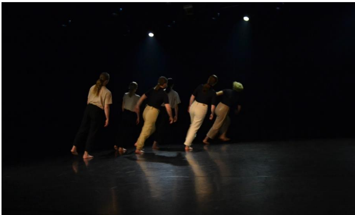
KUVA 2. Yhteinen kaatuminen (Karttunen 2021)

Kohtaus tutkii yhteyttä ilman kontaktia ja kohtaamista. Tanssijat ovat yksilöitä, jotka eivät näe toisiaan, mutta samalla tanssijoiden välillä on vahva vetovoima, joka tekee yksilöistä ryhmän. Tanssijoilla on sama päämäärä ja yhtenäinen liike. Kohtaus kuvaa arjen kohtaamattomuutta ja sitä, miten arjessa jollakin tavalla olemme yhteydessä toisiimme ja suoritamme samoja toimenpiteitä ja tehtäviä muiden kanssa, mutta samalla emme näe tai kohtaa toisiamme. Emme näe ihmistä vaan näemme hänen suorituksensa, tekonsa ja tittelinsä. Kohtaamattomuudesta huolimatta koemme kuitenkin hetkittäin vahvaa yhteyttä ihmisiin ja ryhmiin, joihin kuulumme. Ihminen tarvitsee yhteyden tunteen muihin ihmisiin ja haluaa tuntea kuuluvansa johonkin.