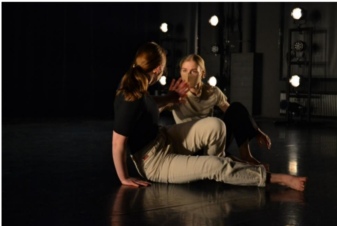
KUVA 5. Leikkisä duetto (Karttunen 2021)

Musiikki alkaa ja muu ryhmä tulee painostavasti lavalle. Tanssijoiden välillä on erilainen jännite, ja he tarkkailevat toisiaan ja ovat valmiita reagoimaan muutoksiin. Alun kohtaamiset toistuvat, mutta nyt kosketuksella. Kosketuksen tasot vaihtelevat herkästä riuhtoviin. Muun ryhmän rooli on kohtaamisen vahvistaminen, joko peilaamalla kohtaamisen sisältöä tai tekemällä kontrastia kohtaamiselle.