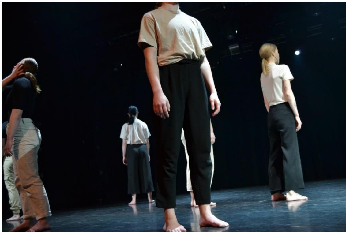
KUVA 4. Yksityinen ja suljettu hetki (Karttunen 2021)

Tanssillinen duetto alkaa. Siinä tanssijat antavat hellästi painoa huolehtien toisesta ja kannatellen toista. Tanssijoiden välillä on luottamus, ja he viimeistelevät toistensa liikkeitä. Liikkeessä korostuu rullaus, painonanto ja sulaminen toista kohti. Duetto alkaa kosketuksesta olkapäähän, joka on arkinen, mutta samalla merkityksellinen ja pysäyttävä. Muutoksen voimasta muu ryhmä kaatuu painopisteensä yli poistuen lavalta dueton alkaessa.