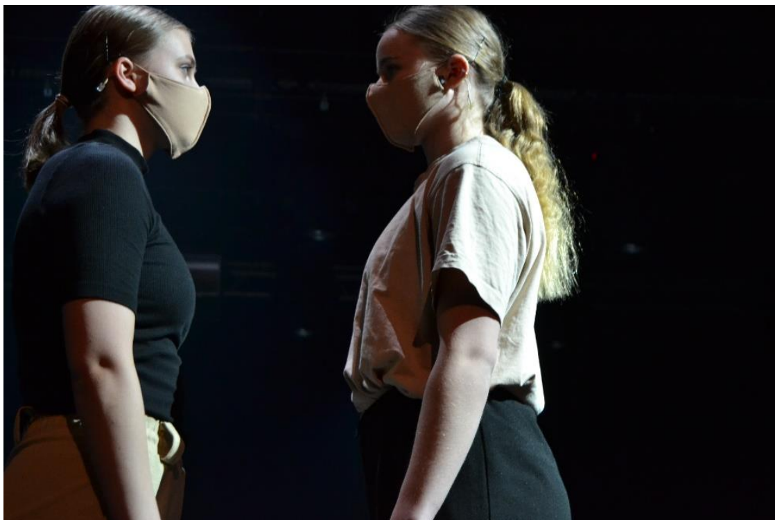
KUVA 3. Kohtaaminen (Karttunen 2021)

Toinen kohtaus alkaa liukuvasti ensimmäisen kohtauksen jälkeen. Kohtaus käsittelee kohtaamista ja tuo esille kohtaamisen merkityksiä. Tanssijat ovat omana itsenään lavalla ja läsnä sekä katsovat ja reagoivat. Tanssijat itsessään ovat kiinnostavia. Kohtaus on riisuttu liikkeestä pois ja vaihtelee arkisten ja tanssillisten kohtaamisten välillä. Lavalla tapahtuu liukuvia hetkellisiä kohtaamisia, joissa kävellään, katsotaan ja pysähdytään. Kohtaamisten väleissä tanssijoiden kaatumiset ja juoksu pyyhkäisevät ja tyhjentävät lavan. Kahden tanssijan kohtaaminen ja katsekontakti kestää pitkään. Lopulta tanssija yrittää koskettaa toista ensin varovaisesti ajatellen, onko siinä oikeasti toinen ihminen vai olenko tässä yksin. Toinen tanssija väistää, mutta peilaa toimintoa koskettamalla takaisin. Molemmat yrittävät koskettaa toista, mutta haluaako kumpikaan oikeasti tulla kosketetuksi. Pikkuhiljaa uskallus kasvaa ja koskettamisen yrittäminen konkretisoituu. Muu ryhmä katsoo tilannetta yrittäen ajoittain liittyä kohtaamiseen, mutta kohtaaminen on selkeästi kahden tanssijan välinen ja suljettu.