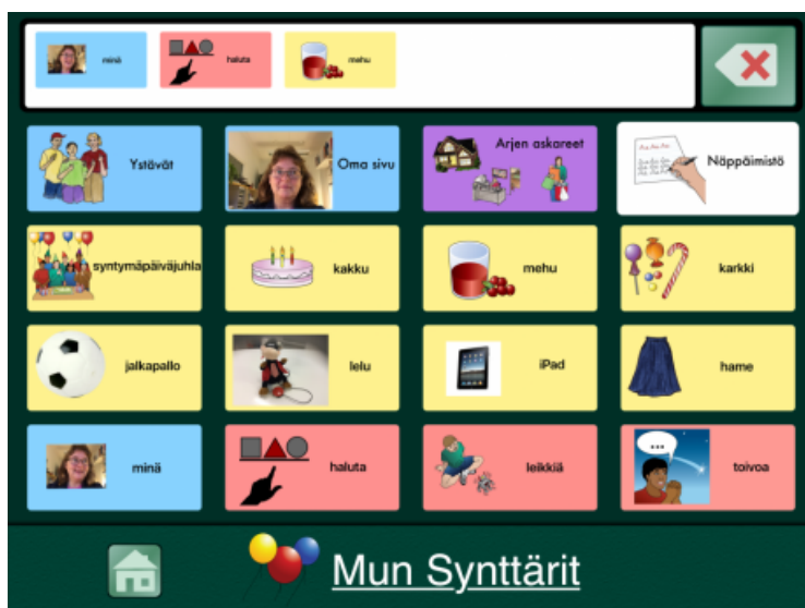
Kuva 2. Go Talk Now -näkyvä (Papunet 2020)