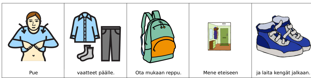
Kuva 3. Sosiaalinen tarina siirtymätilanteeseen (mukailtu Halonen-Malliarakis ym. 2020, 46)

Ohjauksessa voi käyttää apuna kuvia, jotta muutosten ymmärtäminen ja ennakoiminen mahdollistetaan autismin kirjon henkilölle (Socada 2020). Autismin kirjon henkilöt kiinnittävät poikkeuksellisen paljon yksityiskohtiin huomiota – niin paljon, että se voi aiheuttaa vaikeuksia toiminnanohjauksessa. Kuitenkin ohjauksessa tätä voi käyttää hyödyksi antamalla selkeää, mutta yksityiskohtiin liittyvää ohjausta, esimerkiksi pilkkomalla siirtymätilanteen pieniin osiin ja antamalla siitä kuvalliset ohjeet, kuten kuvassa 3. on nähtävillä (Halonen-Malliarakis ym. 2020, 46). Kuvan sosiaalinen tarina pilkkoo siirtymätilanteen kuvin pieniin osiin: ”Pue – vaatteet päälle – ota mukaan reppu – mene eteiseen – ja laita kengät jalkaan.” Sosiaalisia tarinoita ja kommunikaatiokuvia voi tehdä ilmaiseksi esimerkiksi Papunetin kuvatyökalulla (Papunet 2021).