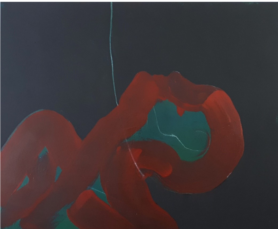
The loop (2021), yhdistelmätekniikka, 60,5 x 50 cm.