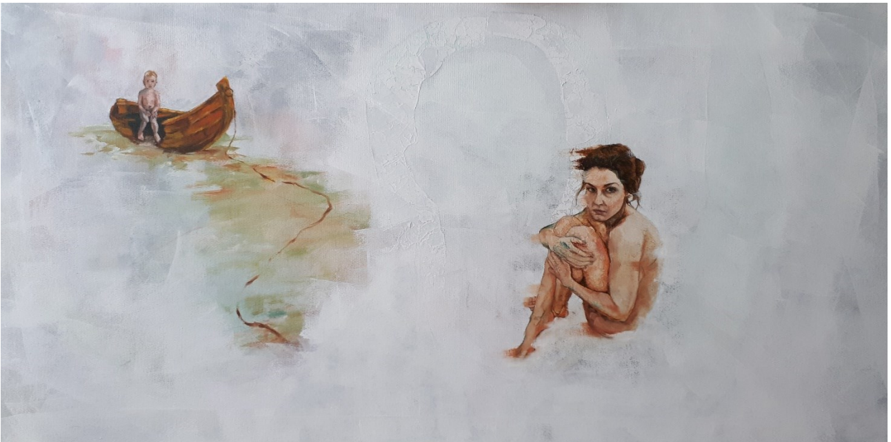
Mother Mary (2021), yhdistelmätekniikka, 100 x 50 cm.