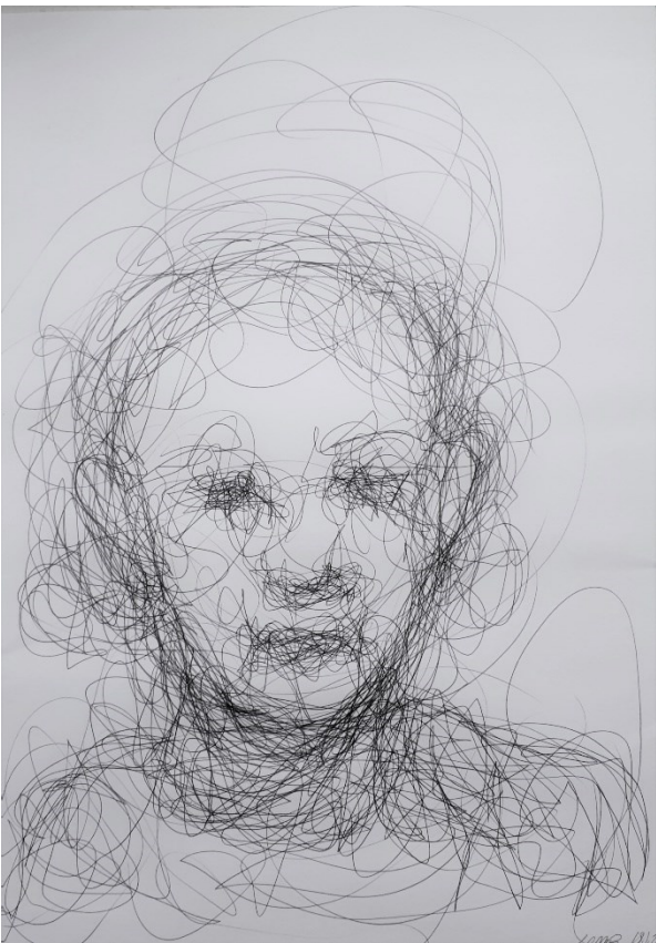
Viiva (2021), kuulakärkikynä paperille, 29,5 x 41,7 cm.