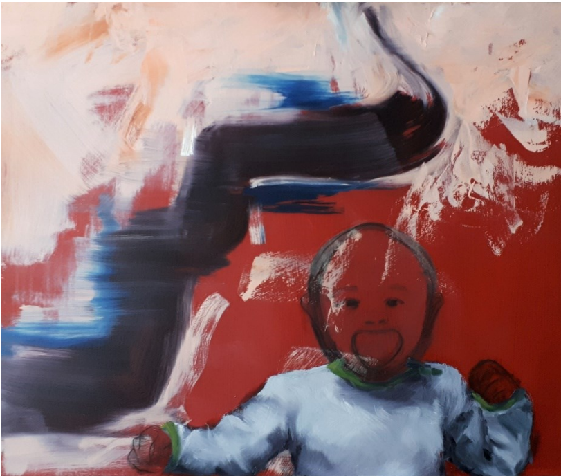
Läheisyys (2021), yhdistelmätekniikka, 60 x 50 cm.