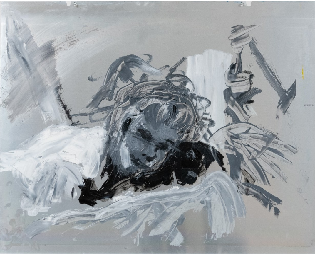
Hetki (2021), öljy metallille, 74,5 x 61,2 cm.