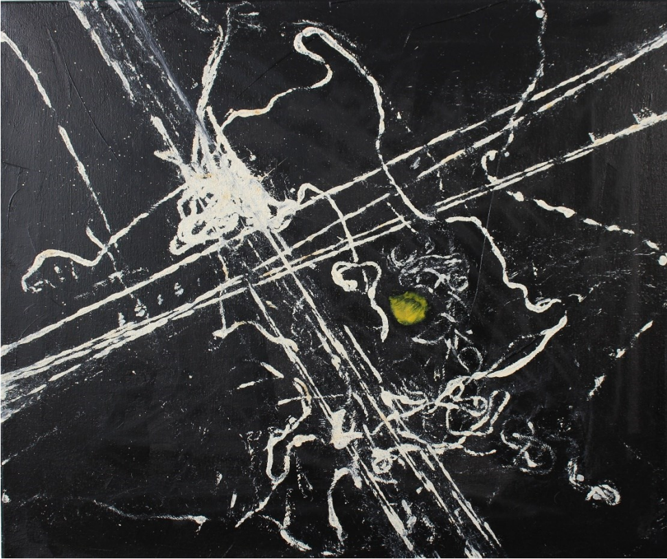
16.10.2020 (2020), öljy kankaalle, 60 x 50 cm.