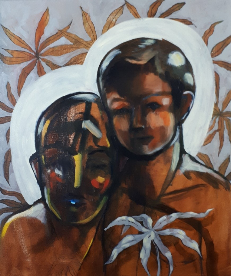
Madonna ja lapsi (2021), yhdistelmätekniikka, 50 x 60 cm.