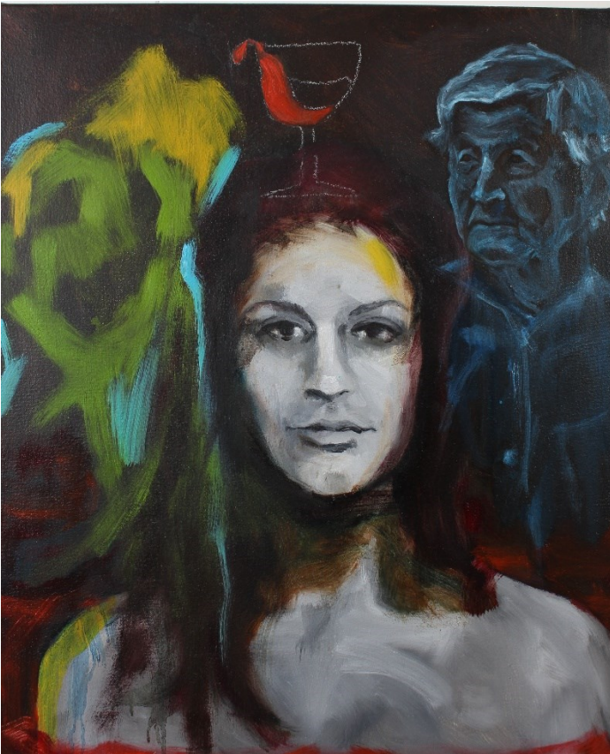
I didn't get it from my mother's side (2021), yhdistelmätekniikka, 50 x 60 cm.