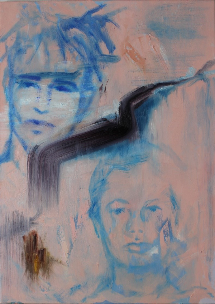
Hi's dreams and my nightmares (2020), öljy kankaalle, 50 x 70 cm.