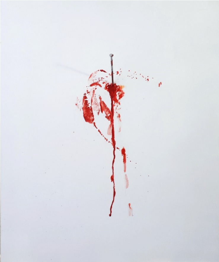
Itkuseinä (2021), yhdistelmätekniikka, 50 x 60 cm.

Kuvadokumentointi ripustusvaiheesta, Taidekeskus Mältinranta Tampere 14.5.2021: