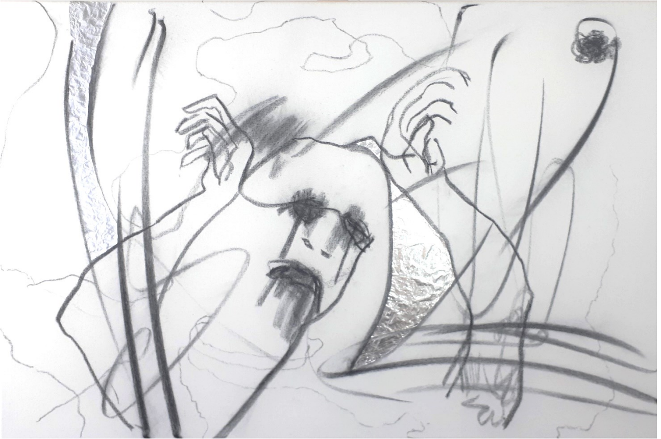
Silver lining (2021), hiili ja folio kankaalle, 90 x 60 cm.