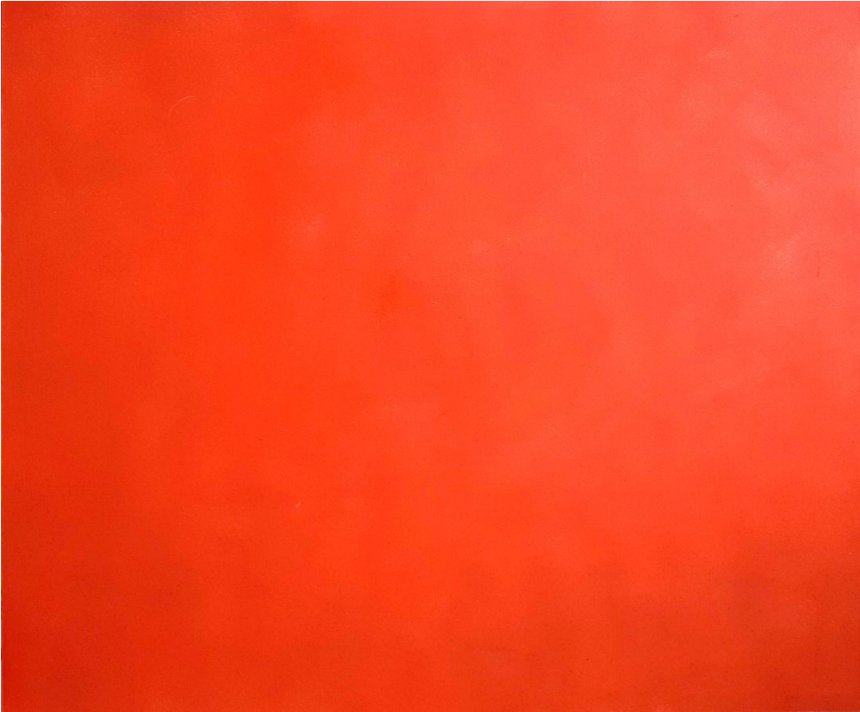
Punainen (2021), öljy levyllä, 60 x 50 cm.