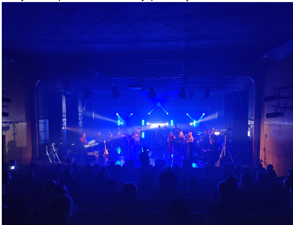
KUVA 8. Konsertin aikana. (Toivonen 2020)

Kello 20.20 aikaan konsertti päättyi. Yleisö olisi halunnut encoren, mutta selitin yleisölle, että meillä oli kiireinen aikataulu roudauksen suhteen, joten valitettavasti emme pystyneet soittamaan enää mitään. Yleisö poistui salista koronaturvallisesti ruuhkauttamatta käytäviä ja samaan aikaan orkesteri, ääni- ja valomiehet kasailivat tavaroitaan pois näyttämöltä. Olimme jälleen aikataulusta edellä, sillä jo kello 21.15 aikaa kaikki tavarat olivat pois näyttämöltä. Aikataulu piti hämmästyttävästi paikkansa koko esityspäivän ajan.