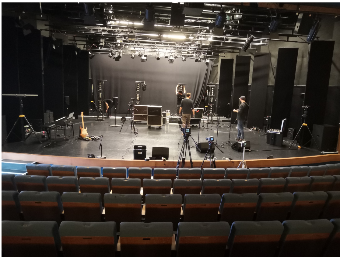
KUVA 7. Hällä-näyttämö roudausvaiheessa. (Laukkonen 2020).

Olimme aikataulussa koko roudauksen ajan. Valomiehet valoineen ja Komiat saapuivat aikataulun mukaisesti paikalle roudaamaan omia soittimiaan ja vahvistimiaan lavalle. Itse kasailin siinä sivussa omia soittimiani valmiiksi ja hain soittajille tuolit ja nuottitelineet valoineen. Olin laittanut kaverin ostamaan soittajille välipalaa, jonka kävin hänen kanssaan asettelemassa näyttämön takatiloihin esiintyjä varten. Olimme aikataulussa edellä, kun kello 15.30 lava oli valmis, mutta päätimme silti aloittaa soundcheckin alkuperäisen suunnitelman mukaan kello 16.