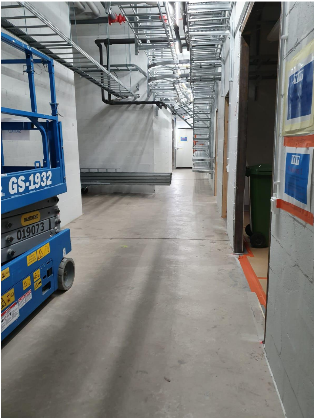
Kuva 2. Yleiskuvaa P1-puhtausluokan alueelta.

Kohde työmaan pölynhallintasuunnitelmat eivät ole julkisia, joten niitä ei tässä opinnäytetyössä julkaista, mutta suunnitelmissa käytetty lähdemateriaali perustuu mm. Ratu 1225-S pölyntorjunta rakennustyössä -suunnitteluohjeeseen. Se sisältää korjaus- ja uudisrakentamisen pölyntorjunnan suunnittelun ja toteutuksen käytäntöjä, joita tarvitaan sisäilmastoluokituksen ja valtioneuvoston asetuksen rakennustyön turvallisuudesta (205/2009) asettamien tavoitteiden toteuttamiseen. Ohje on tarkoitettu tilaajille sekä työmaan toteuttajille. (Ratu 2009.)