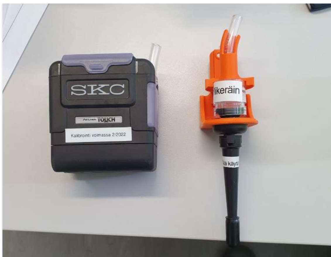
Kuva 3. SKC vakiovirtauspumppu sekä GS-3 sykloni varustettuna millipore keräimellä.

Näytteidenottoa varten Työterveyslaitos toimitti 2 kappaletta SKC AirChek TOUCH Model 220-5000TC vakiovirtauspumpppua, 5 kappaletta alveolijakeen erottelevia GS-3-sykloneita sekä 5 kappaletta suodattimella varustettuja kolmi-osaisia ns. Millipore -keräimiä, 25 mm halkaisijalla. Lisäksi toimitus sisälsi ns. nollanäytteen, johon muita näytteitä verrataan, mallikappaleen syklonin ja keräimen kokoonpanosta, ohjeet näytteenottoon sekä tilauskaavakkeen.