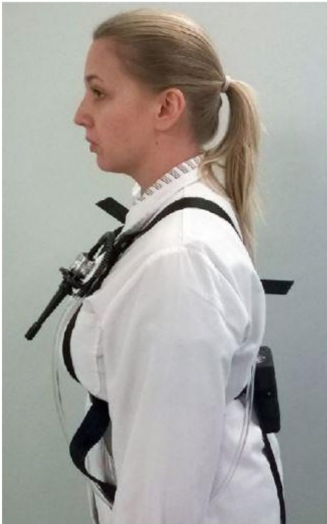
Kuva 4. Näytteenottolaitteisto kiinnitettynä työntekijään. (TTL 2021)

Näytteenottoa varten vakiovirtauspumppu kalibroidaan tilavuusvirralle 2,75 l/min, kun käytetään GS-3 sykklonia. Vakiovirtauspumppu ja keräin yhdistetään letkulla, jonka jälkeen ne kiinnitetään työntekijään. Keräin asetetaan noin rinnan korkeudella ja pumppu selän puolelle, esimerkiksi vyölle tai valjaisiin. Näytteenottoaika oli 6 tuntia / näyte.