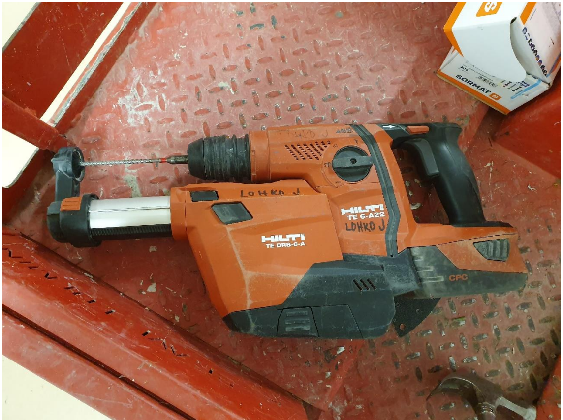
Kuva 3. Kohdepoistolla varustettu porakone

Mittauksien ajalta oleellinen data kerättiin taulukkoon, josta käy ilmi näytteen tunnisteen, henkilön työtehtävä, käytetyt työmenetelmät, työskentely alue ja sen puhkausluokka, mahdolliset alueella tehdyt pölyävät työt, näytteenoton aloitus- ja lopetusaika, vakiovirtauspumpun tilavuusvirta, sekä mitattu ilmamäärä.