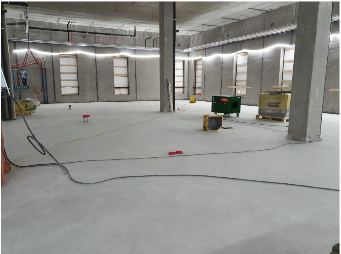
Kuva 1. Yleiskuvaa työmaan puhtaustasosta. Kuvassa myös HEPA suodattimella varustettu ilmanpuhdistin.

Lisäksi ilmanvaihdon tehostaminen tuuletuksella tai alipaineistuksella vähentää altistumista työssä, jossa vapautuu pölyä tai kemiallisia epäpuhtauksia. Rakennusmateriaalit on myös suojattava kuljetuksen sekä varastoinnin ajaksi. Varastoinnin aikana pölyn pintakertymä on minimoitava työnaikaisella siivouksella. Työnaikaisessa siivouksessa karkea jäte poistetaan imurilla, lastalla tai lapiolla. Harjasiivousta ei P1 työmaalla saa käyttää, sillä se nostaa tehokkaasti pölyä ilmaan. Imurit on oltava M- tai H-luokkaa ja varustettava HEPA-suodattimella. Lopuksiivouksen yhteydessä, sekä tarvittaessa myös muulloinkin kovat ja sileät pinnat voidaan puhdistaa nihkeäpyyhinnällä.