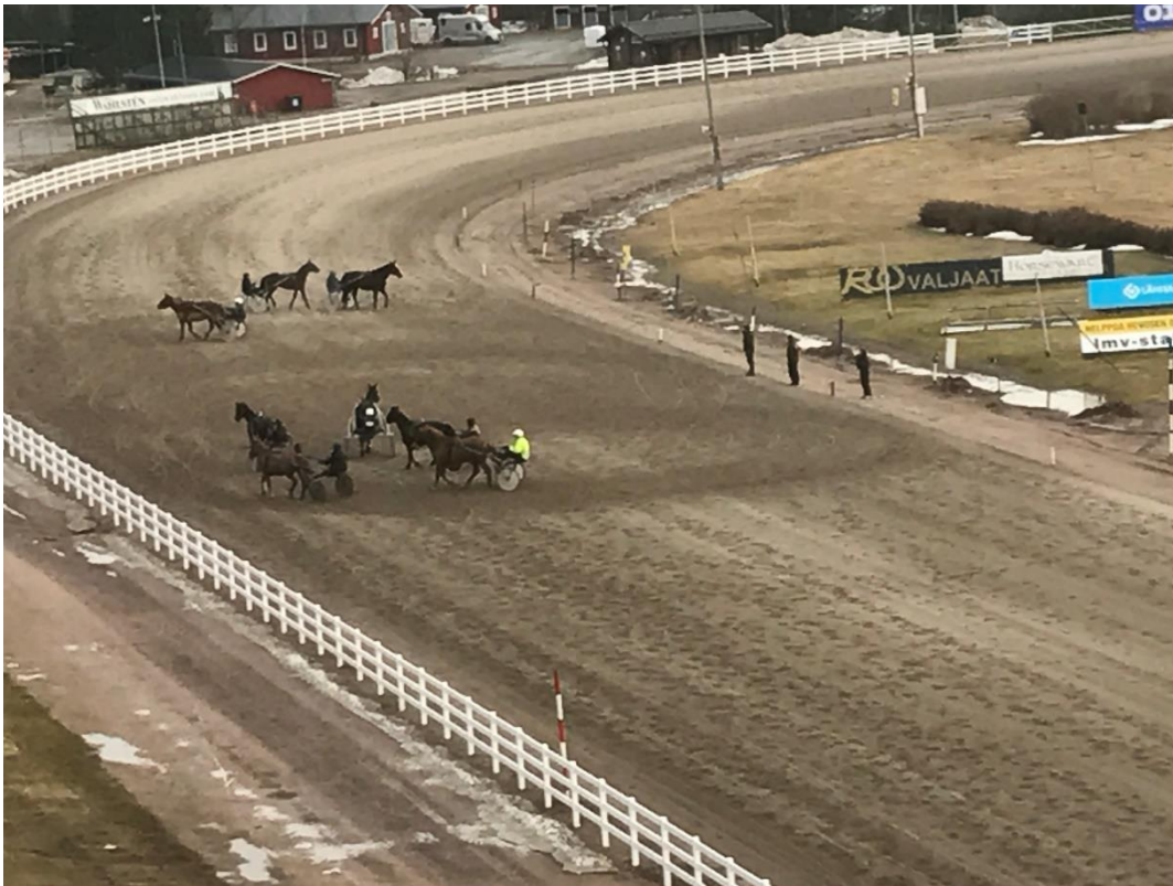
Kuva 4 Korttikurssin ajoharjoitukset tuomaritornista katsottuna