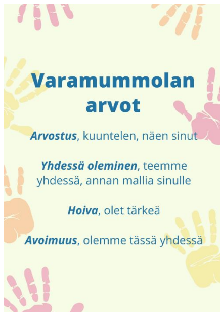
Kuva 1: Varamummolan arvot

Varamummolassa ei asu sijoitettuja lapsia eikä se ole kenenkään koti; täten mahdollisesta kaikille asiakkaille tasa-arvoinen tukilomakokemus eikä lasten tarvitse pohtia mahdollista omaa eriarvoisuuttaan verrattuna tavallisiin tuki- ja sijaisperheiden lapsiin. Fyysisesti yritys koostuu kahdesta omakotitalosta Lohjalla, joissa sekä vietetään tukilomia, että toteutetaan muita avohuollon tukitoimina myönnettäviä palveluita. (Varamummola 2019.)