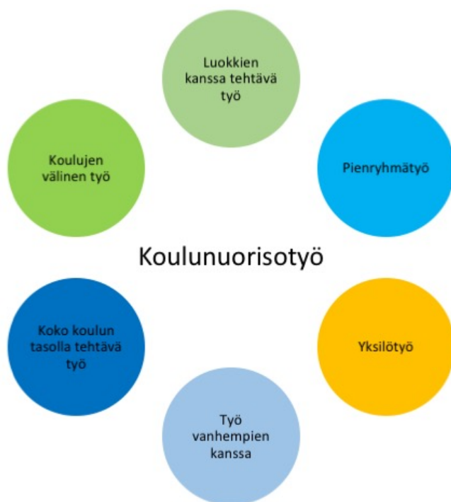
Kuvio 2. Koulunuorisotyön työmuodot

Kuvio 2 esittää työmuotoja, joita koulunuorisotyössä on Lahdessa toteutettu. Työmuotojen esittely perustuu sekä Tomi Kiilakosken (2015, 86-106) esittämään jaotteluun eri työmuodoista, että Lahden nuorisopalveluiden (2015, 4-14) kuvailuun koulunuorisotyöntekijöiden toteuttamista työmuodoista.