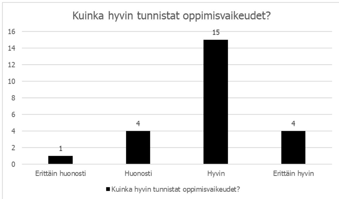
Kuvio 2. Kuinka hyvin oppimisvaikeudet tunnistettiin.

Alla pylväsdiagrammi, jossa kuvattuna kuinka hyvin vastaaja tunnistaa mielestään oppimisvaikeudet.