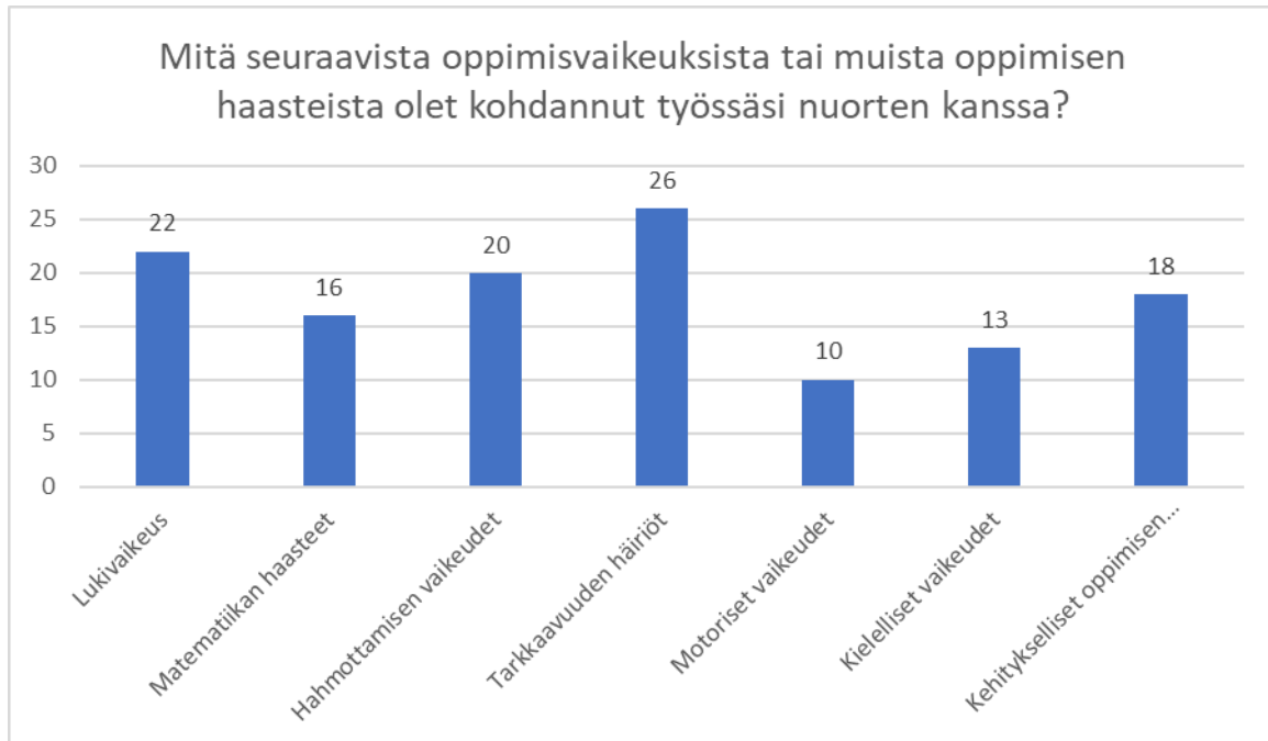
Kuvio 3. Mitä oppimisvaikeuksia vastaaji kohtasivat työssään.

Toimintaan osallistumisen haasteet näkyivät erityisesti nuorten osalta, keillä oli jokin oppimisvaikeus. He olivat haluttomampia osallistumaan yhteisiin tekemisiin ja oman toiminnan ohjauksessa oli usealla haasteita, mikä heijastui tavalliseen arkeen. Kuten on aikaisemmin todettu, oppimisvaikeudet ovat usein päällekkäisiä, ja niitä voi sen takia olla hankala huomata.