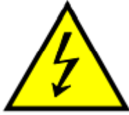
Kuva 2. Korkeajännitelaitteen merkintä.

Suorannaista hengenvaaraa ei siis täyssähkö- ja hybridautoissa pitäisi olla, mikäli autot ovat ehjiä ja komponentit ja suojat ovat alkuperäisessä kunnossa. Korkeajännitekomponentit voi erottaa muista komponenteista niissä olevien varoitusmerkkien ansiosta. Myös korkeajännitejohtimet erottuvat hyvin muista auton kaapeleista värinsä ansiosta. Yleisissä ohjeissa mainitaan 30 senttimetrin suojavyöhyke, jota lähempänä korkeajännitekomponentteja tulee noudattaa suurta varovaisuutta.