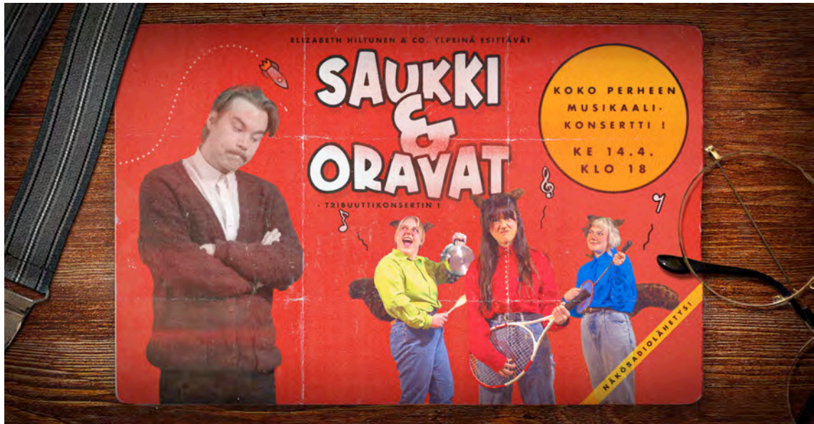
Kuvio 9. Facebook tapahtuman mainos

Loin Facebook tapahtuman kaksi viikkoa ennen konsertin ensiesitystä. Tapahtumaan oli osallistuneita ja kiinnostuneita yhteensä 173 henkilöä. Yhtä aikaa katsovia ensiesityksellä oli 42. Konsertti jäi ensiesityksen jälkeen katsottavaksi YouTubeen, mikä nosti katselukertojen määrää. 16.4.2021 videon katselukertoja oli 259 kappaletta.