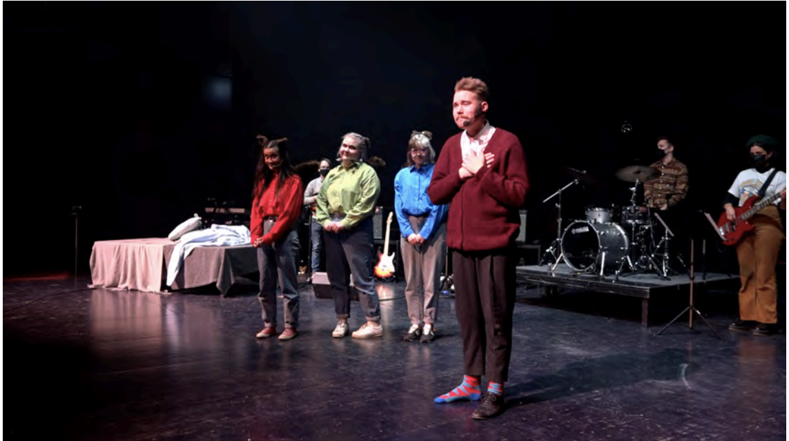
Kuvio 5. Kuvassa Saukki leppyy oravien anteeksipyyntön seurauksena