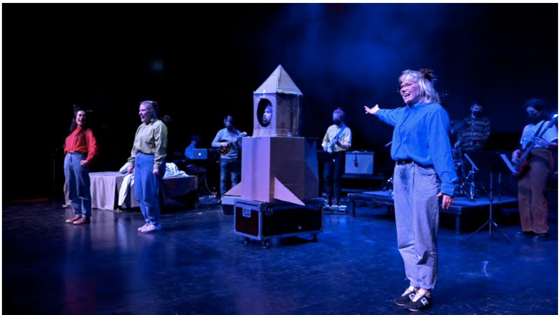
Kuvio 8. Kuuraketti valmiina lähtöön