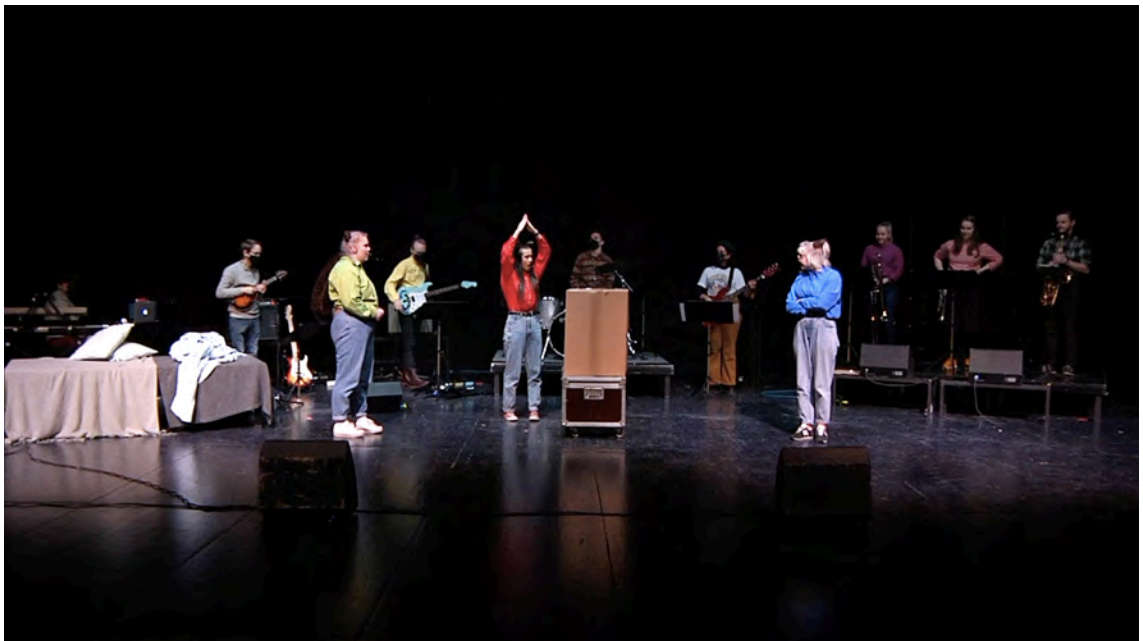
Kuvio 7. Kuvassa raketti vielä keskeneräisenä ennen Pikkuoravien kuuraketti kappaleen alkua.

Minulla ei ollut konserttiin suurta budjettia, joten kaikki rekvisiitta ja asut, joita konsertissa käytettiin ovat joko omasta kaapista löytyvää, kierrätettyä tai itse tehtyä. Oravien hännät ja korvat ompelin kierrätetystä tekstiilikangasta. Saukin vaatteet löytyivät Saukin esittäjän omasta vaatekaapista, ja oravien paidat ostimme Second hand -myymälästä. Valitsimme vaatteet myös sen mukaan, että niitä voisi käyttää muulloinkin kuin esiintyessä. Pikkuoravien kuuraketissa käytetty pahvinen raketti on tehty vanhoista pahvilaatikoista. Kaikki muu rekvisiitta löytyi sopivasti omasta kaapista.