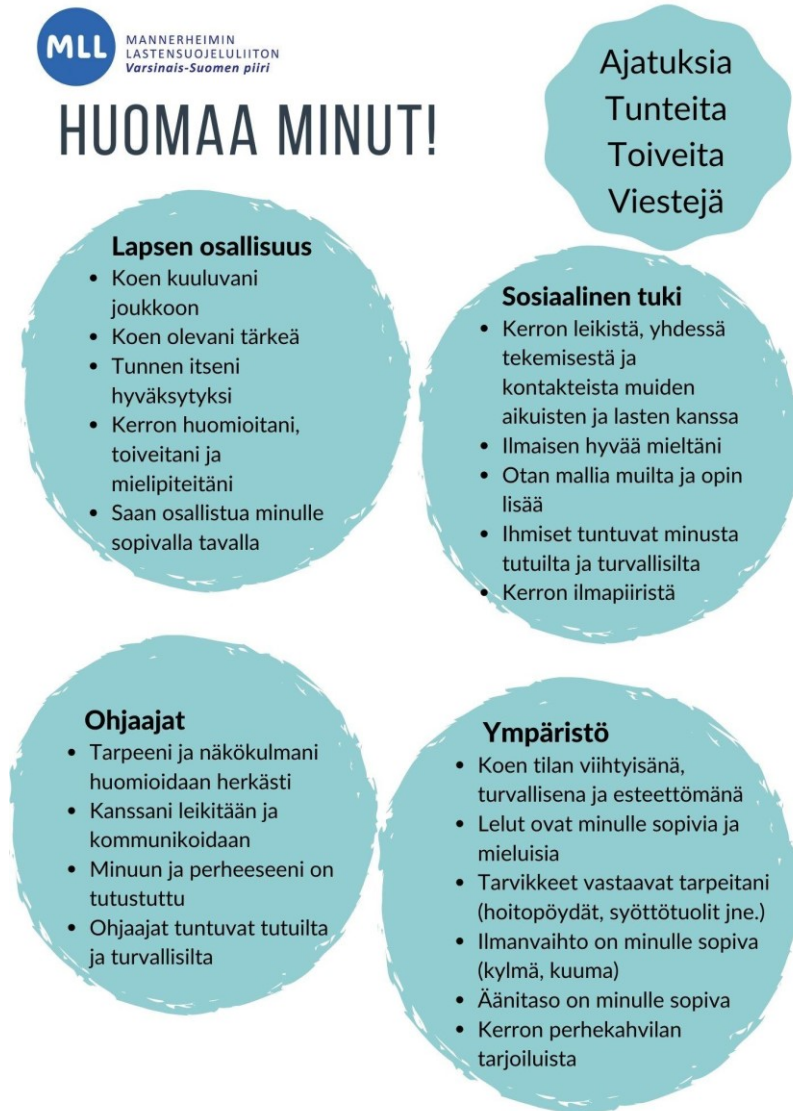
Kuvio 1. Lomake tutkimuksen analyysin tukena

työntekijät ja vapaaehtoiset tutustuttavat uudet perheet toisiin perheisiin ja lisäksi työntekijöiden ja vapaaehtoisten hyvä vuorovaikutus heijastuu hyvänä ilmapiirinä koahtamispaikassa. (Perheet keskiöön! 2020.)