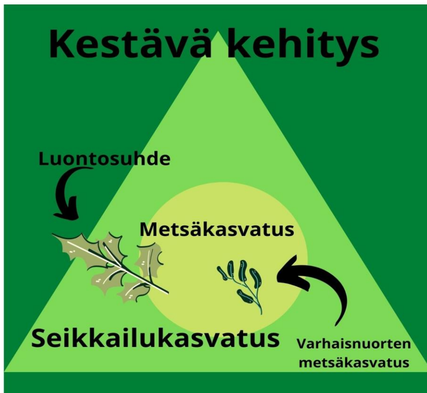
Kuviol. Tietoperustan käsitteet suhteessa toisiinsa

Tietoperustassa käsitellyt aiheet ovat hyvin ajankohtaisia ja erityisesti kestävä kehityksen kysymykset ovat jatkuvasti esillä medioissa. Huhtikuussa uutisoitiin uusiutuvien polttoaineiden käytön olleen ensimmäistä kertaa fossiilisten polttoaineiden käyttöä suurempaa (Yle 2021). Uusiutuvan energian käyttö on yksi Agenda30 – tavoitteista ja liittyy siis olennaisesti kestävään kehitykseen. (Sustainable development 2021.) Toukokuun alussa uutisoitiin kestävyystieteen suur tapahtumasta, jonka teemana on tuho ja luovuus. Tapahtuma järjestetään toukokuun lopulla ja se keskittyy YK:n kestävä kehityksen tavoitteisiin. (Hopiavaara & Peltonen 2021.)