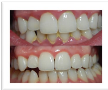
Kuva 1. Plakin aiheuttama ientulehdus ennen ja jälkeen hammasvälien puhdistuksen