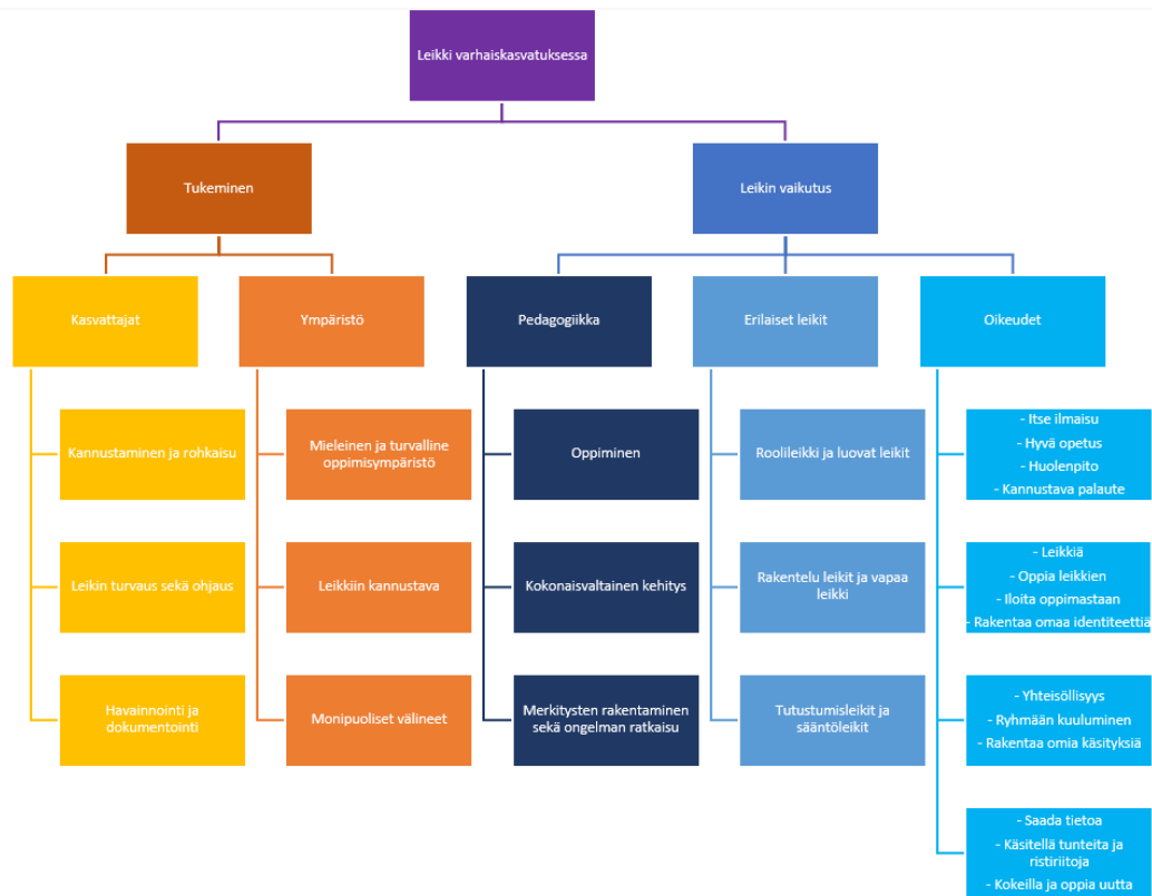
Kuvio 2: Ajatuskartta

Opinnäytetyöni tulen toteuttamaan kirjallisuuskatsauksena. Tulen tekemään kuvallisen narratiivisen kirjallisuuskatsauksen, sillä tulen kokoomaan aineistosta mahdollisimman monipuolisen, mutta kuitenkin selkeän kokonaisuuden. Valitsin narratiivisen kirjallisuuskatsauksen sillä se mahdollistaa hyvin hajanaisenkin tiedon kokoamisen yhdeksi kokonaisuudeksi, jolla voi vastata laajoihinkin tutkimuskysymyksiin. Tulen analysoimaan 11 suomen- sekä englanninkielistä tutkimusaineistoa.