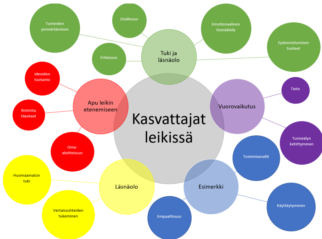
Kuvio 4: Kasvattajat leikin tukena (tulokset)