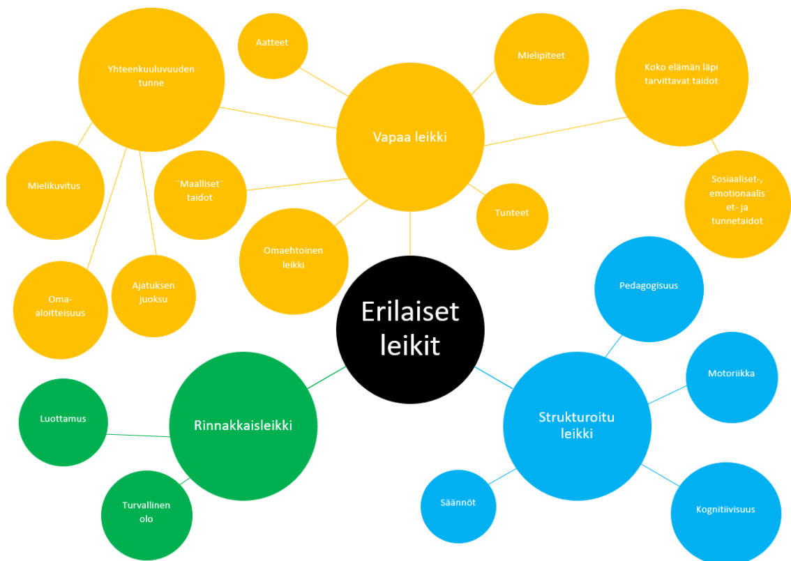
Kuvio 5: Erilaiset leikit kasvun, kehityksen ja hyvinvoinnin tukena (tulokset)

Niin kuin huomamme kuviosta 5 on tärkeää, että vapaata leikkiaikaa ei sekoiteta strukturoituun kasvattavaan ja opettavaan leikkiin. Tutkimus tuloksista huomaa, että vapaassa leikkiajassa lapset ovat oppineet ”maallisia” asioita sekä taitoja, kun taas strukturoiduissa opetushetkissä lapset oppivat enemmän pedagogisesti uutta tietoa. Strukturoitu leikki on varhaiskasvatusopettajan järjestämää leikkiä tai toimintaa. Strukturoidulla leikillä on selkeät tavoitteet ja päämäärät. Strukturoidussa leikissä pedagogisuus on suuressa osassa, ja lapsi oppii esimerkiksi kognitiivisuutta, sääntöjä sekä motoriikkaa. Varhaiskasvatuksessa ja siellä käytettävässä pedagogiikassa nähdään leikki usein lasten omaehtoiseksi toiminnaksi. (Ching 2018, 54 & 55; Kangas & Brotherus 2017, 1 & 4; Köngäs 2018, 128.)