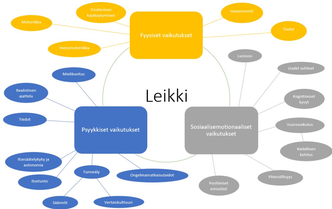
Kuvio 3: Leikin merkitys lapsen hyvinvointiin (tulokset)

Leikki lisää positiivisia emootioita sekä aktivoi lasten osallisuutta. Lapset eivät voisivat kasvaa "asianmukaisesti" ilman leikkiä. Leikin avulla lasten fyysinen kehitys, niin motoriset kuin hienomotorisetkin taidot pääsevät kehittymään. Kasvu ja kehitys on tulosta niin leikistä, mutta myös oppimisesta strukturoidussa opetustilanteissa. Leikki ja oppiminen ovat kaksitahoisia, toisistaan riippuvaisia. Leikissä keskustellaan ja kommunikoidaan toisten lasten kanssa, jonka takia se opettaa lapsille puhetta, kommunikointia, äidinkieltä, tunteita sekä esimerkiksi motorisia taitoja. Leikissä kommunikointi on suuressa osassa, joten leikin avulla lasten kielellinen kehitys pääsee kasvamaan sekä kehittymään. Leikki opettaa lapsille suullista kieltä sekä sanastoa. (Ching 2018, 63-67; Bough 2018, 108; Nilsson ym. 2018, 231-240.)