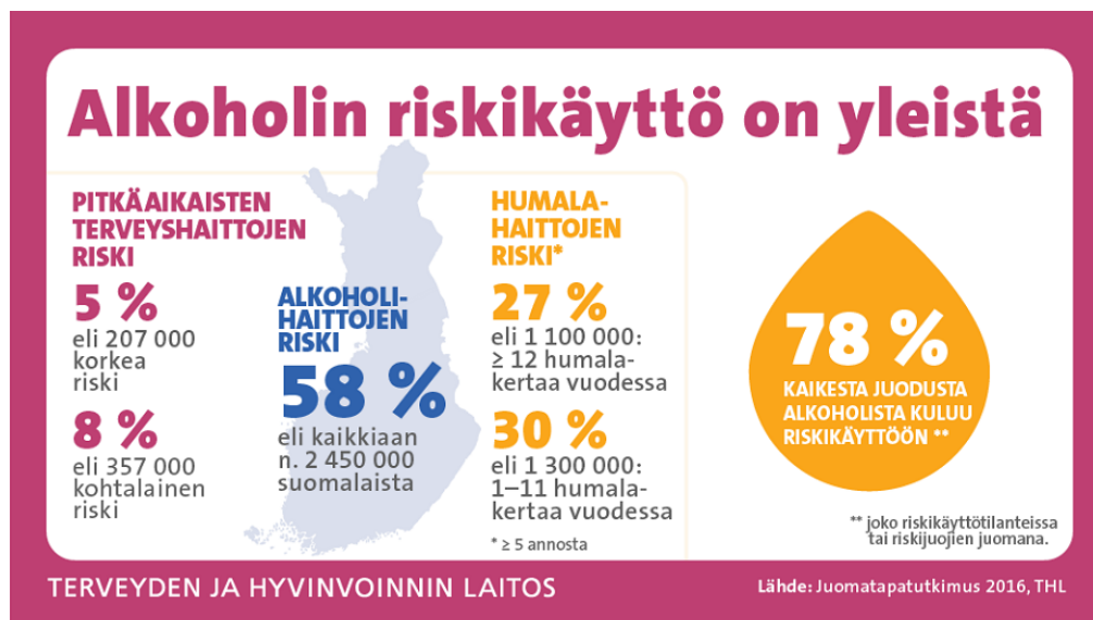
KUVA 2. Alkoholin riskikäyttö. (Näin Suomi juo 2021.)

Alkoholin riskikäyttö on Suomessa yleistä. Juomatapatutkimuksen mukaan ainakin 13 % väestöstä, eli yli 560 000 suomalaista käyttää alkoholia niin paljon, että siitä on aiheutunut heille pitkäaikaisten terveyshaittojen riski. Riskirajana tutkimuksessa käytettiin kohtalaisen riskin rajaa, joka on viikossa naisilla 7 annosta tai enemmän ja miehillä 14 annosta tai enemmän. (Näin Suomi juo 2021.)