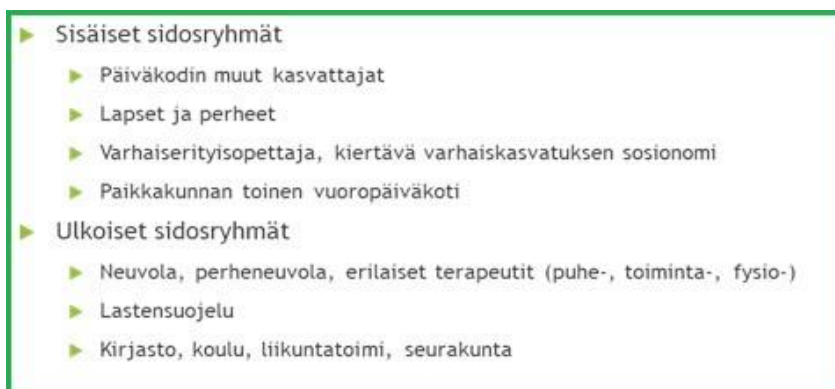
Kuvio 1: Sidosryhmät

Työhöni liittyviin sidosryhmiin lasken myös kirjaston, lähikoulun ja seurakunnan sekä esimerkiksi kaupungin liikuntatoimen, joiden kanssa teemme yhteistyötä erilaisten tapahtumien ja tempausten merkeissä. Tosin vuonna 2020 yhteistyö jäi vähäiseksi Covid-19-pandemian vuoksi, ja näyttää siltä, että ainakin alkuvuosi 2021 jatkuu valitettavasti samalla mallilla.