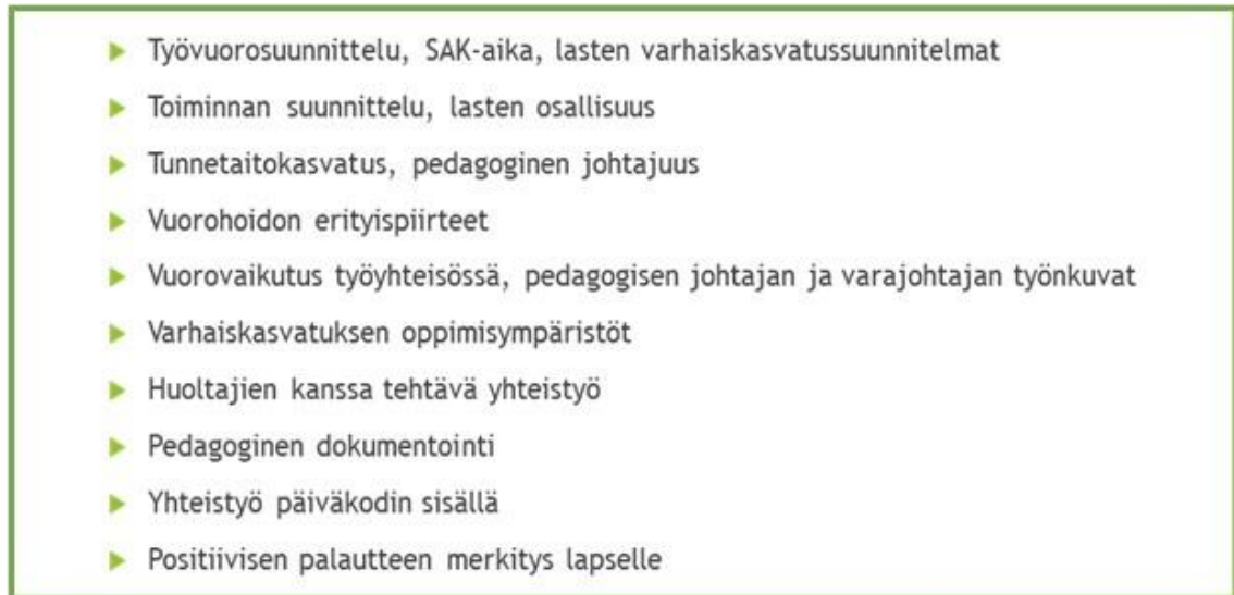
Kuvio 3: Viikkoanalyseissä käsitellyt teemat

esiin asioita, jotka ovat mielestäni hyvin tyypillisiä varsinkin vuorohoidolle. Vuorohoidon erityispiirteiden lisäksi olen nostanut esiin esimerkiksi lasten osallisuuden, työyhteisön hyvän vuorovaikutuksen ja vanhempien kanssa tehtävän yhteistyön merkitystä. Kaikki viikkokoosteissa käsittelemäni teemat on kerätty alla olevaan kuvaan.