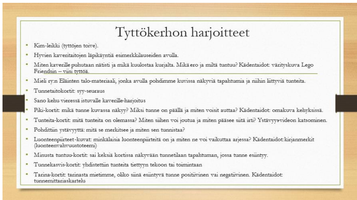
Kuva 2: Tyttökerhon sisältöä

toisten kehumista ja kannustamista aivan spontaanisti arjessa. Näistä pystyn antamaan välittömästi positiivista palautetta ja kertoa tytöille, kuinka ylpeä heistä olen. Yhteishenki yhteisessä kivassa tekemisessä on saavuttanut juuri sen, mitä toivoin. Tytöt pystyvät kommunikoimaan keskenään samanvertaisina, toisiaan kannustaen ja tsemptäen. Tämä kerho kantaa heidelmää pitkälle tulevaisuuteen. Tyttöjen välinen parantunut kommunikointi on nostanut esiin erilaisten positiivisten äänenpainojen merkityksen. Nykyinen kaverillinen sävy, jolla on hyvä vaikutus, on selvästi yleistynyt tyttöjen käytössä. Tyttöillä on nyt käytössään työvälineitä, joilla vastoinkäymiset muutetaan vahvuuksiksi. Näin ne peittoavat heikkouden ja ovat jokaisen tytön kantava voima myös tulevaisuudessa. Tästä tyttöjä muistuttaakin yhdessä tekemämme vahvuustoteemit kirjanmerkkeinä. Jälkikäteen miettien, olisimme voineet ensimmäisellä kerralla sopia tyttökerholaisten kanssa yhteisiä sääntöjä, jotka olisivat olleet kuin kerhon selkäranka.