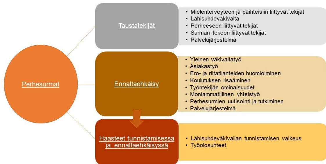
Kuvio 2. Analyysissä muodostuneet pää- ja yläluokat.

kuin se on mahdollista aineiston sisällön näkökulmasta. Koko prosessin ajan on tarkasteltava, että polku alkuperäiseen dataan säilyy. Käsitteitä yhdistelemällä saadaan lopulta vastaus tutkimustehtävään ja tämän pohjalta tutkija tekee johtopäätökset. (Tuomi & Sarajarvi 2018, 125–127.) Tähän vaiheeseen siirryttäessä alaluokkia oli muodostunut 40 ja yläluokkia 15. Luokkien yhdistämistä jatkettiin edelleen siten, että yläluokista muodostui pääluokat. Pääluokkia muodostui lopulta kolme; taustatekijät, ennaltaehkäisy sekä haasteet tunnistamisessa ja ennaltaehkäisyssä (kuvio 2).