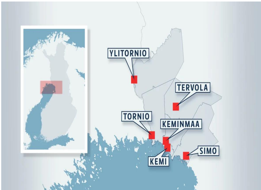
Kuva 1. Meri-Lapin kaupungit- ja kunnat. (Yle 2019, Meri-Lapin kunnanjohtajilta pitkä lista toiveita hallitusohjelmaan.)

Meri-Lapissa on asukkaita yhteensä noin 60 000. Meri-Lapin kunnista eniten ihmisiä asuu Torniossa ja toiseksi eniten Kemissä. Nämä kaksi kaupunkia vetävät puoleensa Meri-Lapin asukkaista noin 40 000. Vähiten asukkaita on Tervolan kunnassa, jossa vuoden 2021 alussa oli asukkaita vain 2924. (Yle 2021, Meri-Lappi menetti viime vuonna yli 600 asukasta – moni kunta putosi uudelle tuhat luvulle.)