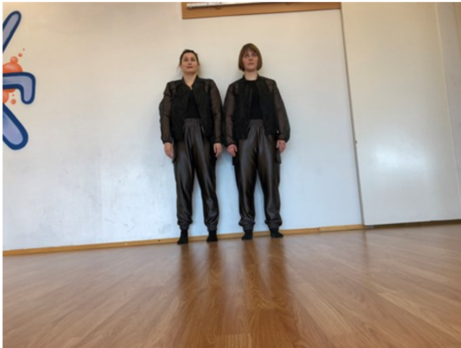
Kuva 4. Teoksen alkuperäiset esitysvaatteet. 25.2.2020