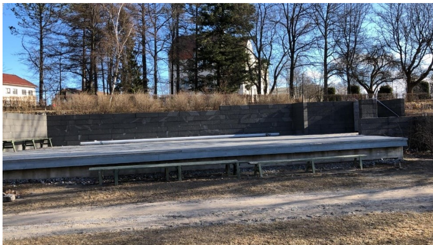
Kuva 3: Pietarsaaren ulkolava. 29.3.2020