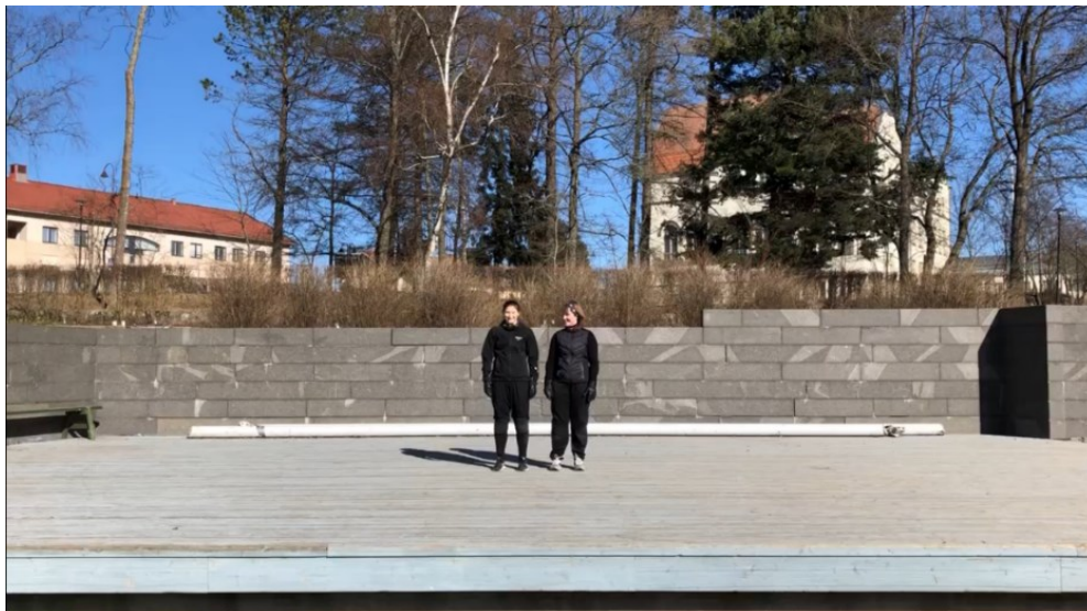
Kuva 5: Toteutuneet esitysvaatteet. Stillkuva videolta 29.3.2020