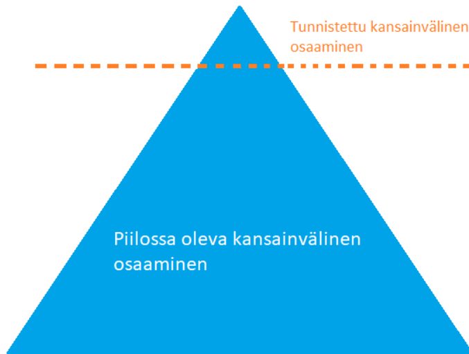
Kuvio 2. Tunnistettu kansainvälisyys (Demos Helsinki 2013)