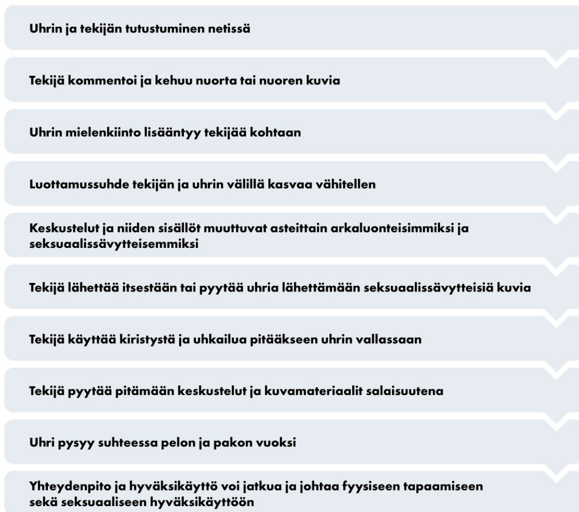
KUVA 1. Grooming-prosessin eteneminen tiivistettynä (Laitinen 2007, 34–35; Lampainen 2011, 80; Väestöliitto 2018, 8)

Grooming-prosessin eteneminen on kuvattu tiivistettynä alla olevassa kuvassa (kuva 1). Tapahtumat eivät aina etene juuri tässä järjestyksessä ja vaiheet tutustumisen ja fyysisen tapaamisen välillä voivat vaihdella tilanteesta riippuen. Huomion arvoista myös on, että koko prosessi voi tapahtua verkossa ilman fyysistä kontaktia reaali maailmassa, eikä yhdessä grooming-tapauksessa kaikkia vaiheita esiinny välttämättä ollenkaan.