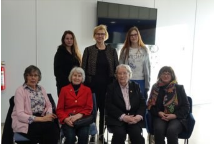
Kuvio 8. Pitkäaikaiset museon vapaaehtoistyöntekijät vierailmassa museon tiloissa opinnäytetyön toteutusvaiheessa helmikuussa 2020 (Sosiaali- ja terveysalan koulutuksen museo 2020).

Alun perin olimme pohtineet, että näyttelytekstit käännettäisiin myös englanniksi laajemman kohdeyleisön saavuttamiseksi, mutta yhteistuumin museovastaavan ja muiden näyttelyitä rakentavien opiskelijoiden kanssa päätimme näyttelyä pystyttäessä, että tässä vaiheessa työstämme ainoastaan suomenkieliset näyttelytekstit. Loimme Canva-sovelluksella pohjan näyttelyteksteille (liite 1). Tarkoitus oli, että sama pohja olisi ollut käytössä myös muiden opiskelijoiden rakentamien näyttelyiden näyttelyteksteissä museon yhtenäisen ilmeen luomiseksi. Näyttelytekstit oli tarkoitus tulostaa ja laittaa niille varattuihin muovitaskuihin, jotka tulisivat olemaan jalustoilla vitriinien välittömässä läheisyydessä. Koronaviruspandemia vuoksi Metropolian toimipisteet suljettiin äkillisesti viruksen leviämisen estämiseksi. Tästä syystä näyttelytekstien painatus ja esille laitto jäivät tekemättä keväällä 2020.