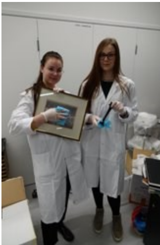
Kuvio 5. Valittujen museo-objektien puhdistusta (Räsänen 2020).

Museo-objektien valintaa seurasi niiden puhdistaminen (kuvio 5). Puhdistimme esineet laimealla etikkavedellä tai niiden puhdistamiseen soveltuvilla harjoilla ja liinoilla. Myös näyttelyvitriinien lasit pestiin lasinpesuaineella yhdessä terveydenhoitaja- ja sairaanhoitajaopiskelijoiden kanssa (kuvio 6). Puhdistetut esineet lastasimme kärryihin ja kuljetimme museotilaan ja sitten pääsimmekin suunnittelemaan esillepanoa.