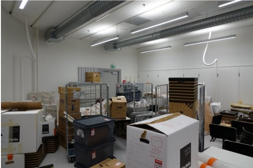
Kuvio 3. Luokkahuone Myllypurossa, johon laatikoihin pakatut museo-objektit oli tilapäisesti siirretty säilytykseen muuton yhteydessä (Räsänen 2020).