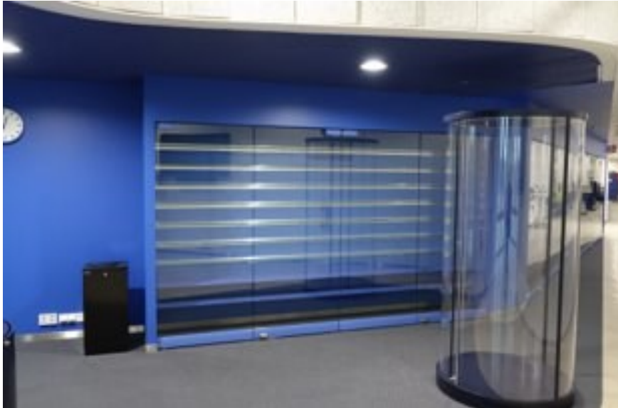
Kuvio 1. Vitriinit tyhjiään ensikäynnillä museossa (Räsänen 2020).

Virtuaalimuseo koostuu parista isosta näytöstä, joissa pyörii taukoamatta erilaisia esityksiä esimerkiksi valokuvia tai videoita sekä virtuaalilaseista, joiden kautta pääsee tutustumaan esimerkiksi terveydenhoitajan huoneeseen. (Räsänen 2019a.) Toimintaympäristöä olivat myös luokkahuone Myllypuron toimipisteen C-talon kolmannessa kerroksessa, johon museon esineet olivat väliaikaisesti varastoituna sekä museon virallinen varasto-tila.