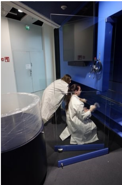
Kuvio 6. Näyttelyvitriinien puhdistusta yhdessä näyttelyprojektissa mukana olleen terveydenhoitajaopiskelijan kanssa (Räsänen 2020).