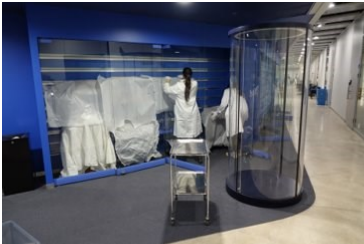
Kuvio 7. Vitriineihin aseteltujen esineiden peittäminen silkkipaperilla (Räsänen 2020).

Jokaisen pitkän työskentelypäivän jälkeen peitimme vitriinien lasit silkkipaperein (kuvio 7), jotta pikkuhiljaa valmistuva näyttely pysyisi piilossa uteliailta silmiltä. Olimme sopineet, että silkkipaperit poistetaan vasta avajaisissa, kun näyttely on täysin valmis.