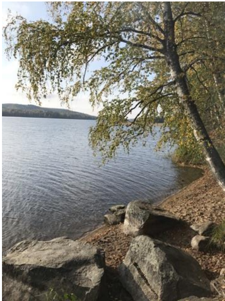
Kuva 8. Nuotiopaikka

Edellisenä päivänä oli käyty kaupassa ja ostettu retkeä varten tarvittavat elintarvikkeet. Retkelle tarvittavat välineet olivat pakattu mukaan reppuun sekä kestokassiin. Elintarvikkeiksi mukaan valikoitui hohkarisämpylöitä, broilerinakkeja sekä sianlihaa sisältäviä nakkeja, ketsuppia sekä pillimehujä. Lapsilla oli repuissaan omat juomapullot, joissa oli vettä. Erityisruokavaliot oli huomioitu suunnitellessa retken eväitä. Mukaan tuli ottaa myös puita sekä sytytysvälineet tulipaikalle. Retkikohteeksi valikoitui ennalta tuttu nuotiopaikka järven rannalla.