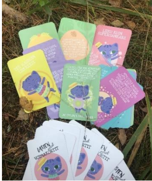
Kuva 7. Lasten omat voimakortit

Lepohetken jälkeen ennen välipalaa oli sopiva hetki toteuttaa muutamia toiminnallisia kortteja lasten kanssa. Toiminnassa käytettiin Hidasta elämää-sivuston (2018) kautta tutuksi tulleita lasten omia voimakortteja. Jokainen lapsi sai vuorotellen nostaa yhden kortin ja tehdä siinä mainitun tehtävän. Kortteja nostettiin muutamia ja näin välipalan odotuksesta tuli mieluinen hetki. Oppimisen osa-alueista aamupäivän toiminta vastasi sisällöltään; tutkin ja toimin ympäristössäni, kasvan, liikun ja kehityn, sekä kielten rikas maailma.