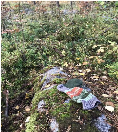
Kuva 4. Ensimmäinen tehtävä metsässä

Metsästä löytyi myös muitakin tavaroita kuin sinne etukäteen vietyjä. Esimerkkinä; eräs lapsista kantoi muovisen potkumopon ja peräkärryn ohjaajan luokse mieltäen sen metsään kuulumattomaksi.