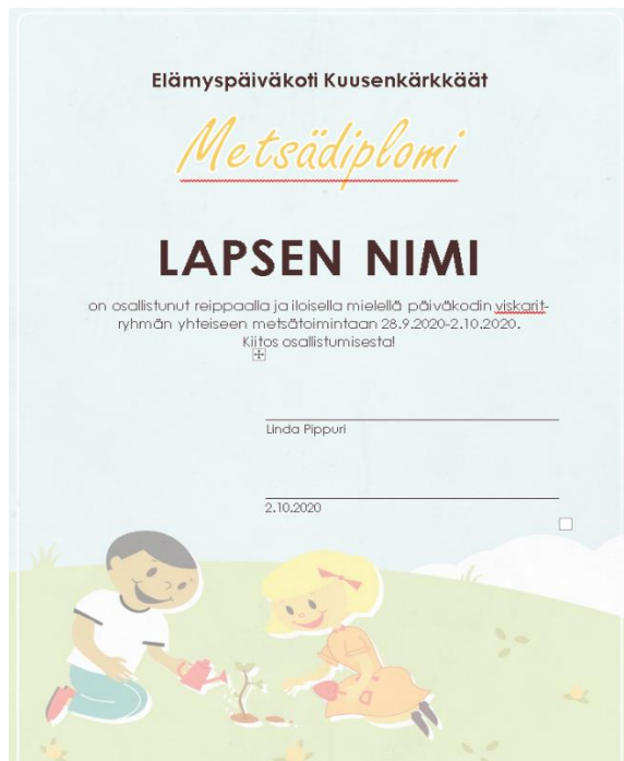
Kuva 10. Metsädiplomi

Aamupäivän ohjelmaksi perjantaille ei ollut suunniteltu muuta kuin siirtymä kauemmas retikohteeseen sekä siellä luonnossa toimiminen. Oppimisen osa-alueista toteutui tutkin ja toimin ympäristössäni, sekä liikun, kasvan ja kehityn. Päiväkodilta siirtyessämme nuotiopaikkaan myös liikenteessä liikkumisen taidot saivat mahdollisuuden kehittyä aikuisen valvonnassa. Metsädiplomit jaettiin paikalle oleville lapsille iltapäivän aikana ja osa lapsista saivat ne vasta seuraavan viikon aikana ollessaan päiväkodissa paikalla.