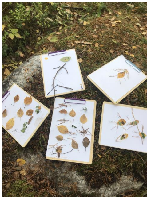
Kuva 5. Viskariryhmäläisten omakuvia

Seuraavana tehtävänä lapset saivat ideoida omakuvan. Materiaalit omakuvan tekemiseen tuli etsiä ja löytää ympäröivästä luonnosta. Työskentelyn aikana lapset tekivät rauhassa keskittyen omia töitään. He olivat jokainen valinneet metsästä itselleen mieluisimman paikan työskennellä.