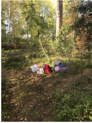
Kuva 3. Kokoontumispaikka

Metsään oli etukäteen käyty asettamassa erilaisia esineitä. Lapsia pyydettiin havainnoimaan mitä erikoista he huomaavat ympärillään. Huomaavatko he ympärillään jotain tavaroita mitkä eivät kuulu metsään. Jokainen lapsista löysi esineen, jonka toi ohjaajan luokse. Metsään oli etukäteen viety seuraavia esineitä; patterirasian, virvoitusjuomatölkin, muovipullon, villasukkan, vessapaperia, keksirasian, sanomalehden, muovikassin, hernekeittopurkin sekä palan styroksia.