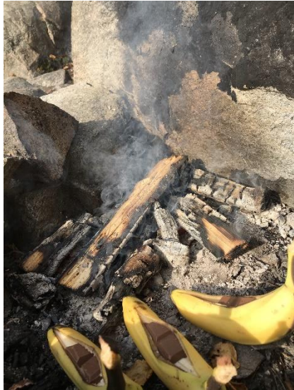
Kuva 9. Jälkiruoka

Osa lapsista toi paksumpia keppejä ja osa hyvin ohuita. Ruoanvalmistuksen ajan lapset leikkivät metsässä omatoimisesti. Ohjeistuksena heillä oli nähdä aikuinen koko ajan. Jälkiruoksi oli suunniteltu nuotiolla tehtäviä suklaabanaaneja. Niitä varten oli ostettu banaaneja sekä maitosuklaata. Kyseinen paikka ei ollut lapsille tai työparilleni entuudestaan tuttu. Lapset jaksoivat kävellä perille ja paikasta tuli myös jatkoa ajattelun tuttu heille.