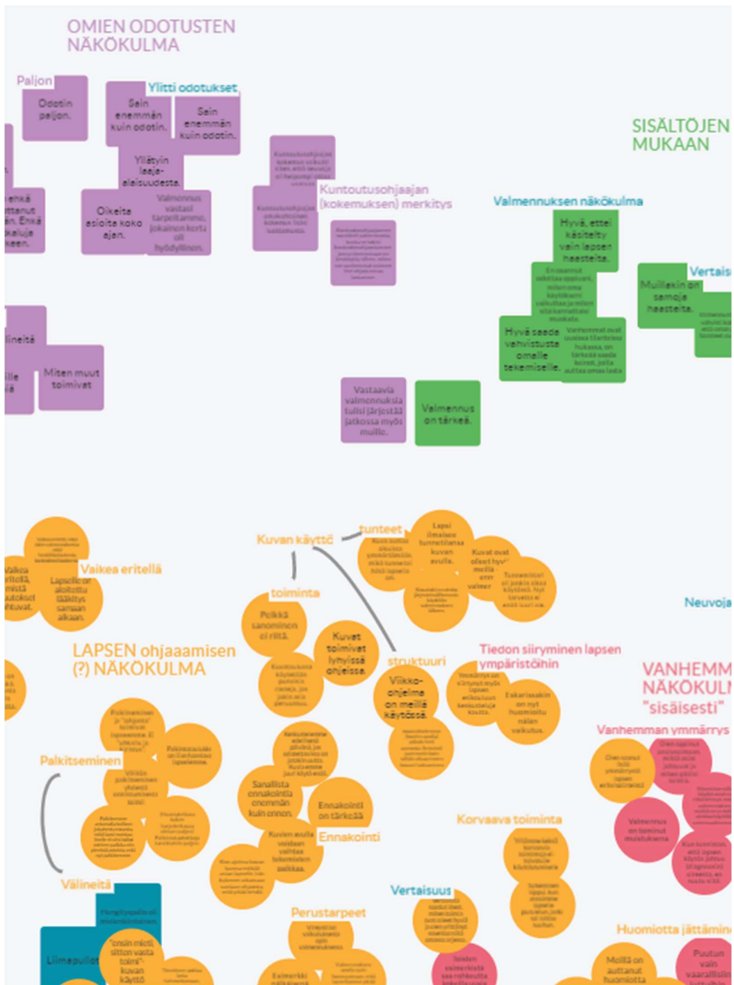
Kuvio 1. Kuvaote Flinga-verkkotyökalun käytöstä haastattelujen analysoinnin aikana