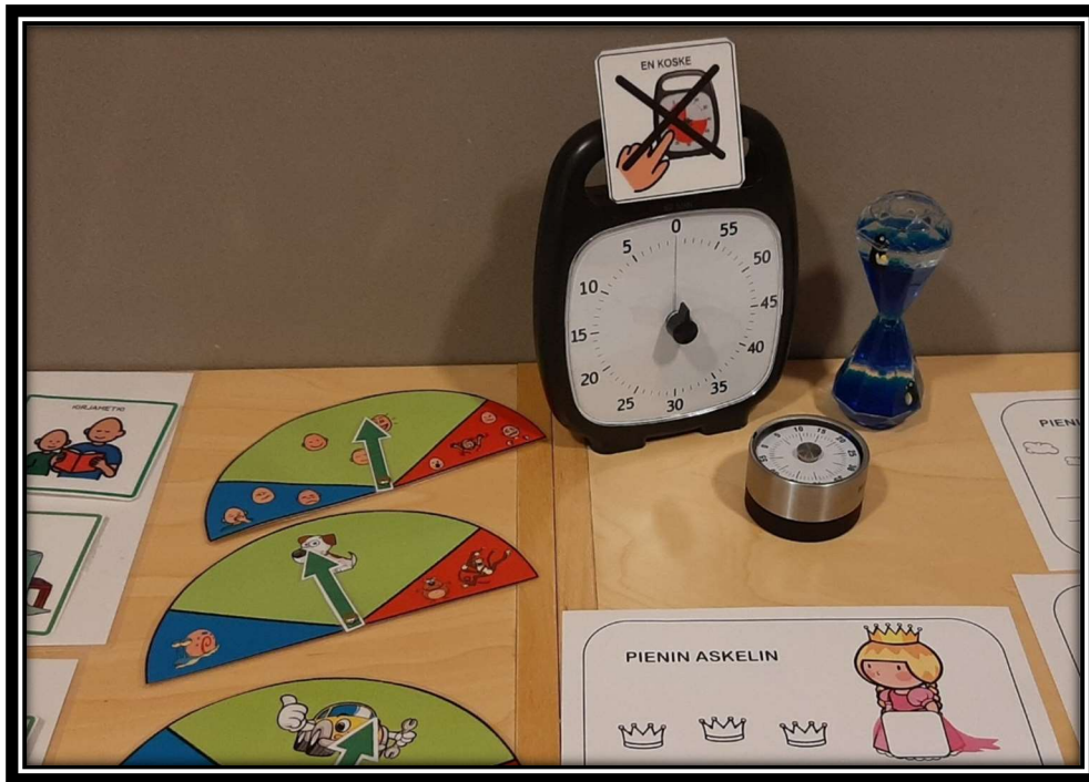
Kuvio 3. Materiaalin esittelypöytä Toimiva Perhearki -valmennuksessa.

Yhteinen ja yleinen kokemus haastatelluilla oli, että valmennus ylitti heidän odotuksensa ja yllätti laaja-alaisuudellaan. Eräs vanhempi kertoi kokeneensa, että koko valmennuksen ajan ja joka kerralla oltiin aivan ”oikean asian äärellä.” Vaikka haastateltavilla oli erilainen kokemus ennakkoon siitä, vastaako valmennus juuri heidän tarpeitaan, koki jokainen valmennuksen ainakin jossain määrin merkittävänä, ”että vielä enemmän kuitenkin se auttaa meitä, että me saadaan ne keinot, mitenkä me voidaan lastamme auttaa.” Kaikki haastateltavat sanoivat, että ainakin jossain vaiheessa tällainen valmennus olisi ollut erittäin ajankohtainen.