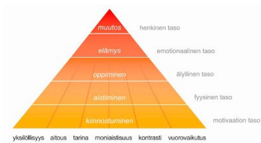
Kuvio 1. Elämyskolmio-malli (LEO. Tarssanen 2009).

Asiakkaan kuuluu myös kokea vuorovaikutusta tuotteen, tuottajien sekä mahdollisesti muiden asiakkaiden kanssa. Yhdessä kokemisen tunne on monille suuri asia, joka vahvistaa elämäyksestä syntyvää tunteellista muistijälkeä. (Tarssanen 2009, 14–15.) Kaikki nämä mainitut elementit voidaan liittää myös hyvin tarinallistettuun palveluun, sillä tarinallistaminen itsessään on elämystä liittävä tarina.