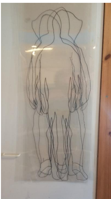
Kuva 7. Installaation isot kuvat, valmis ripustus Imatran taidemuseolla

Installaation kuvat kuvastavat liikkuvaa teinipoikaa, joka on kääntänyt selkensä ja on menossa jonnekin. Ääriiviipiiirustus läpinäkyvällä muovikalvolla kuvastaa mielestäni jotain epämääräistä, aavetta, joka liikkuu ilmassa leijaillen. Tämä tuo mieleeni kiusatun, joka kulkee mieluummin yksin ja pysyy poissa muiden katseilta. Kehonkieli paljastaa jotain hahmon tunnetilasta. Samalla tuo muovin läpinäkyvyys antaa katsojalla mahdollisuuden katsoa hahmon läpi, katsoja ei näe koko hahmoa. Tämä muistuttaa siitä miten kiusattua monasti kohdellaan, ei haluta tai osata nähdä häntä tai nähdään vain ympäristö (kuva 7). Kiusattu jää yksin.