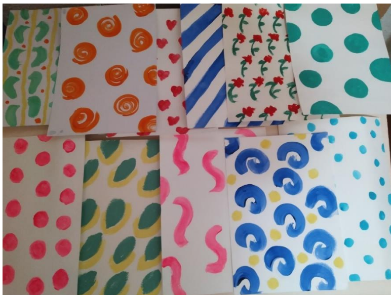
Kuva 3. Taustakuvioita

asiaksi. Kuten kiusaamisessakin, päältäpäin asiat saattavat näyttää hyvältä, mutta lähempi tarkastelu paljastaa jotain ihan päinvastaista (kuva 4).