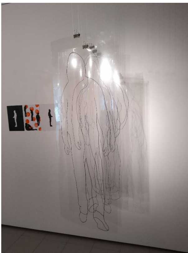
Kuva 14. Valmis teos Imatran taidemuseolla

Halusin tuoda teokseen mukaan jonkinlaista liikettä ja sain idean installaatiosta, joka koos-tuu katosta roikkuvista isoista muovikalvoista. Piirsi läpinäkyville muovikalvoille mustalla tussilla liikkuvan hahmon ääriviivat. Jokaisella kalvolla hahmo on hieman eri asennossa ja katsoja saa vaikutelman poispäin kulkevasta hahmosta. Tätä liikettä korostaa ilmavirta, joka saa muovit hetkellisesti kevyesti liikkumaan. Lisäksi näyttelytilassa oleva kohdevalaisin saa aikaan kuvien heijastuksen seinään. Tämä tuo yhden mielenkiintoisen lisäulottuvuuden in-stallaatioon. Tässäkin oli kyseessä sama teinipojan hahmo, joka kuvaannollisesti jatkaa kul-kuaan ulos pikkukuvista poispäin jonnekin tuntemattomaan (kuvat 14 ja 15).