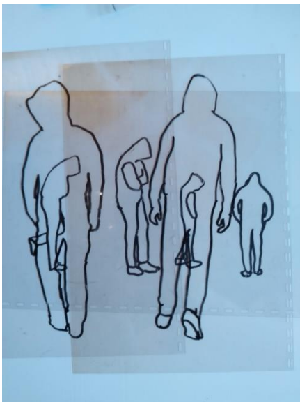
Kuva 5. Tussipiirrosluonnoksia muovikalvolle

Isoihin muovikalvoihin halusin saada liikkeen ja ajan tuntua. Minua viehätti edelleen musta tussi ja yksinkertainen viiva. Luonnoksia tein A4-kokoisille muovikalvoille (kuva 5).