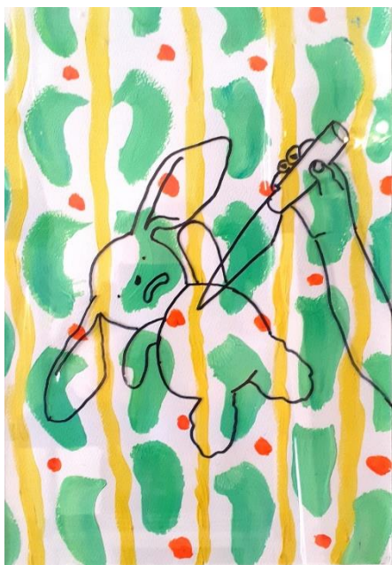
Kuva 9. Kiusattu 1. teoskuva (Laajo 2021)