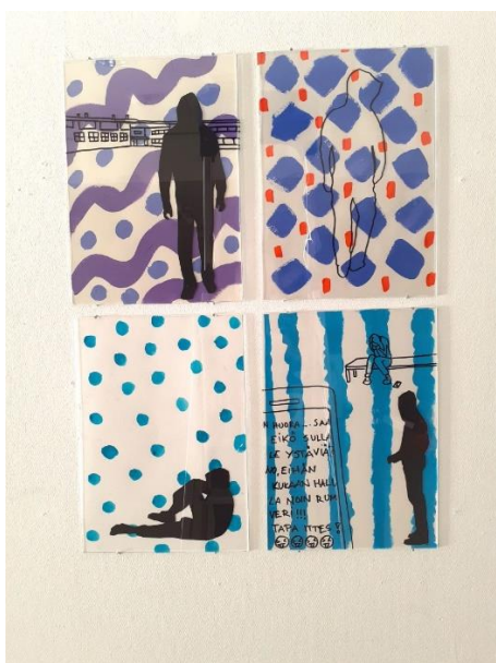
Kuva 13. Siniset pallot ja raidat ja musta hahmo teoskuvat 8 ja 9 (Laajo 2021)

Muovikalvojen alle tein paksulle vesiväripaperille erilaisia värikkäitä kuviomaalauksia akryyliväreillä. Ideana oli tehdä vastakohta tussipiirrokselle sekä viitata kuvalla koulumaailmaan. Lapset pitävät kirkkaista väreistä ja akryylivärejä käytetään kouluissa. Ajatukseni oli myös yhdistää jotain iloisen väristä vakavan aiheen taustalle. Esimerkiksi erikokoiset värikkäät pallot antavat kuvassa 12 viitteitä ulkomaailmasta, jossa ulkoapäin kaikki on järjestyksessä, mutta kiusattu onkin jäänyt ulkopuolelle. Toisessa kuvassa tumma hahmo seisoo kuvan oikeassa alalaidassa ja taustalla istuu tytön hahmo itkemässä, taustaan olen maalannut siniset pystyraidat. Ne tuovat mieleeni vankilan kalterit tai puunrungon, jonka takana tumma hahmo piileksii. Tilanne kuvaa sosiaalista mediaa, jossa voi nimettömänä lähettellä kaikenlaisia viha- ja törkyviestejä anonyymina. Kiusattu on todella yksin ja puolustuskyvytön tällaisissa tilanteissa (kuva 12).