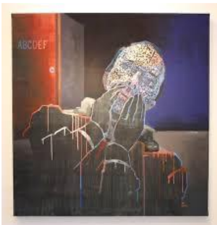
Kuva 1. Pekka Homanen, Kaappi, 2016, öljy kankaalle, 120 x 150 cm (Galleria Kajaste 2019)

Oululainen kuvataiteilija Pekka Homanen on käsitellyt koulukiusaamista sekä veistoksissaan että maalauksissaan. Hänen teossarjansa B-luokka kuvaa sitä hämmennystä, jota kiusatuksi tullut kokee koulussa. Homanen on maalannut kirjaimia, jotka symboloivat sanoja, jotka voivat satuttaa ja joita kiusattu ei voi ennakoita. Eri asiat satuttavat eri ihmisiä (kuva 1).