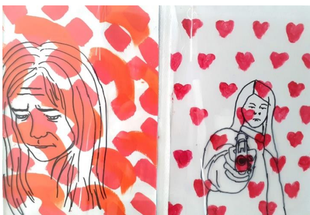
Kuva 10. Kiusattu 2. ja 3. teoskuva (Laajo 2021)

Teoksen neljäs ja viides kuva (pikku tyttö sormi suussa ja poikajoukon jalat) kuvaavat kiusatun joutumista naurunalaiseksi (pellenaamio tytön kasvoilla) ja kiusaajien taholta tulevaa väkivallan uhkaa (sormi osoittaa tyttöön). Sanallinen kiusaaminen voi muuttua fyysiseksi väkivallaksi (kuva 11).