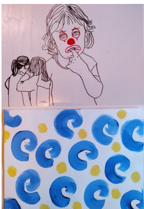
Kuva 4. Tussipiirros muovikalvolle ja taustakuvio paperille

Kuvat päällystin pleksimuovilla, jotta ne näyttäisivät siistimmiltä. Pleksi sopi kuviini siinä mielessä hyvin, että ne toimivat myös peileinä katsojalle. Pleksin pinta heijasti kuvan katsojasta ja ympäristöstä. Tämäkin kuvaa mielestäni kiusaamiseen suhtautumista, katsotaan vääriä asioita eikä nähdä olennaisinta, mihin pitäisi puuttua. Myös pleksin pinta on kova, läpitunkematon, se voisi kuvastaa kiusatun eristyneisyyttä ympäristöstä. Kiusattu joutuu