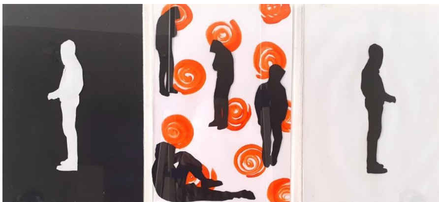
Kuva 12. Paperileikkaushahmoja teoskuvat 10,11 ja 12 (Laajo 2021)