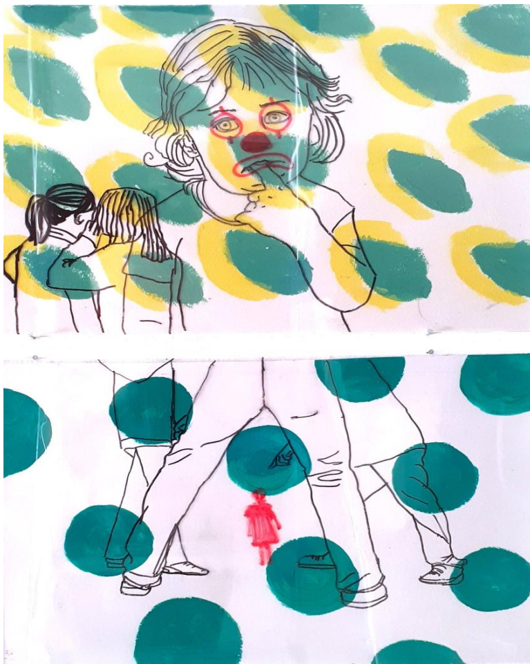
Kuva 11. Kiusattu 4. ja 5. teoskuva (Laajo 2021)

Kuvat kuudesta kahteentoista kuvaavat teinipojan eri olotiloja. Kiusatusta voi myös tulla kiusaaja tai hiljainen hyväksyjä, joka seuraa sivusta, kun jotakin kiusataan. Nykyisin on yleistä myös sosiaalisessa mediassa kiusaaminen. Puhelimella voi nopeasti lähettää viestejä eikä kukaan pysty estämään niitä. Näihin kuviin tuli mukaan mustasta paperista leikkaamani teinipojan hahmo. Viime vuoden syksyllä tapahtunut teinipojan väkivaltainen kuolema jäi voimakkaasti mieleeni, kun luin aiheesta lehdestä. Mustavalkoiset kuvat kuvaavat mielestäni tilannetta, jossa henkilö voi olla toisessa tilanteessa hyvä, toisessa paha (kuvat 11).