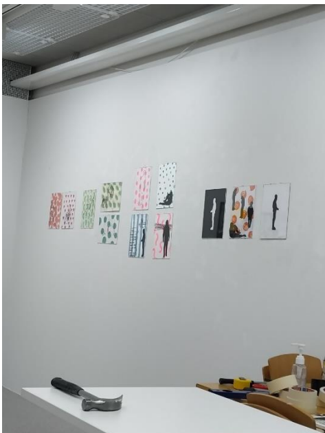
Kuva 6. Kuvien sommittelua seinälle

Installaation kuvat kuvastavat liikkuvaa teinipoikaa, joka on kääntänyt selkensä ja on menossa jonnekin. Ääriiviipiiirustus läpinäkyvällä muovikalvolla kuvastaa mielestäni jotain epämääräistä, aavetta, joka liikkuu ilmassa leijaillen. Tämä tuo mieleeni kiusatun, joka kulkee mieluummin yksin ja pysyy poissa muiden katseilta. Kehonkieli paljastaa jotain hahmon tunnetilasta. Samalla tuo muovin läpinäkyvyys antaa katsojalla mahdollisuuden katsoa hahmon läpi, katsoja ei näe koko hahmoa. Tämä muistuttaa siitä miten kiusattua monasti kohdellaan, ei haluta tai osata nähdä häntä tai nähdään vain ympäristö (kuva 7). Kiusattu jää yksin.