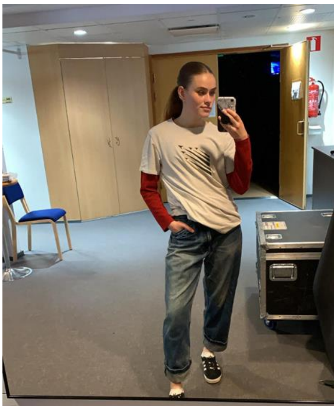
KUVA 1. Minä Jets poikarooliasu päällä, tanssivideon kuvaukset.

Toisessa tanssijais- kohtauksen parinani toimi Sharks -jengin johtajan Bernardon roolia esittävä muusikko, näin ollen vaikka tanssivideolla ei ollut enää oikeat West Side Storyn roolihahmot, minun paikattessa roolini oli hänen tyttöystävänsä Anita. Jengien omissa batle -tanssi kohtauksissa saimme esittää parina oman pienen temppuhetken. Oli antoisaa päästä tekemään parityöskentelyä monen eri ihmisen kanssa ja heittäytyä aina eri lailla paritanssi osuuteen. Toisen kanssa tanssiminen voi olla joillekin yksilötanssijoille alkuun erilaista, mutta itselle toisen kanssa tanssiminen ja tanssin ilon jakaminen on antoisaa. Tanssijais- kohtauksessa olikin paljon myös omaa improvisoitua tanssia, eli ei koreografioitua. Minulla ja molemmilla tanssijais- pareillani tämä heittäytyminen onnistui ja oli hauskaa tanssia yhdessä.