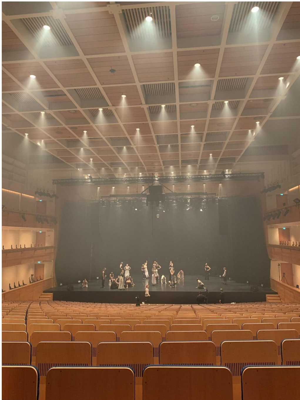
KUVA 3. Kuvauspäivän aamu, Kuopion Musiikkisekueksen konserttisalin lava.