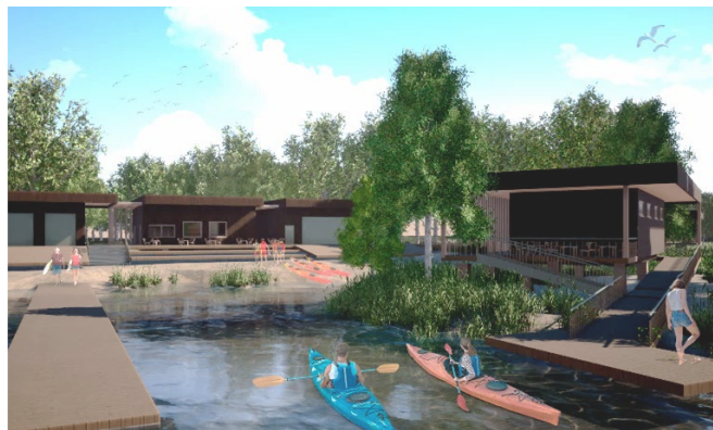
Visualisointikuva näyttää, millainen melontakeskus voisi olla

Melontakeskuksesta laadittiin viitesuunnitelma. Suunnitelmassa otettiin huomioon alueen ympäristö, kulkuyhteydet sekä toimintojen vaatimukset turvallisesti ja esteettömästi eri käyttäjäryhmien mukavuus huomioiden.