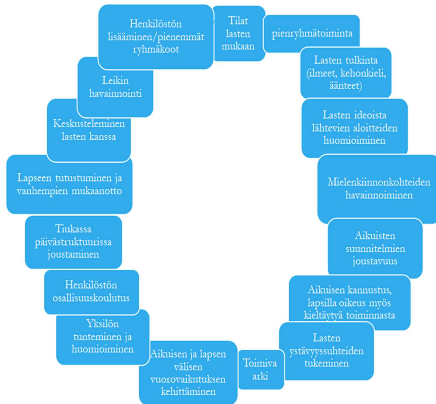
Kuva 3. Osallisuutta lisäävät keinot kyselyn pohjalta