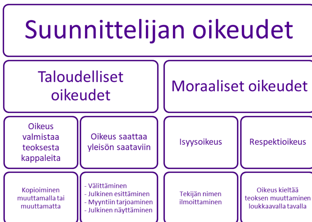
KUVA 1. Suunnittelijan tekijänoikeudet

Suunnittelijan tekijänoikeudet teoksen tekijänä ovat kuvattuna kuvassa 1. Oikeudet jaetaan tekijänoikeuslaissa sekä kirjallisuudessa yleensä taloudellisiin ja moraalisiin oikeuksiin. Nimitykset tulivat tekijänoikeuslakiin vasta vuonna 2015 lakiuudistuksen takia, kun lakiin lisättiin väliotsikot (HE 181/ 2014). Haarmannin (2014, 69) mukaan taloudellisten oikeuksien tarkoituksena on tuottaa yksinoikeus tekijälle, jolloin hän voi päättää millä tavoin teosta käytetään vai käytetäänkö ollenkaan, kun taas moraalisten oikeuksien tarkoituksena on suojata tekijän persoonallisuutta.