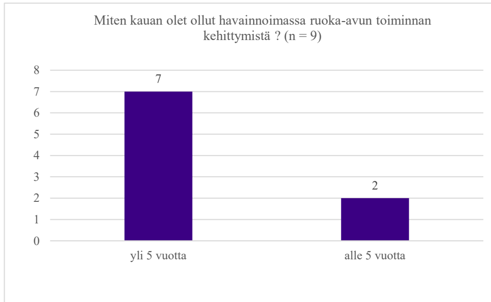
Kuvio 1. Kyselyyn vastanneiden diakoniatyöntekijöiden työkokemus

Kaikki pitivät ruoka-aputoimintaa erittäin tarpeellisena ja tarkoituksenmukaisena seurakunnan auttamistyössä. Etenkin yllättävässä kriisissä kun yhteiskunnan taloudellisen tuen hakuprosessi on kesken, nähtiin että kirkko pystyy auttamaan nopeasti. Ja vaikka apu on vähäistä, se on sitä saavalle silti erittäin merkityksellistä. Diakoniatoimistojen kuivaelintarvikkeet saattavat auttaa oleellisesti tilanteessa, missä ruoka-osto-osoitusta ei voida jostain syystä kirjoittaa. Vahvasti koettiin, että juuri ruoka-apu on oleellinen osa seurakunnan työtä, koska on jatkuvasti ihmisiä, jotka tippuvat yhteiskunnan turvaverkon läpi ja kirkon kuuluu heitä auttaa. Oli huomattu, että ruoka-aputyö on kuitenkin lähinnä ensiapua, kenenkään taloutta se ei pitkällä aikavälillä voi ratkaista. Toisaalta löytyi myös havaintoja, että osalle ruoka-avun hakemisesta oli tullut tapa, jolla pystyy siirtämään osan käyttövaroista muuhun tarkoitukseen. Pidettiin tärkeänä, että ruoka-avun myöntämiselle olisi selkeät kriteerit ja myöntämisperusteet.