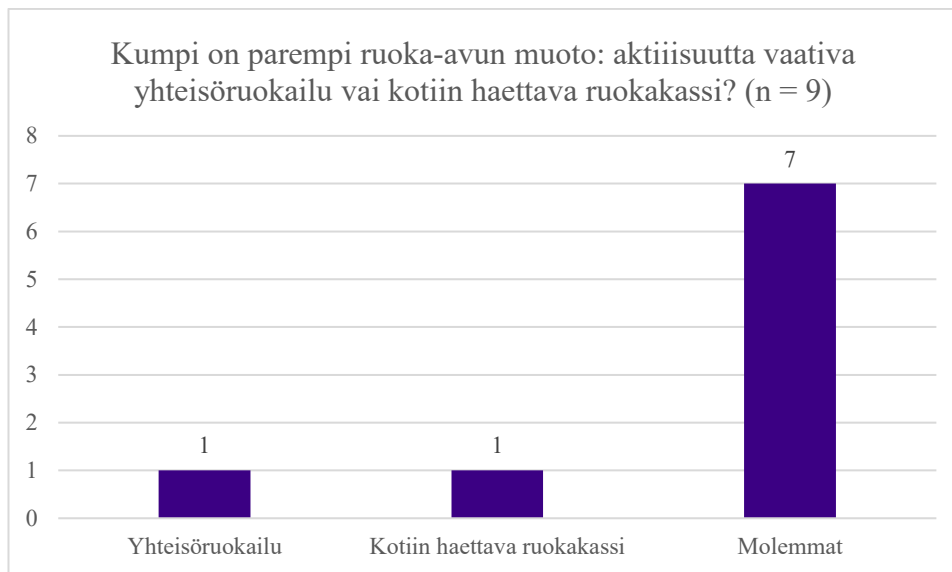
Kuvio 4. Ruoka-avun muotojen vertailu

Jos on mahdollista, pitäisin molemmat vaihtoehdot. Jos on pakko valita, valitsisin yhteisöruokailun, jos on tilat sitä varten. Aktiivisuuden lisääntyminen ja sosiaaliset kontaktit lähtökohtaisesti parantaa ihmisen elämän laatua. Toki tiedostan sen, että kaikki eivät pysty/ halua tulla yhteisöruokailuihin. Siksi siis molemmat mieluiten.